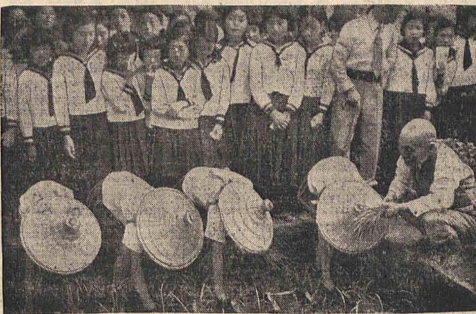
Z sianem ryżu połączone są w Japonii uroczyste obrzędy.

Uliczni przekupnie masowo obsadzili wszystkie wyjścia przy lokalach, gdzie odbywały się zabawy, ofiarując po wyjątkowo niskich cenach baloniki, kwiaty i t. d. Dorożkarze i szoferzy, którzy liczyli na powodzenie zawiedli się również, gdyż naogół ruch był minimalny. W domach prywatnych również nie urządzano przyjęć i ograniczono się do składania życzeń.