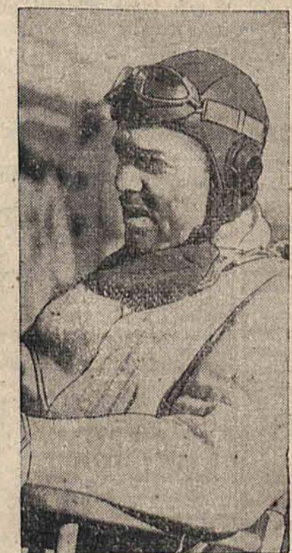
Clark Gable gra rolę główną w „Brawurze”.