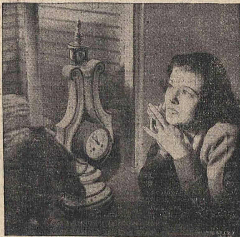
W oczekiwaniu magicznego uderzenia...