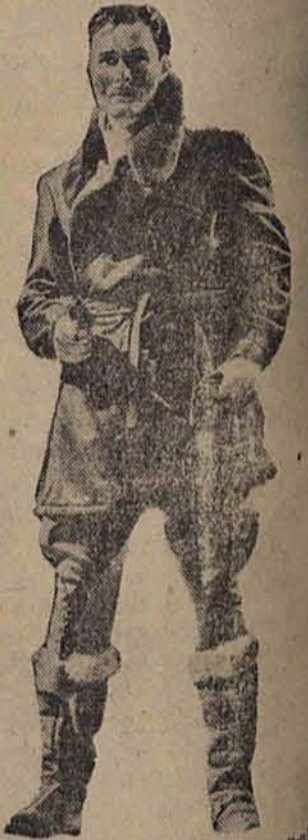
W tym swoim najnowszym filmie Flynn sam jeden dokonał bohaterstwa, który cały świat przejął podziwem.