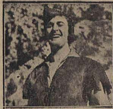
W tym filmie Flynn gromił możnych, aby pomagać biednym i zdobył serce Lady Marian.