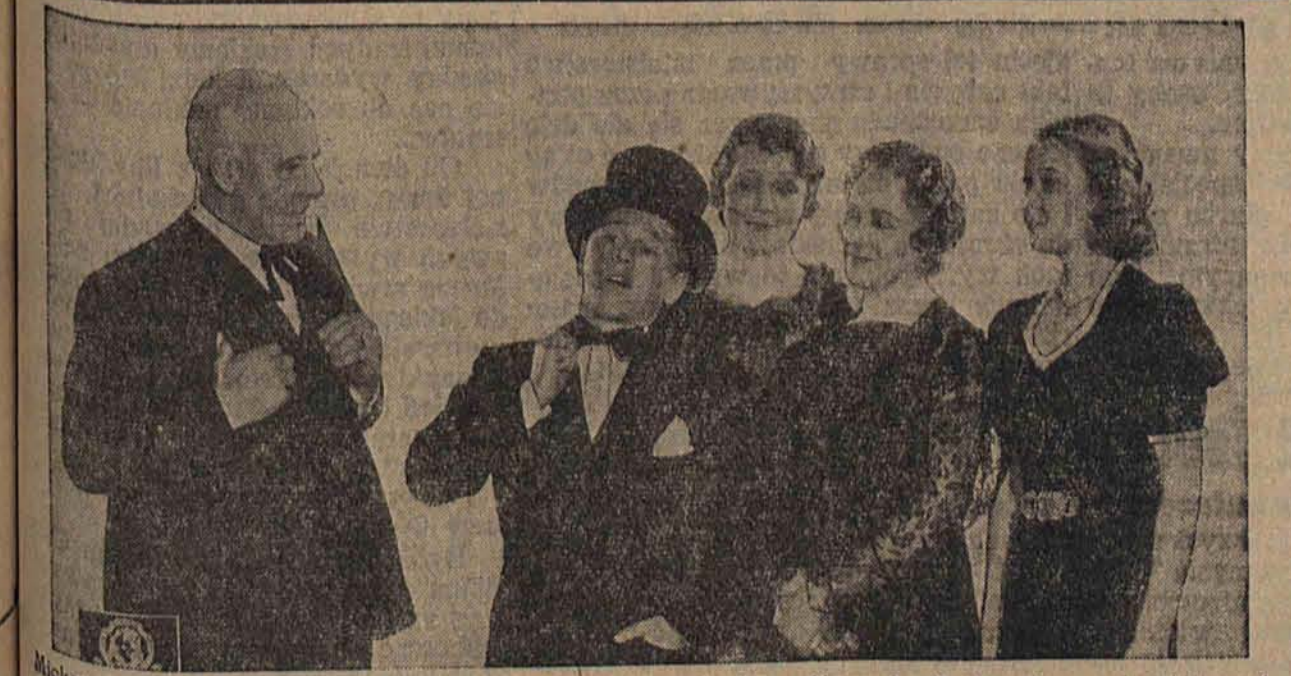
Mickey Rooney, Lewis Stone, Cecilia Parker — odtwórcy głównych ról słynnej amerykańskiej serii filmów p.t. „Rodzina sędziego Hardy”.