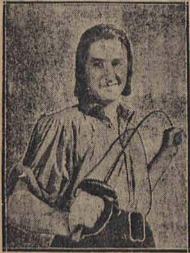
W tym filmie Flynn pokonał pirata Levasseur'a i podbił serce uroczej Arabelli.

Wielki konkurs z nagrodami wytwórni Warner Bros