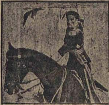
Tutaj Flynn dokonał szaleńczej szarży i wyrzekł się ręki pięknej Elzy.