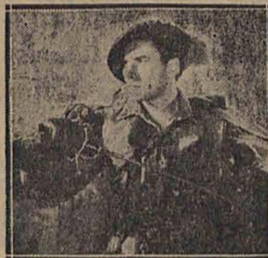
Tu był obrońcą uciśnionego małego królewicza i wrócił mu tron.