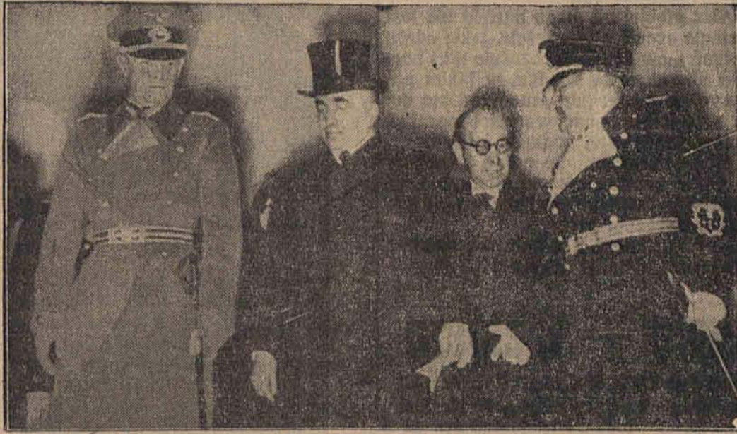
Na zdjęciu widzimy b. prezydenta Czechosłowacji dr. Hacha w towarzystwie b. ministra spraw zagranicznych Chvalkowsky'ego w chwili przybycia do kanclerza Hitlera.

Zresztą w tym samym czasie radio nie przestało głosić, że „państwo czeskie pęka we wszystkich szwach i że jego kierownicy nie są w stanie opanować