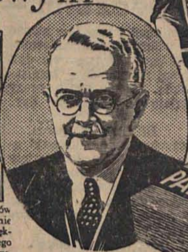
Dr Dafoe lekarz-oplekun pięćcióraków.

Wobec przedwczesnego urodzenia się Pięćcióraków Kanadyjskich tylko olejek oliwkowy był dostatecznie łagodny dla ich skóry! Później Dr Dafoe z największą starannością wybrał dla nich mydło. Wybór jego padł na Palmolive, mydło na olejku oliwkowym! Przykład ten powinien być naśladowany przez każdą kobietę, która dba o skórę swego dziecka i własną cerę. Używaj mydła Palmolive do codziennej kąpieli.