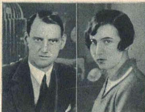
Zaręczyny w duńskim domu królewskim: ks. Frederik i ks. szwedzka Ingrid.