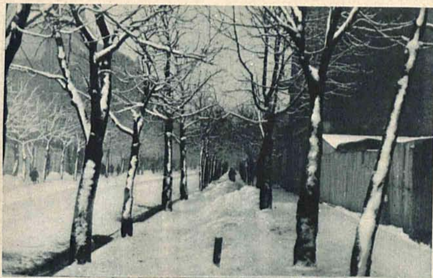
Łódź zasypana śniegiem.