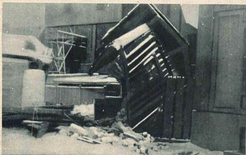
Niezwykła katastrofa. Przy dworcu Łódź-Fabryczna wagon towarowy wyskoczył z szyn i potoczył się na domek kolejarza, który zniszczył doszczętnie. Ilustracja przedstawia miejsce katastrofy.