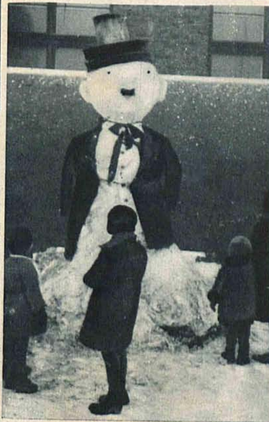
Dzieci ulepiły bałwana.