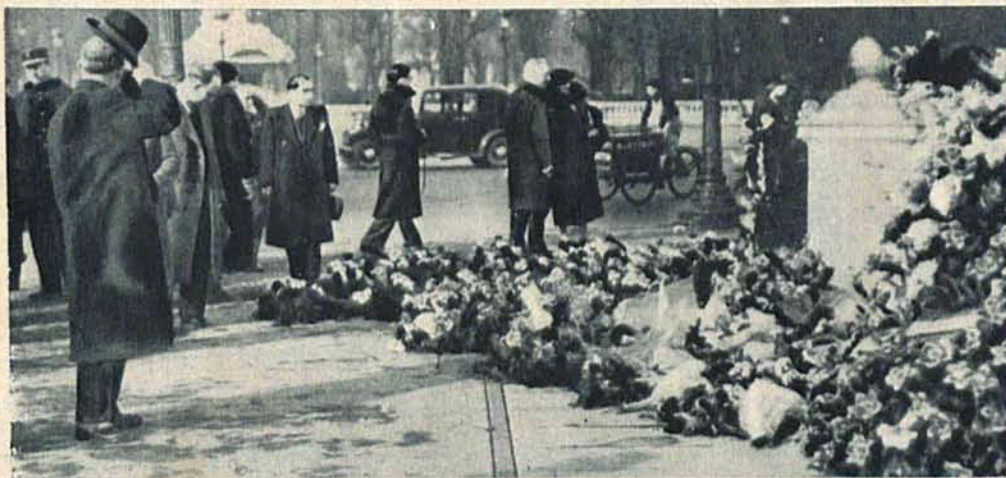
Paryż obchodzi rocznicę krwawych walk w dniu 6-go lutego, które miały miejsce w zeszłym roku na placu Zgody.