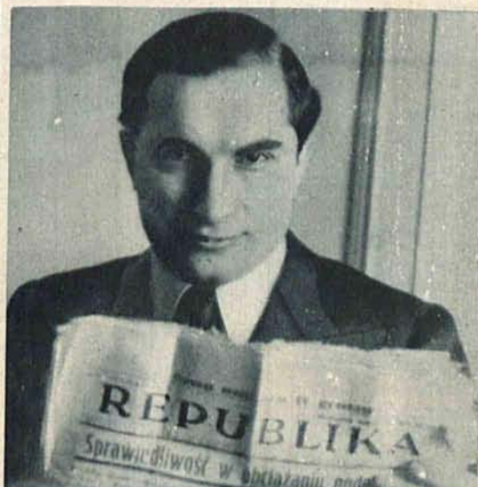
Znakomity śpiewak, Józef Schmidt, podczas tournée zawiązał do Łodzi. Pochodzi z Bukowiny, zna język polski i czyta z zainteresowaniem „Republikę”.