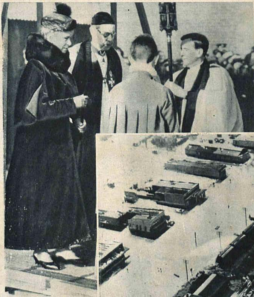
Królowa angielska Mary bierze udział w poświęceniu kamienia węgielnego pod budowę kościoła w Mile Cross.