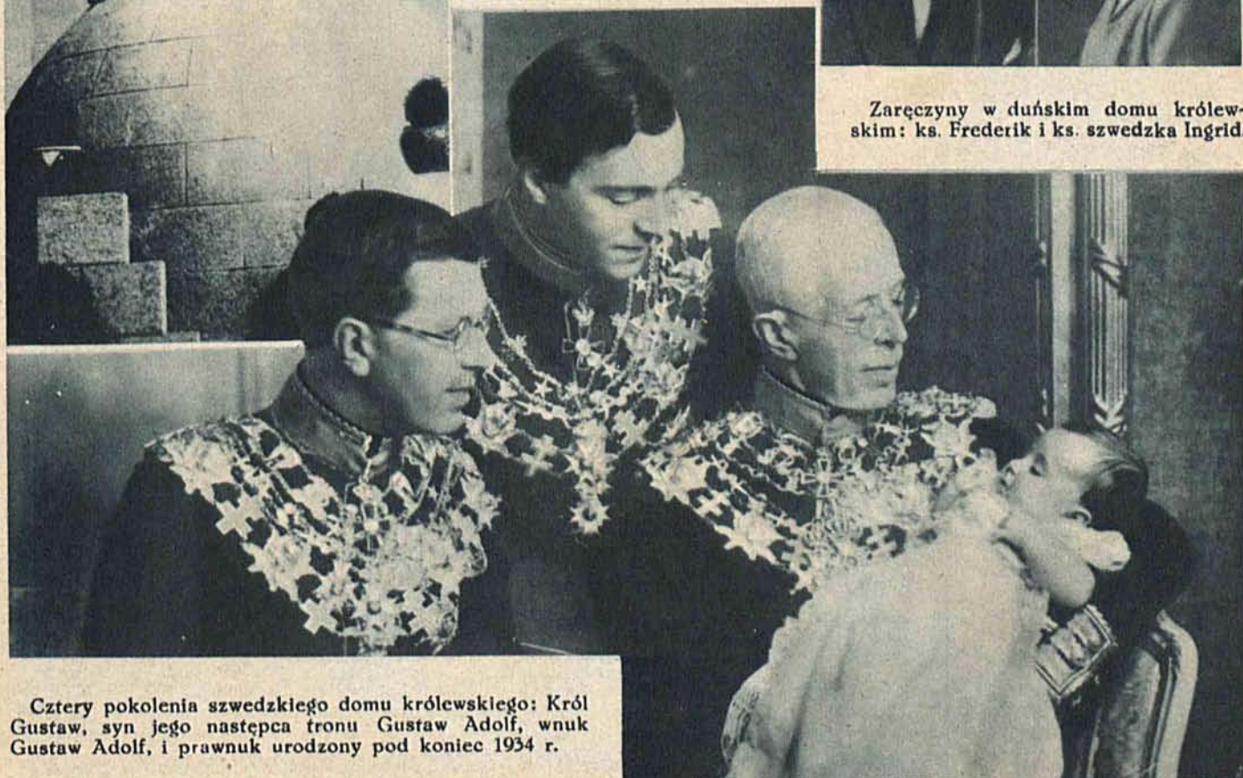
Cztery pokolenia szwedzkiego domu królewskiego: Król Gustaw, syn jego następcy tronu Gustaw Adolf, wnuk Gustaw Adolf, i prawnuk urodzony pod koniec 1934 r.