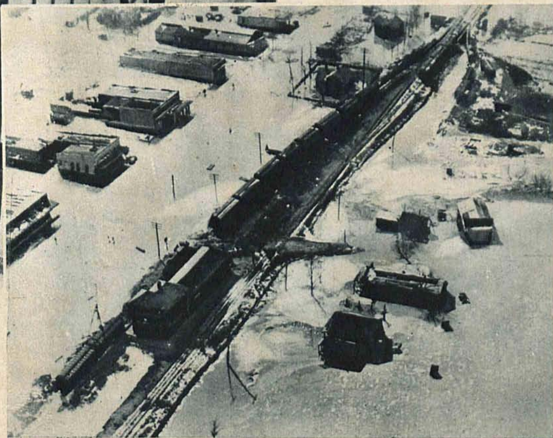
Na prawo: Widok miasteczka Sledge zatopionego przez wody rzeki Mississippi.