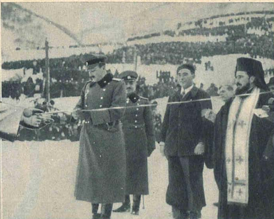
Brat króla bułgarskiego ks. Cyryl, otwiera skocznię narciarską, która jest największą na Bałkanach. W głębi min. oświaty gen. Radeff.