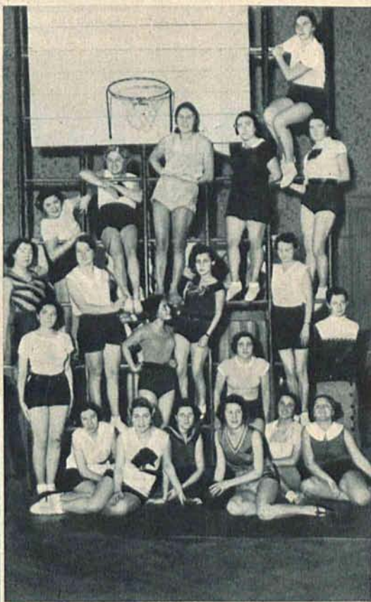
Z kursu wychowania fizycznego kobiet w Łodzi. Kurs dla przodownic gier sportowych.