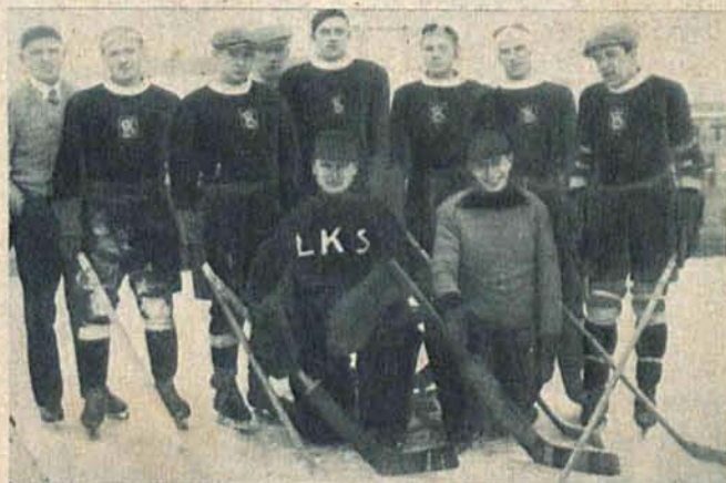
Zespół hokejowy Łódzkiego Klubu Sportowego, który po zwycięstwie nad Triumphem zdobył tytuł mistrza łódzkiej klasy A.