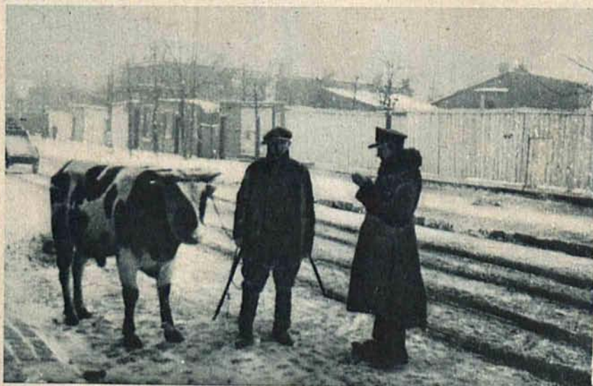
Przepisy o ochronie zwierząt są ostatnio ściśle przestrzegane. Policjant spisuje protokół za okaleczenie nóg zwierzęcia.