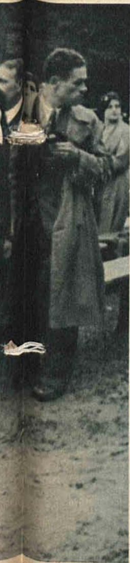
pat. Za p. Prezydentem