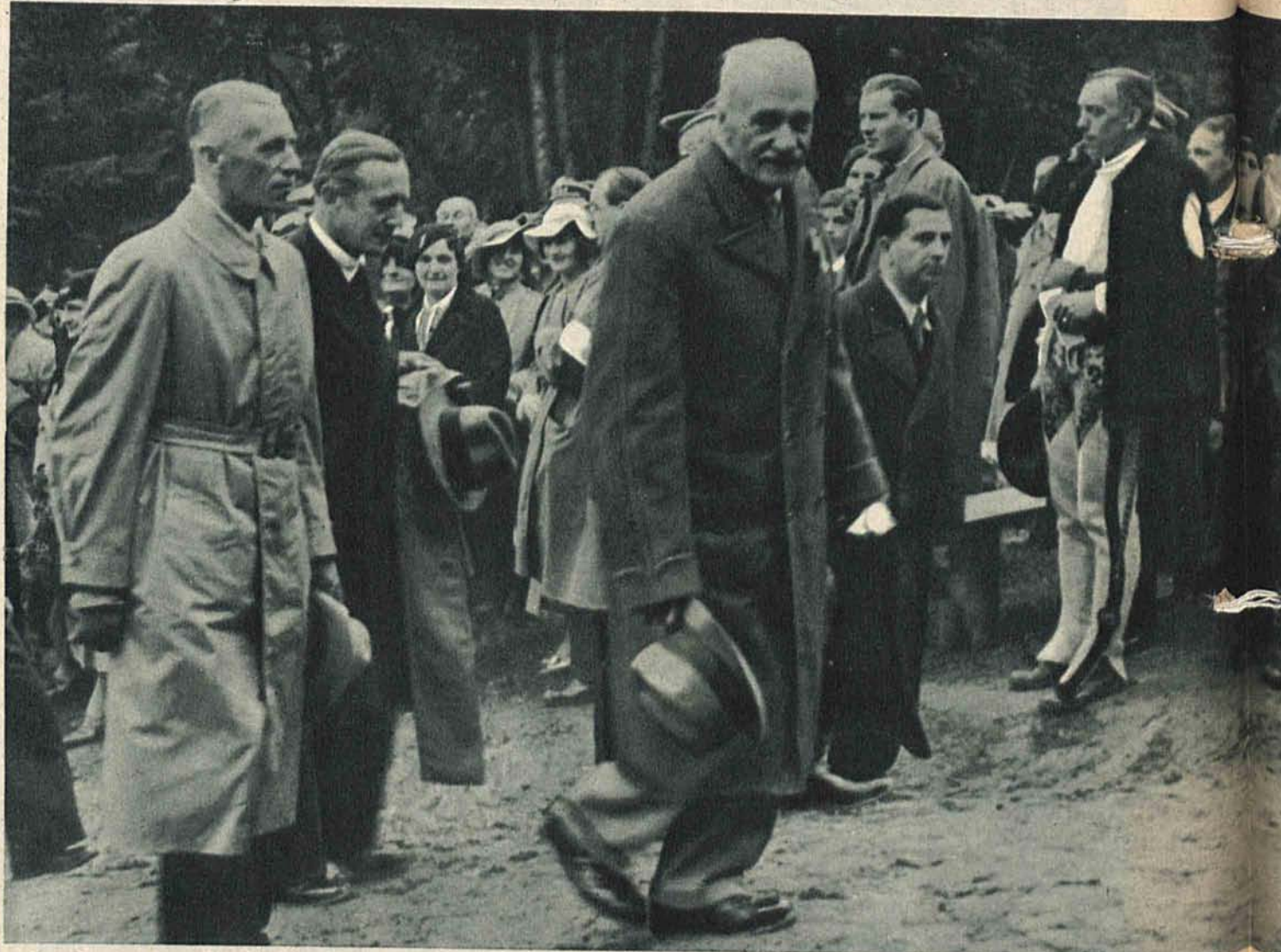
Pan Prezydent udaje się do Jaszczurówki w dniu 11-go b. m. gdzie mają mu złożyć hołd delegacje górali z całych Karpat. Za widozorni pp. wojewoda krak. Raczkiewicz i wicemin. Bobkowski, prezes Polskiego Związku Narciarskiego.