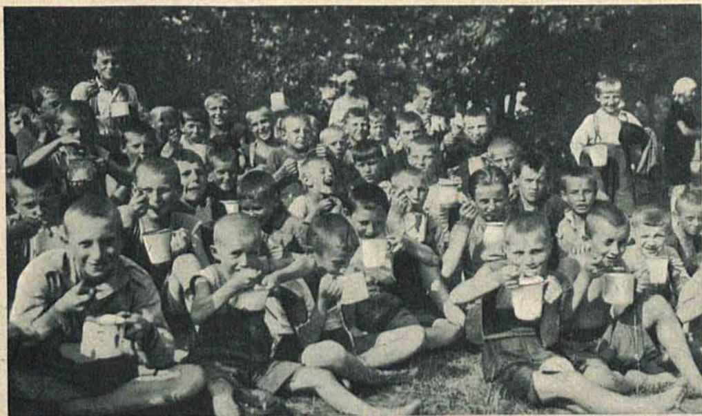
Dzieci robotnicze łódzkie na półkolonji w Parku 3-go Maja podczas obiadu.