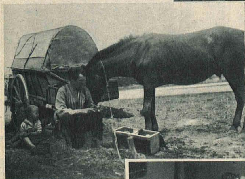
Szewc w podróży naokoło Polski

W tych dniach na Chojnach na Starej-Górcie podczas budowy wodociągów trysnęła pierwsza woda dla mieszkańców Łodzi.