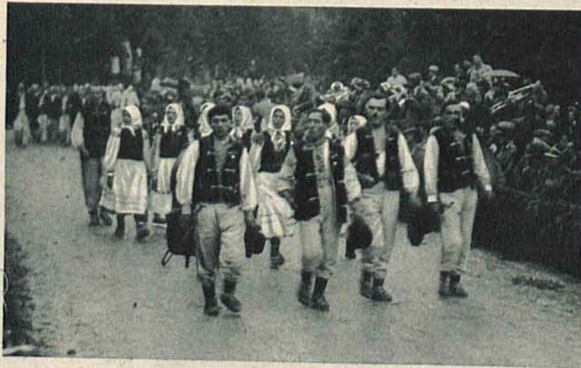
Delegacje góralskie w pochodzie.