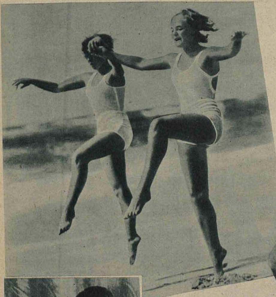
Baletnice na plaży.