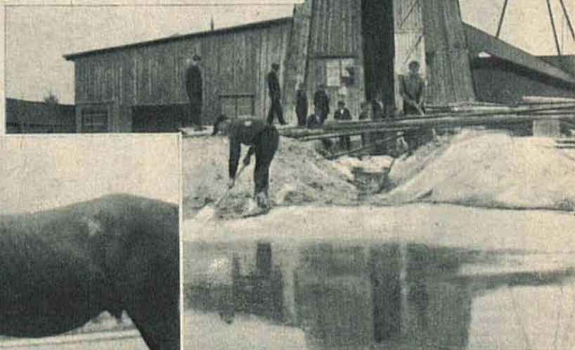
Nowa era w dziejach Łodzi

W tych dniach na Chojnach na Starej-Górcie podczas budowy wodociągów trysnęła pierwsza woda dla mieszkańców Łodzi.