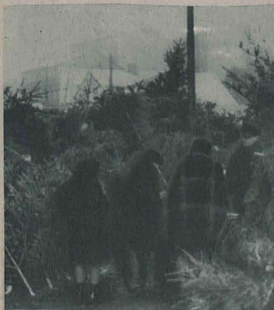
Podwórzowy św. Mikołaj.