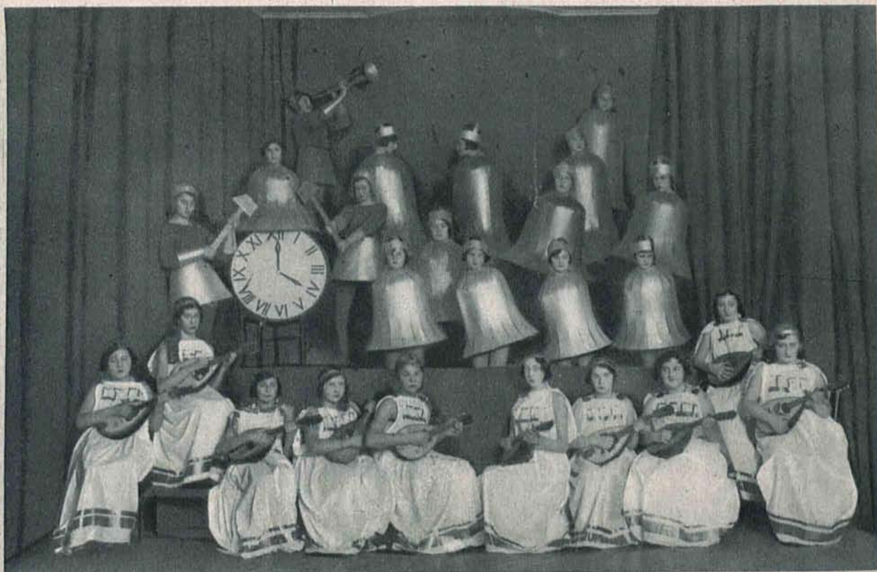
„Muzyka dzwonów krakowskich“ z „Akropolis“ Stanisława Wyspiańskiego inscenizowana przez uczennice Gimnazjum im. Elży Orzeszkowej w Łodzi na obchodzie szkolnym ku czci wielkiego poety.

Poniżej: Fragment z „Legendy“ St. Wyspiańskiego odegrały uczennice Gimnazjum im. Elży Orzeszkowej na obchodzie szkolnym. Przed sceną orkiestra szkolna.