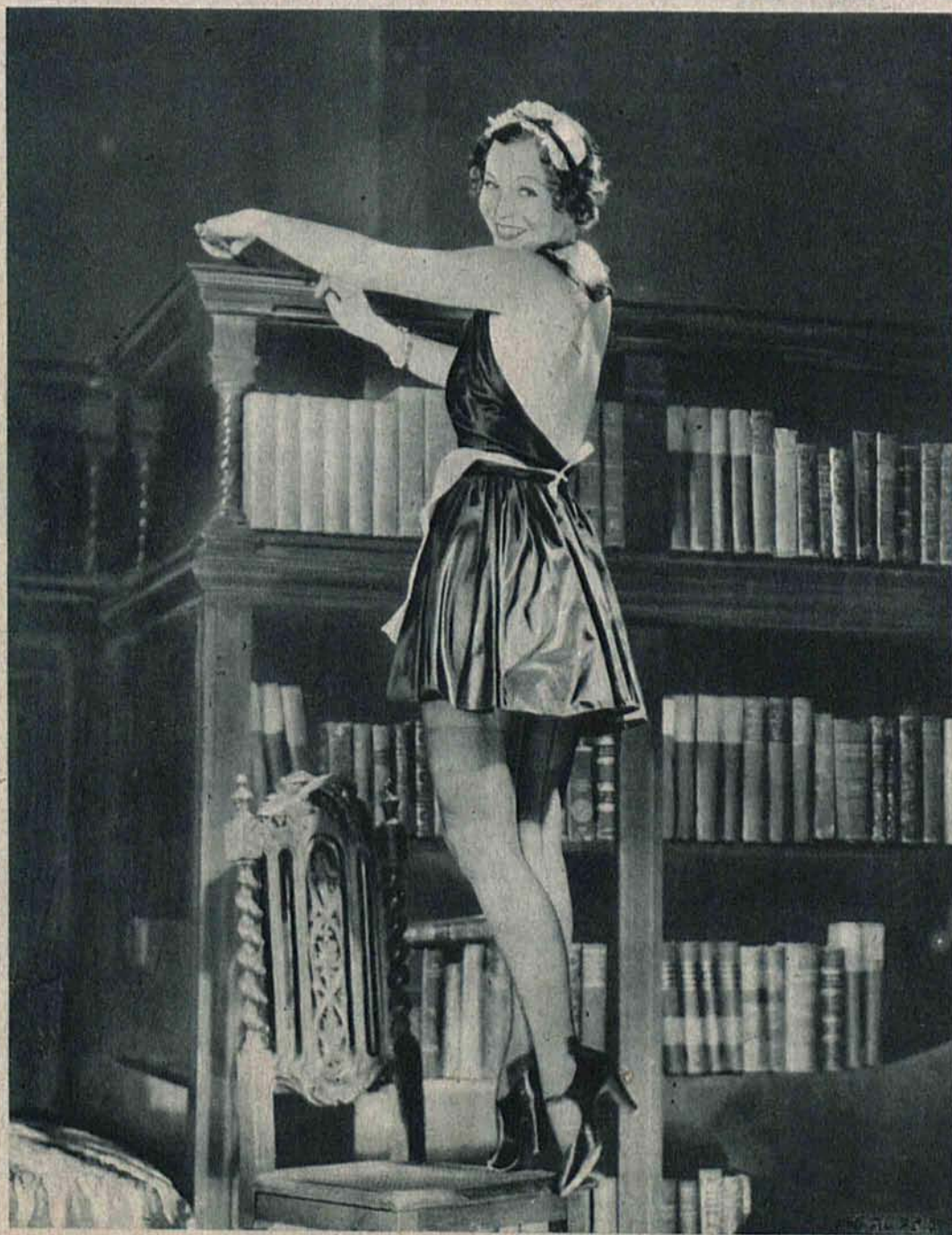
Śliczna Muriel Evans, gwiazda wytwórni „Metro“