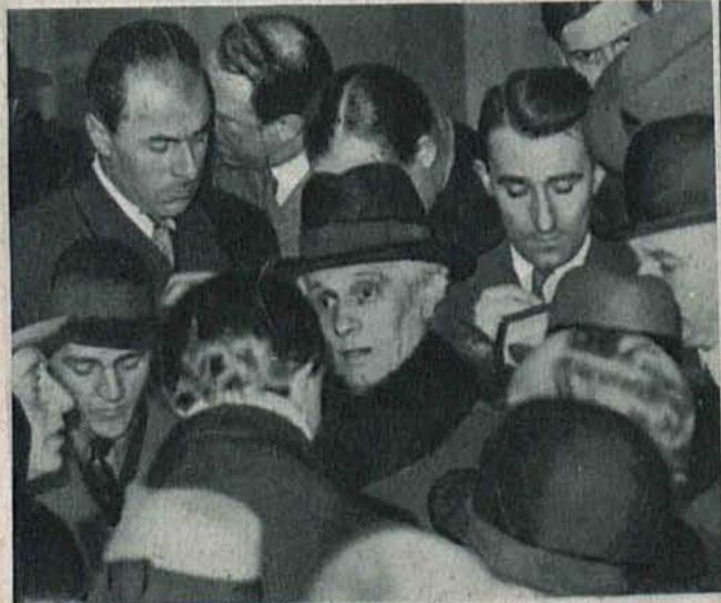
Francuski prezydent ministrów Paweł Boncour, obłożony przez dziennikarzy przy wyjściu z pałacu Elizejskiego.

Na prawo: Jedyne zdjęcie „Żywego Buddy“ Panchen Lama, który obrzydził sobie pustelnicze życie w Tybecie i zamieszkał w pałacu Tai Ho Tien w Pekinie.