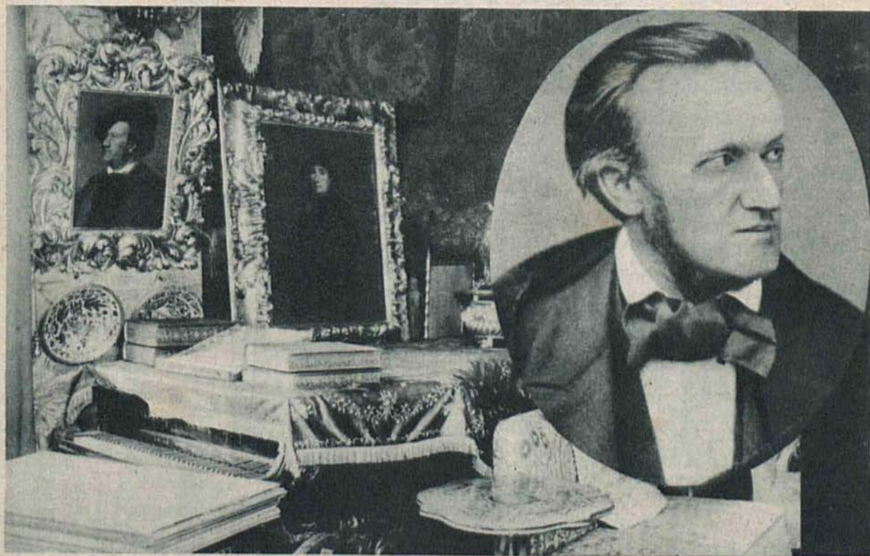
13-go lutego upływa 50 lat od śmierci sławnego kompozytora i poety niemieckiego Ryszarda Wagnera. Na zdjęciu pokój w którym tworzył, w owalu portret mistrza.