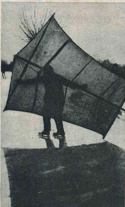
W ostatnich latach rozpowszechniła się jazda na lodzie z żaglem. Oto jeden z amatorów tego sportu podczas treningu.