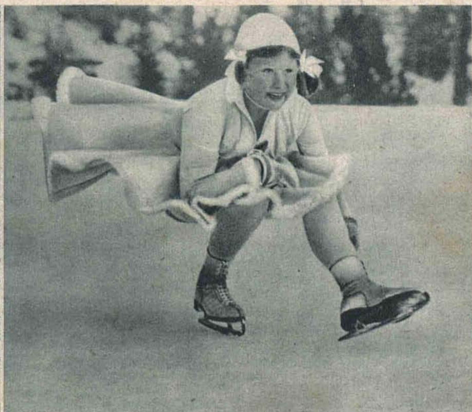
12-letnia Angielka Cecilia Colledge zdobyła w sztucznej jeździe na lodzie drugie miejsce po Sonji Henie.