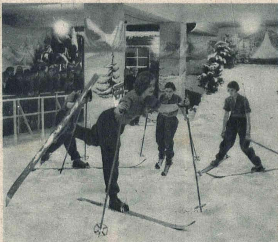
Jeden z wielkich magazynów berlińskich urządził w swoim budynku sztuczne tereny narciarskie, posypane sztucznym śniegiem z dekoracjami dającymi złudzenie, że ćwiczący znajdują się między prawdziwymi górami i lasami.