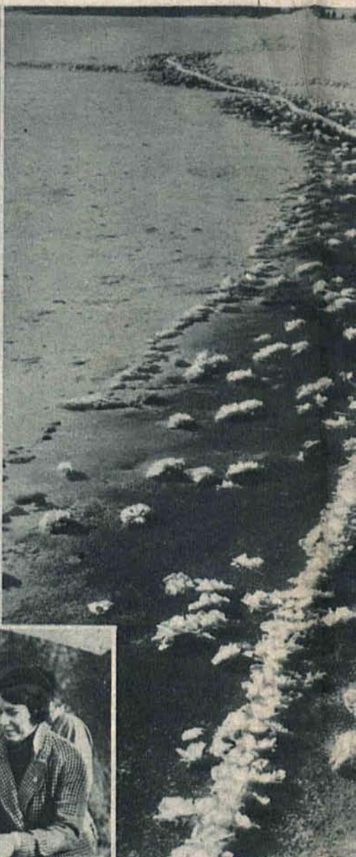
Na zamarzającej powierzchni zaryła się wstęga przepięknych i śniegu.