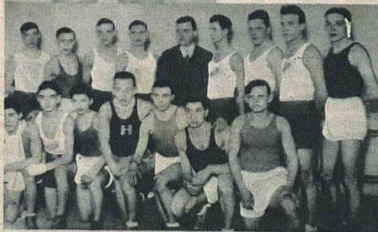
Grupa bokserów, która dostała się do finału I-go Kroku Bokserkiego.