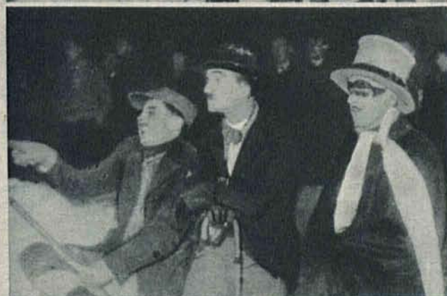
Dwa zdjęcia: Pierwszy w Łodzi bal maskowy na lodzie pod gołym niebem.