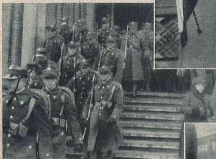
Wojsko opuszcza katedrę Św. Stanisława Kostki po uroczystym nabożeństwie.