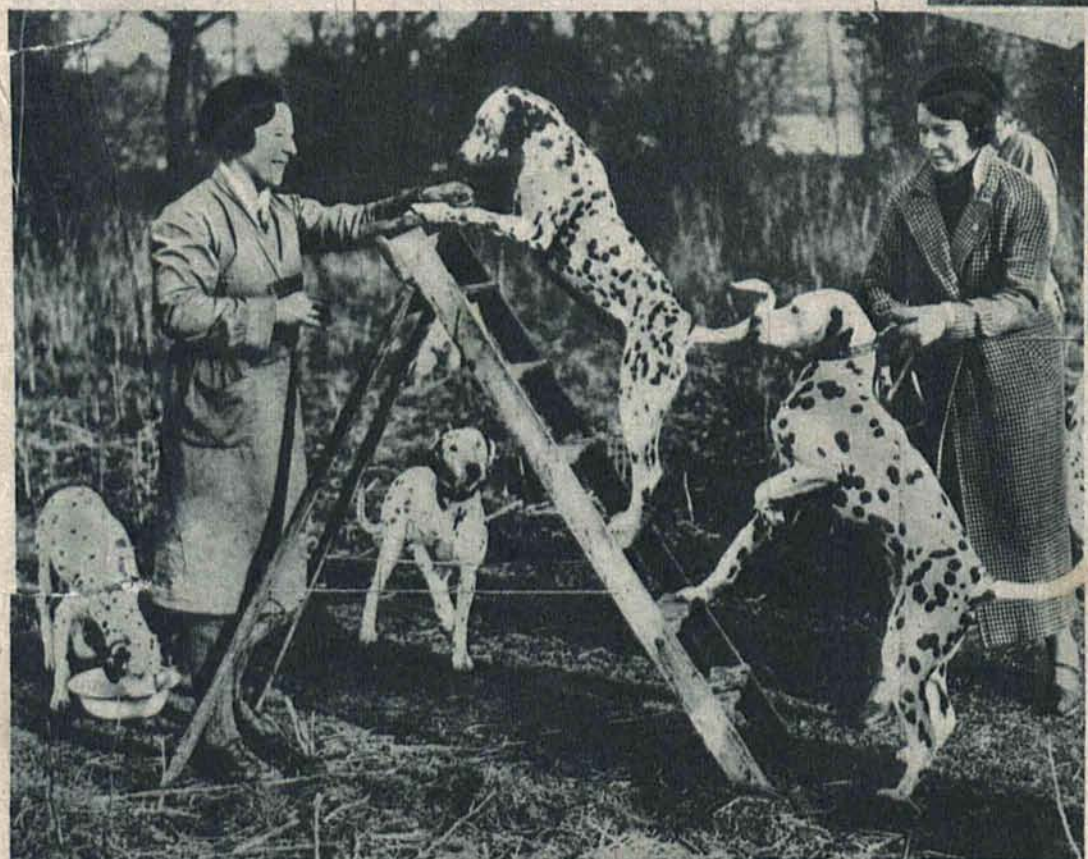
Na lewo: Pani Egge znana psów, tresuje trupe rasowych psów dla jednej z londyńskich rewij