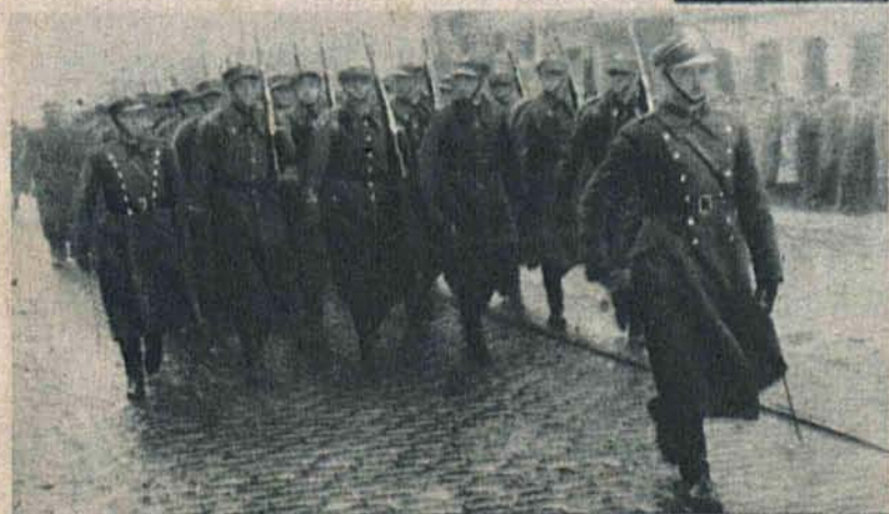
Na lewo: Przemarsz defilujących wojsk.