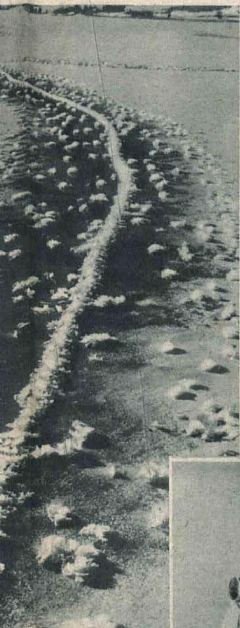
powierzchni jeziora utwo- rzonych kwiatów z lodu