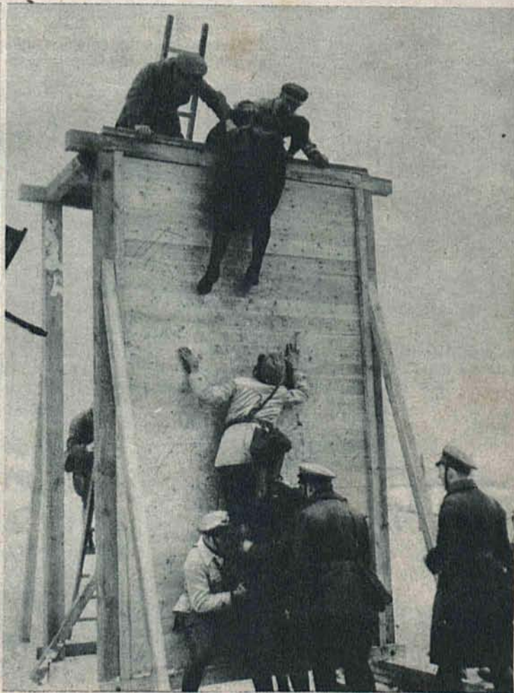
Na prawo: Ćwiczenia wojskowe bojówki lewicowej w Niemczech rozbrojonych.