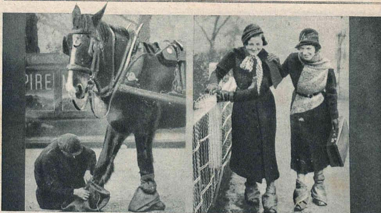
Wskutek mrozu który nastąpił po okresie gęstej mgły, na ulicach Londynu powstała gołoledź. Zanim zdołano usunąć skorupę lodową, ludzie i zwierzęta zmuszeni do najdalej idącej ostrożności owijali nogi szmatami.