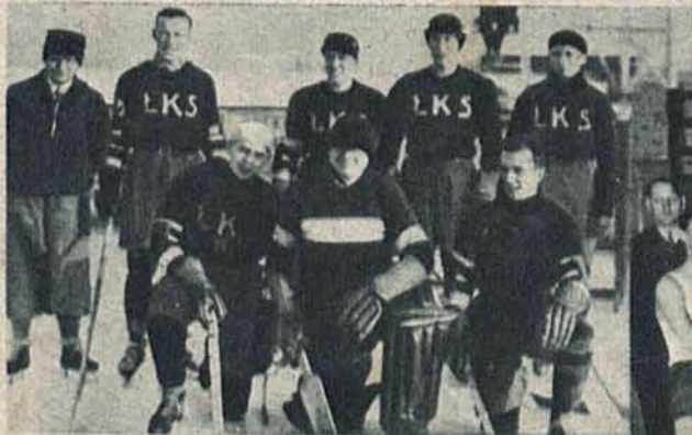
Zespół hokejowy LKS-u brał z powodzeniem oraz pierwszy udział w mistrzostwach hokejowych Polski w Krynicy.