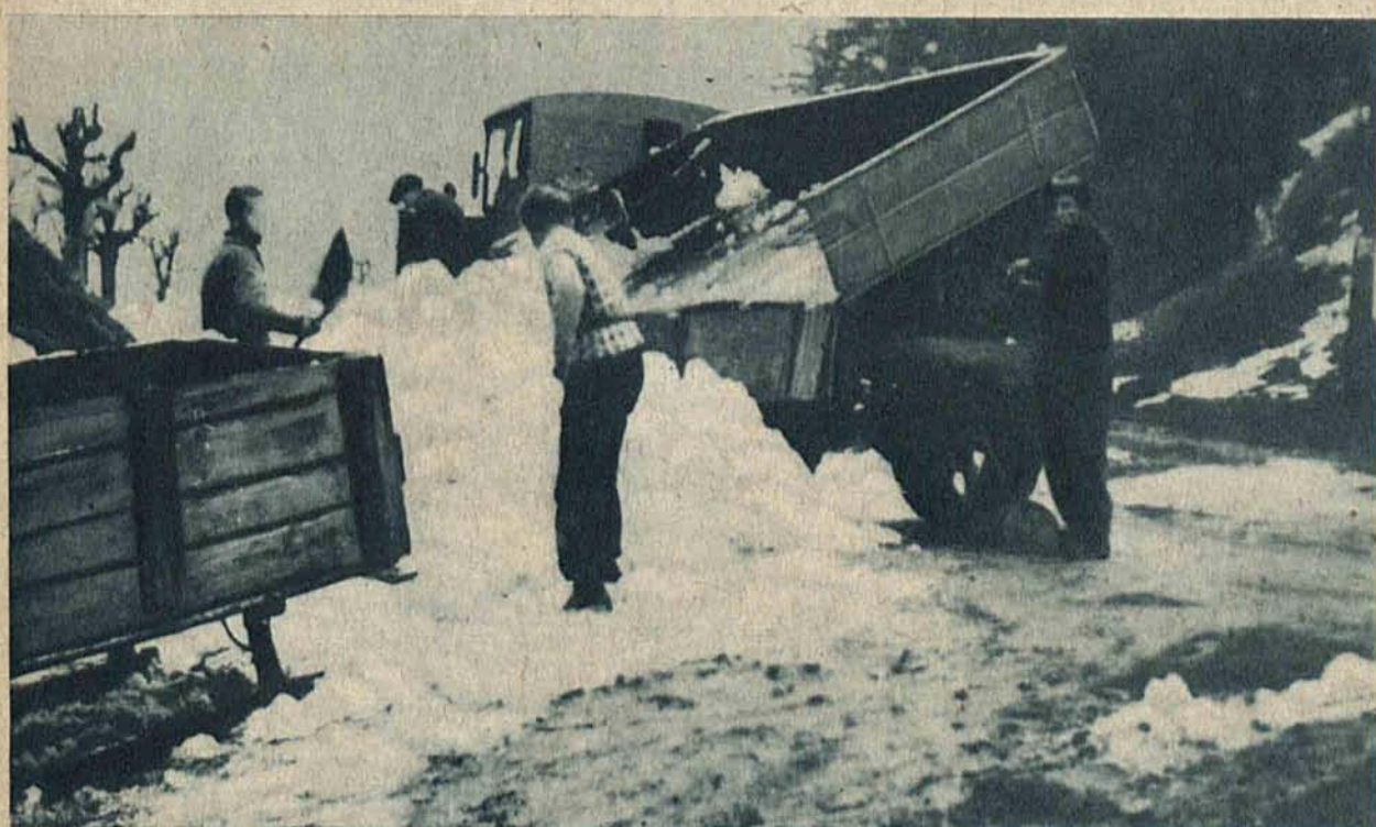
Wskutek odwilży zabrakło śniegu na międzynarodowych zawodach w Innsbrucku. Wobec tego na skocznię i trasę biegów zwożono śnieg z okolicy.