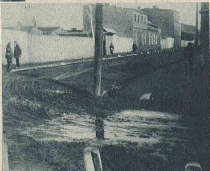
Pińskie błota w Chojnach.

Na lewo: Mimo kryzysu i bezrobocia nie brak jeszcze naiwnych, którzy wydają ostatnie grosze na zwiedzenie lokalu, w którym ujrzeć można „ludzką głowę na talerzu”.