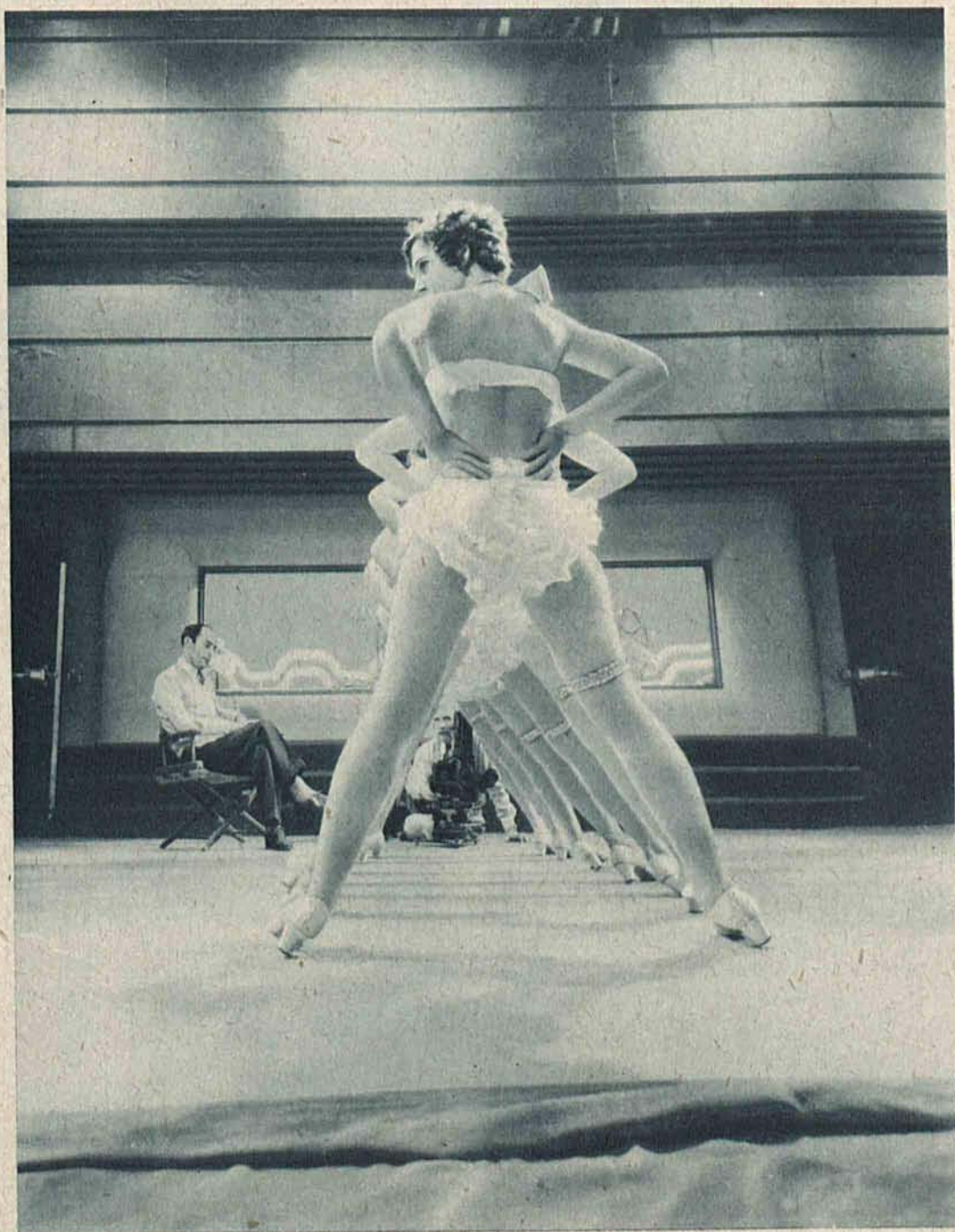
Scena z rewji filmowej, montowanej przez wytwórníę „Metro-Goldwyn“.