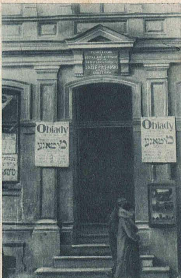
Dom przy ulicy Piłsudskiego i Pomorskiej, w którym został aresztowany Marszałek Piłsudski w roku 1905.

Na lewo: Rosnąca stale konkurencja w branży czekoladowej zmusza fabrykantów do wysyłania swoich przedstawicieli na ulicę, gdzie sprzedaż czekolady odbywa się nawet... w aucie.