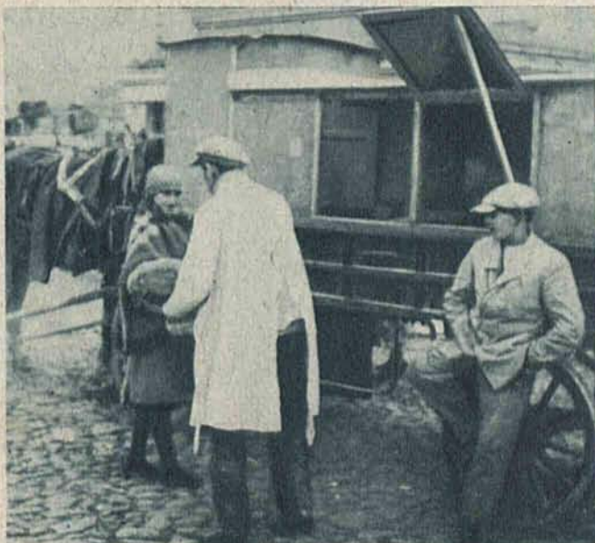
Wędrowni piekarze znajdują klientelę we wszystkich punktach miasta.