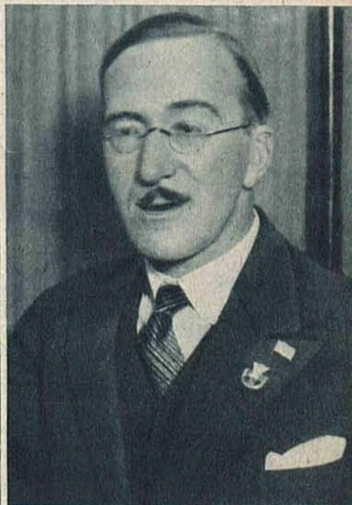
Szwed Soederlund — prezes FIBU został w czasie pobytu w Polsce nieprawnie odznaczony Państwową Odznaką Sportową. Na zdjęciu widoczne jest, odznaka POS w klapie p. Soederlunda.