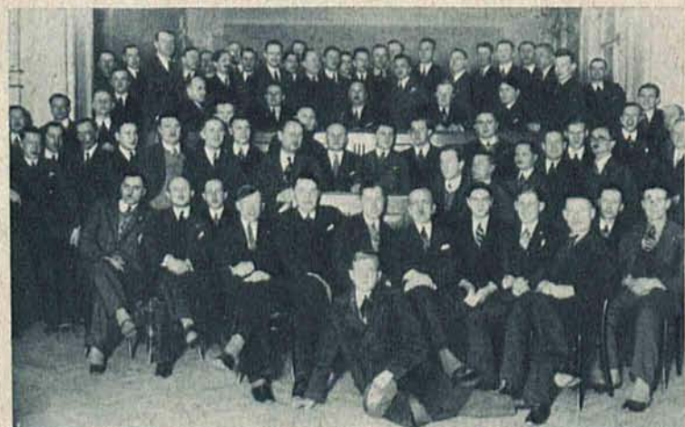
W sali Rady Miejskiej odbyło się walne zebranie Łódzkiego Klubu Sportowego. W obradach brali również udział piłkarze ligowego zespołu, co uwidocznione jest na zdjęciu.