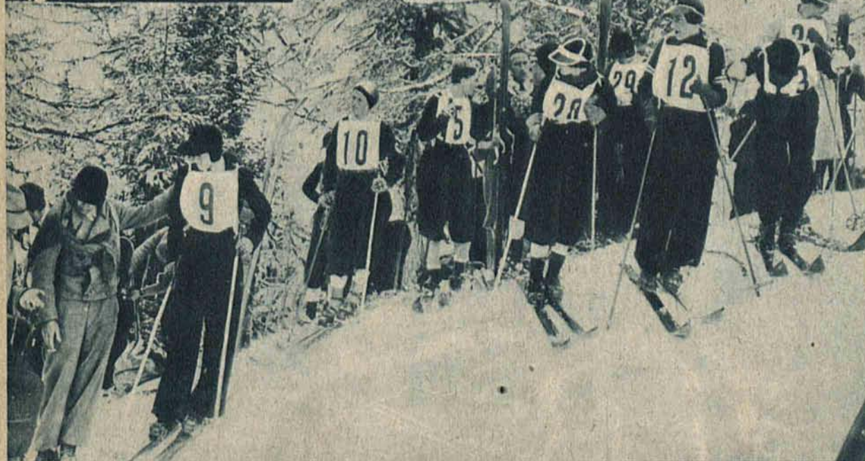
Panie startują do biegu w Innsbrucku, mimo niesprzyjających warunków śnieżnych.