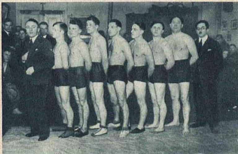
Sekcja ciężkoatletyczna Sokola Łódzkiego brała z powodzeniem udział w mistrzostwach zapaśniczych okręgu.