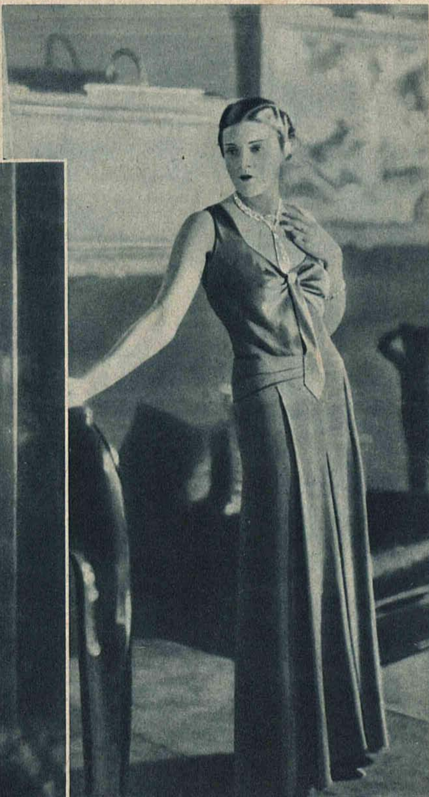
Najnowsza kreacja Patou. Suknia wieczorowa z czerwonego matocain uzupełniona oryginalnym naszyjnikiem i bransoletą.