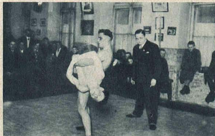
Fragment z zawodów zapaśniczych o mistrzostwo okręgu łódzkiego.