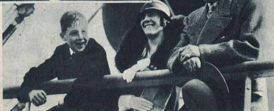
Na prawo: Sir Malcolm Campbell, który osiągnął rekord automobilowy 440 km. na godzinę powrócił do Anglii wraz z żoną i synkiem, na pokładzie okrętu „Aquitania”.