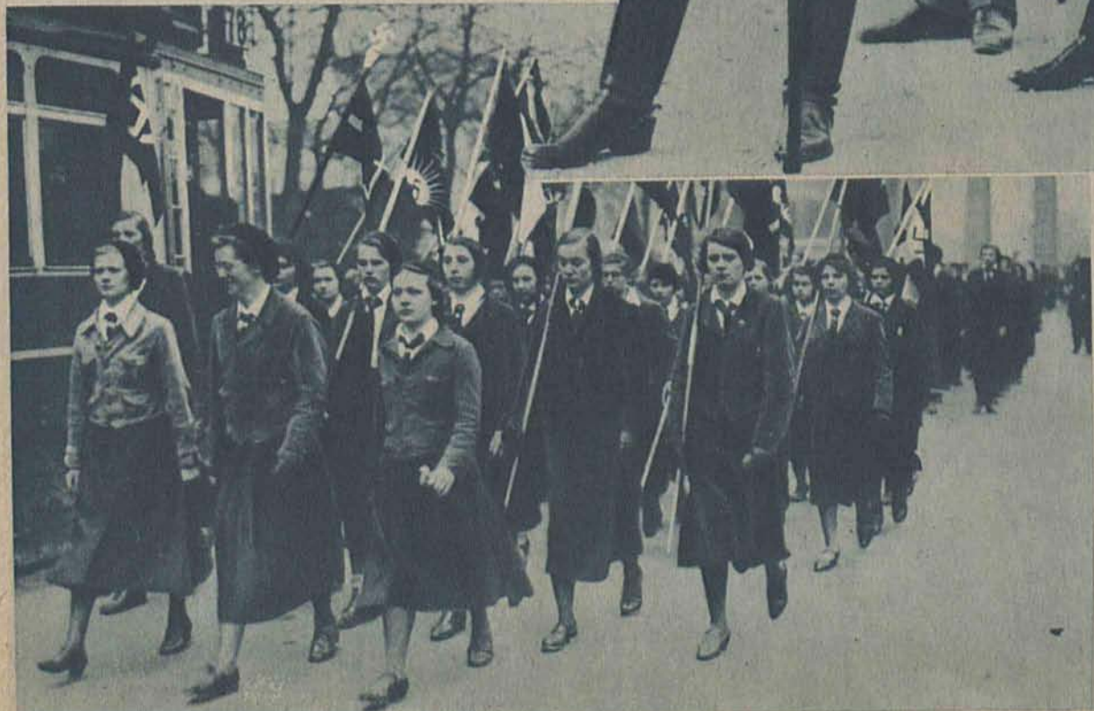
Fragment z pochodu demonstracyjnego młodzieży hitlerowskiej w Berlinie.