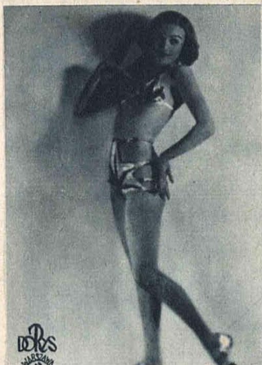
Ela Antoszówna znakomita tancerka akrobacyjna, gwiazda teatru „Morskie Oko” otrzymała propozycję z zagranicy do jednej z większych wytwórni filmowych.