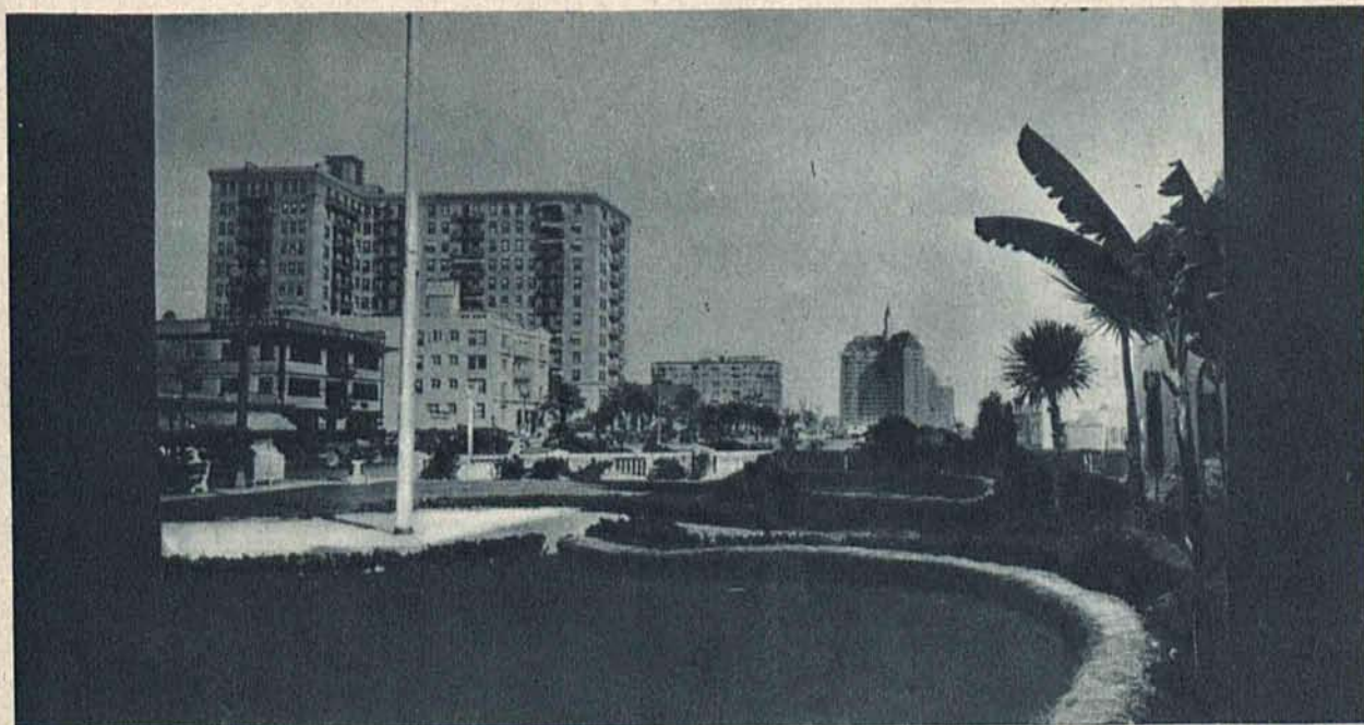
Long Beach w Kalifornii „raj na ziemi“, ulubione miejsce wycieczek i pobytu bogaczy amerykańskich zostało podczas trzęsienia ziemi zupełnie zniszczone.