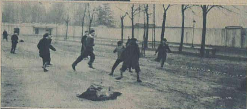
Na prawo: Pierwszy mecz sezonu wiosennego w Alei Anształta.