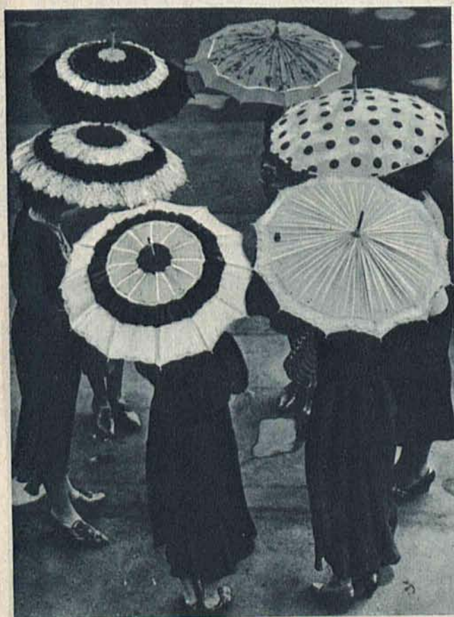
Najnowsze modele parasolek, które lansują na nadchodzące lato angielscy twórcy mody w porozumieniu z fabrykantami parasoli.