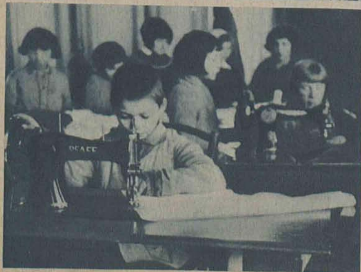
Na lewo: Z życia domu sierot: nauki zawodowe od 9 roku życia.