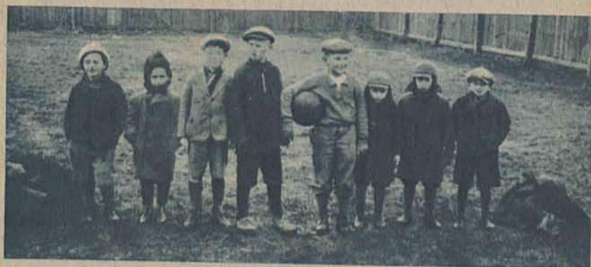
Przyszli „mistrze” rozpoczynają sezon piłki nożnej.