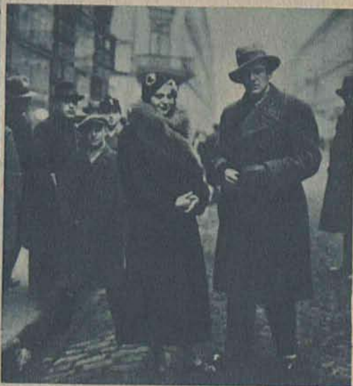
Polskie gwiazdy filmowe w Łodzi — Marja Bogda i Adam Brodzisz.