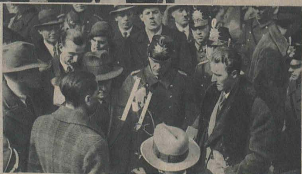
Na prawo: Reportaż radjowy z ulicy w czasie „racji” w Berlinie.