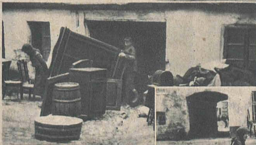
To nie eksmisja, lecz „porządki” przedświąteczne.