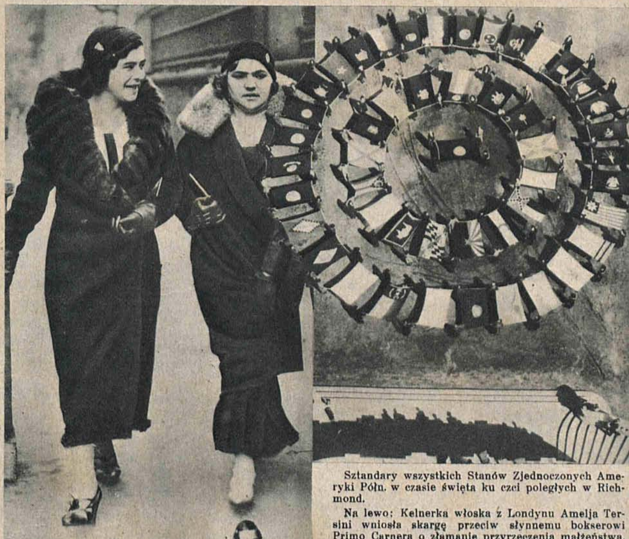
Sztandary wszystkich Stanów Zjednoczonych Ameryki Półn. w czasie święta ku czeli poległych w Richmond.