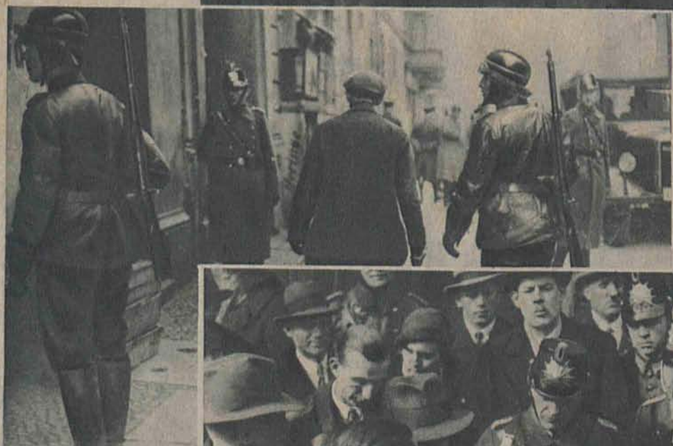
Obrazek z „racji” policyjnej w Berlinie.