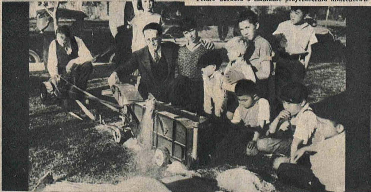
Minjaturowa młockarnia popędzana przez prawdziwą małą lokomotywę, skonstruowana przez pewnego farmera w Kalifornji.