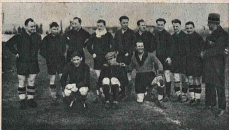
Zespół ligowy Legii warszawskiej pokonany został w Łodzi w stosunku 2:1.

Na prawo: Puchar ofiarowany przez radę miejską m. Brna na zawody bokserskie Łódź—Brno.