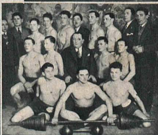
Sekcja ciężkoatletyczna Sokoła łódzkiego.