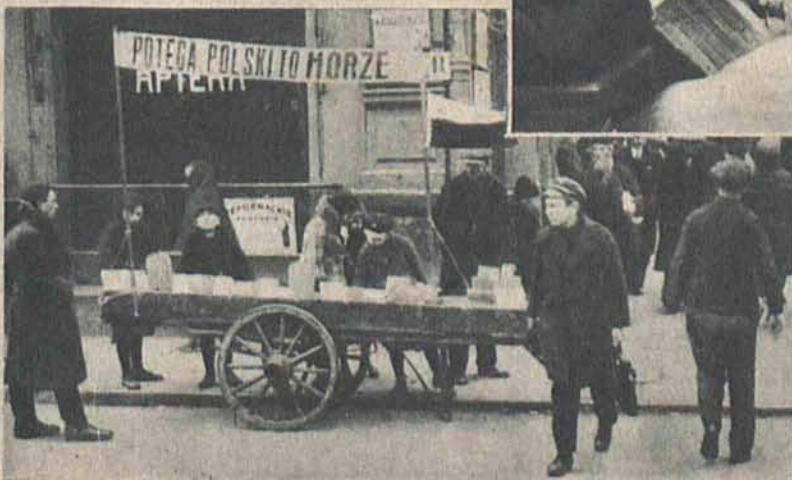
Na lewo: Uliczna sprzedaż książek w połączeniu z propagandą morza.