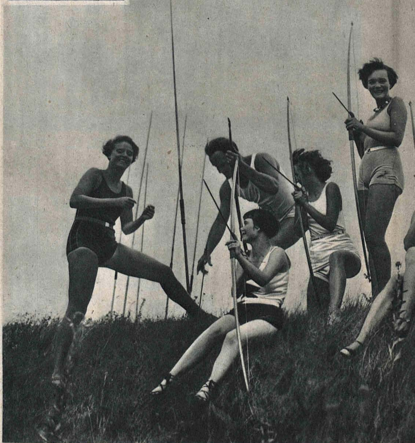
Nowoczesne D Uczennice instytutu wychowania fizycznego przy