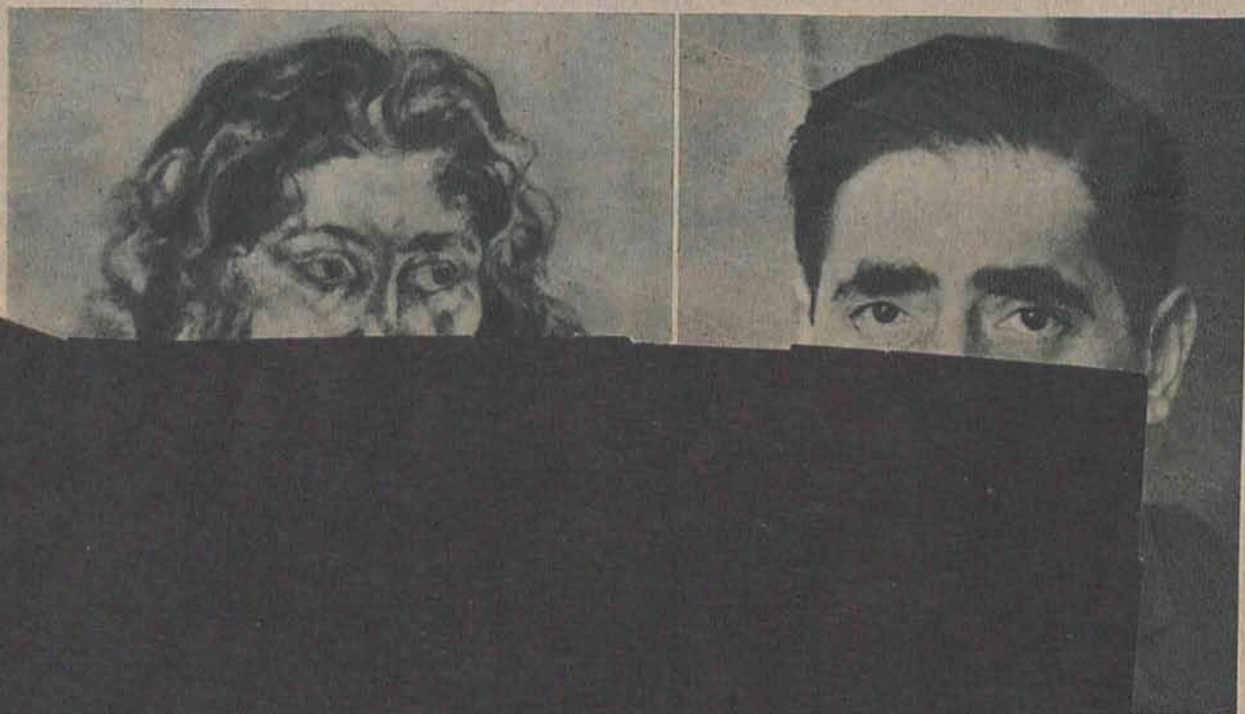
sen, zostal ego P. H.