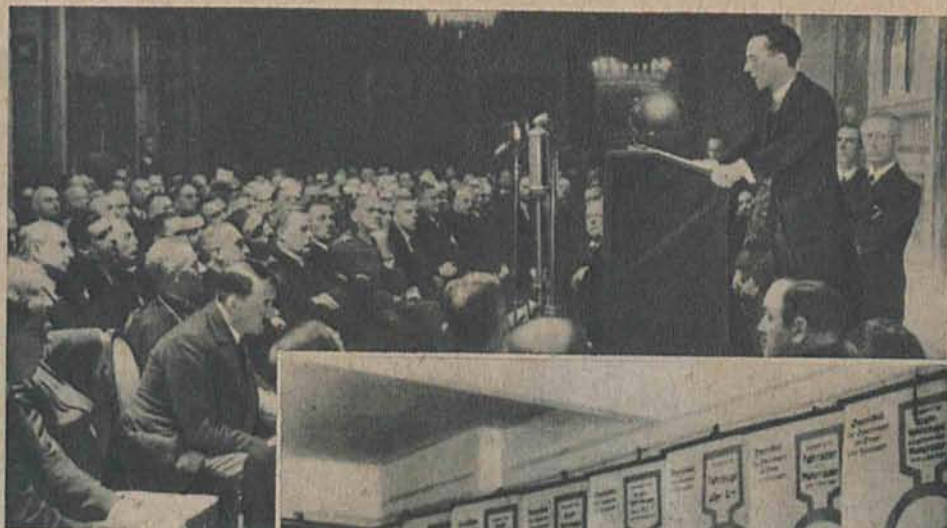
Hitler na konferencji prasowej w min. spraw zagr. (siedzi pochylny). Przemawia min. Goebbels.