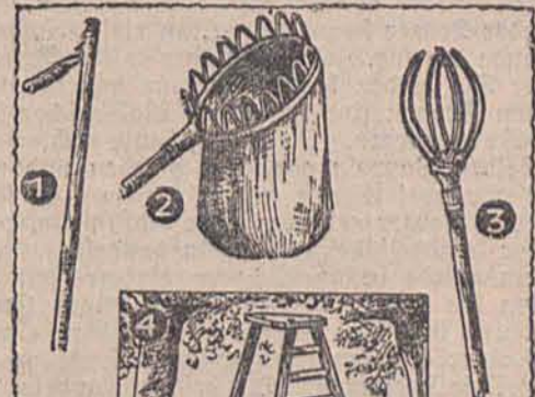
Nach Angaben des Verfassers gezeichnet von Kaiser (R.). Pfliäckergeräte.

2. Der Obstpfliäcker ist ein unentbehrliches Gerät, um hochhängende, besonders schöne Äepfel und Birnen ohne Beschädigung herunterholen zu können. Es gibt zwei Arten von Obstpfliäckern: einmal solche, die mit einem Sackchen zum Herabfallen der Früchte versehen sind und in welche man gleich eine größere Anzahl von Früchten pfliäcken kann, und solche Obstpfliäcker, die mit einer Vorrichtung zum Festhalten der Frucht versehen sind und mit denen man jede Frucht gesondert herunterholen muß.