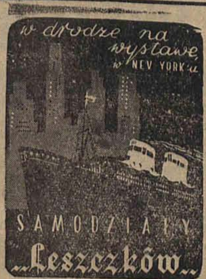
Lódź, Piotrkowska 56 tel. 122-02

GDYBY NIEPODLEGŁOŚĆ PAN- STWA POLSKIEGO ZOSTAŁA ZA- GRÓŻONA, — A JEŚLI BY TO NA- STĄPIŁO, NIE MAM ŻADNEJ WĄTPLIWOŚCI, ŻE NARÓD POL-