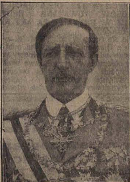
Król Ahmed Zogu osiedlił się ma w Turcji.

Jerozolima, 11 kwietnia. Policja morska w pobliżu Cezaryi zatrzymała okret „Asim”, na którego pokładzie znajdowało się około 200 nielegalnych imigrantów. Okret wraz z pasażerami internowano w Haifie.