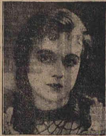
Po użyciu kremu Eukutol