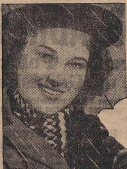
Krem Palmolive „Przyjaciel Skóry” na oleju oliwkowym i lecithinie, jest siostrzanym produktem mydła Palmolive.