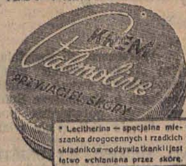
* Lecithina — specjalna mieszanka drogocennych i rzadkich składników — odżywia tkanki i jest łatwo wchłaniana przez skórę.

DO NABYCIA WSZĘDZIE W PUDEŁKACH W 4 DOGODNYCH WIELKOŚCIACH