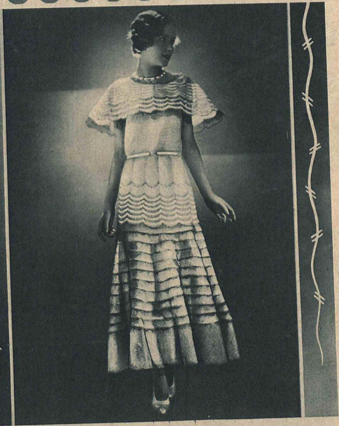
Śliczna sukieneczka dla dorastającej panienki z białej organdy z naszytymi falbankami z czarną koronką.