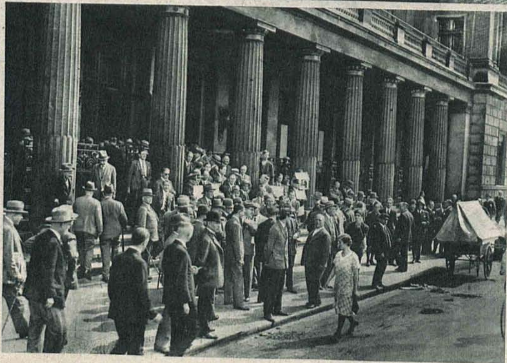
Żywy interes w dniu... cja zam... od kilku... sięcy g... berliński