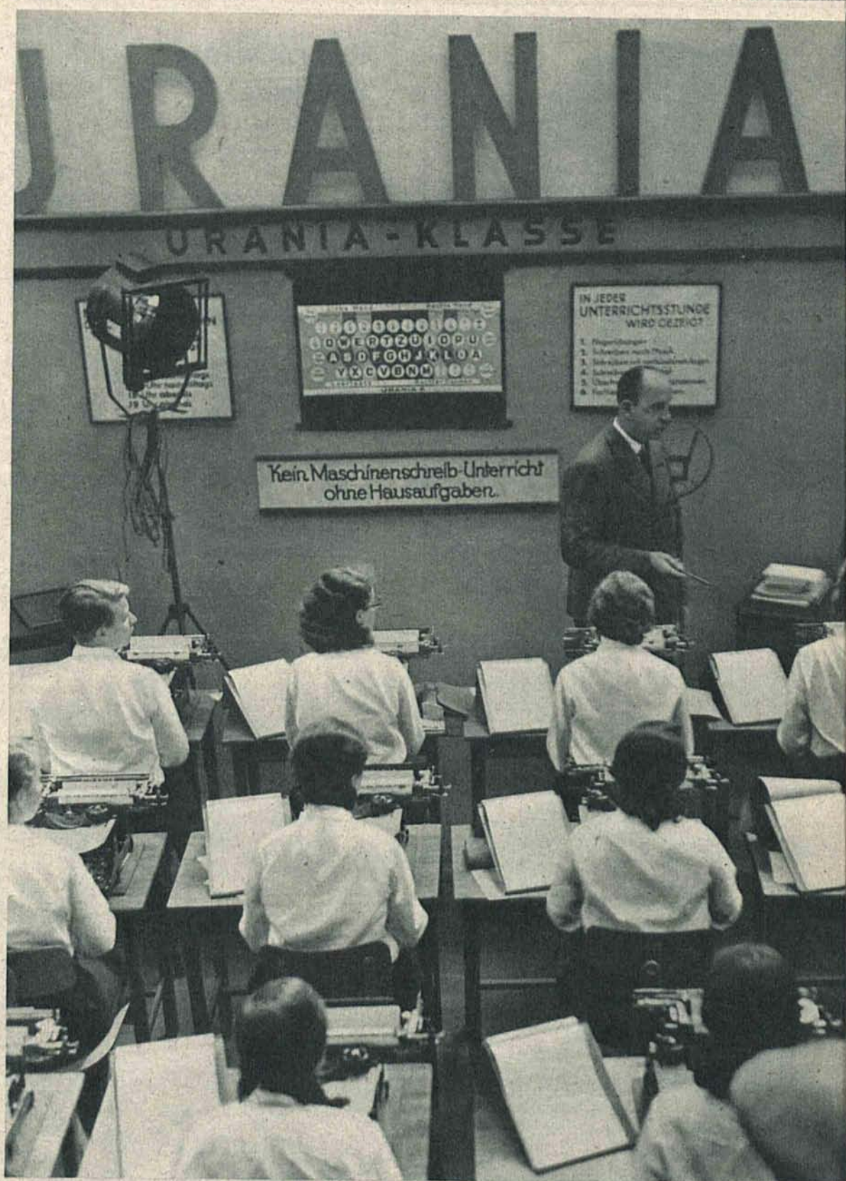
Nowoczesna klasa pisania na maszynie na Międzynarodowej Wystawie Biurowej w Berlinie. Uczennice już bez patrzenia na klawiaturę w rytmie muzyki gramofonowej.

Wydawca: Wydawnictwo „Republika” Sp. z ogr. odp. Łódź, Piotrkowska 49 — Redaktor: Wacław Smólski Drukarnia Narodowa w Krakowie, Wolska 19