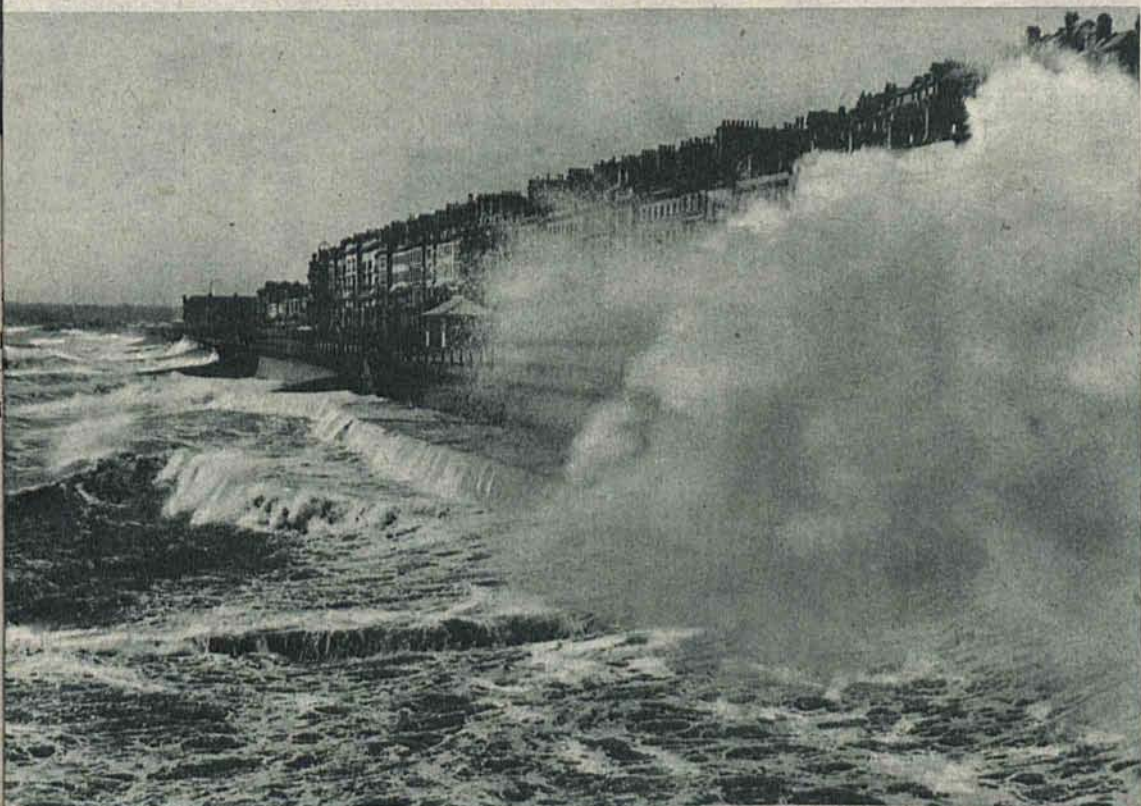
Wielka fala oceanu o mało nie rozbija swoich fal o kamienice stojące na półwyspie St. Leonhards na południowym wybrzeżu Anglii.

Wszędzie do nabycia, gdzie niema, wprost: APTEKARZ DRANCZ I SKA., BIELSKO. WYRÓB KRAJOWY