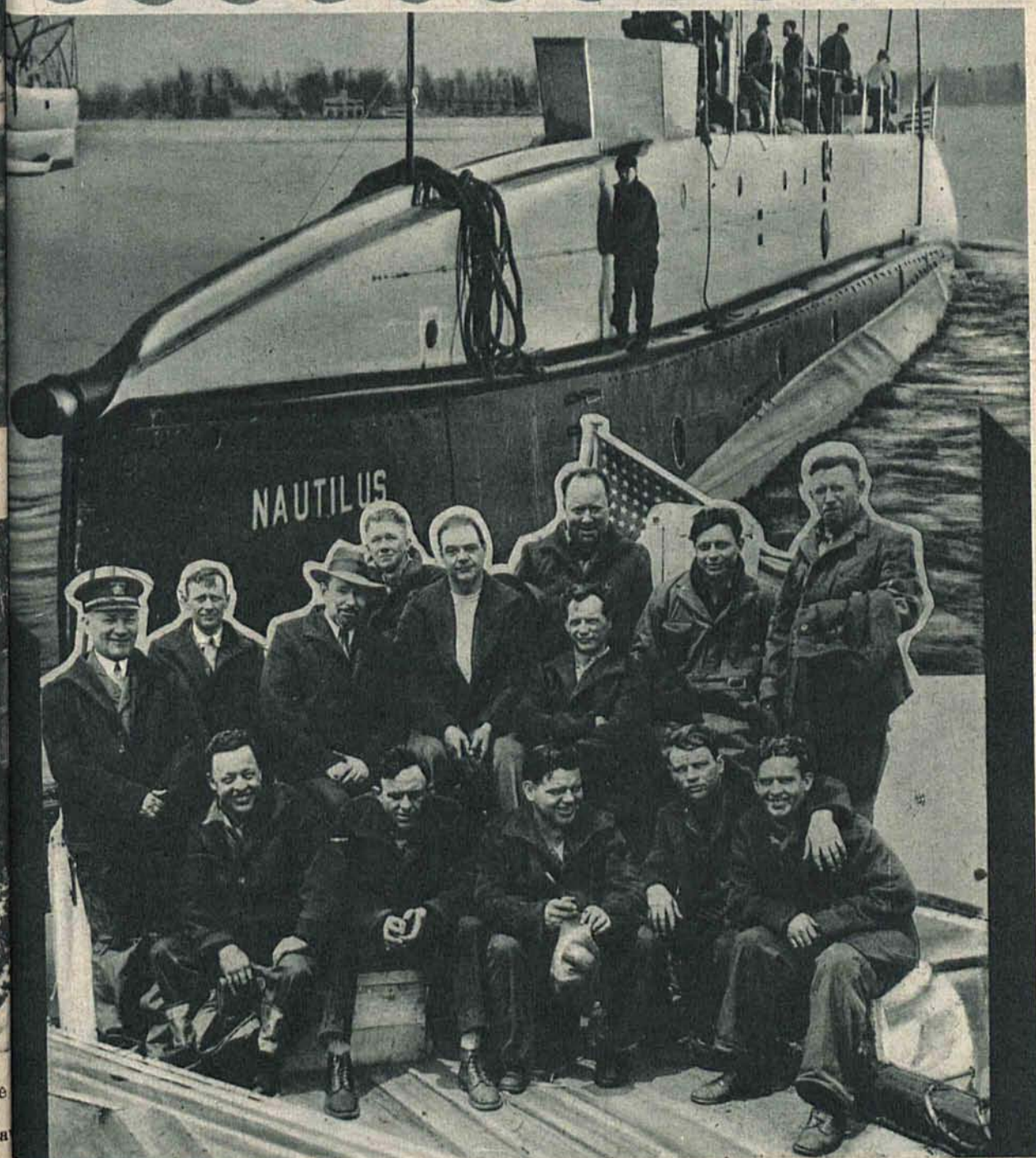
Nautilus i jego załoga z Hubertem Wilkinsem (w kapeluszu), których uważa się już za straconych w wyprawie odbiegunowej.