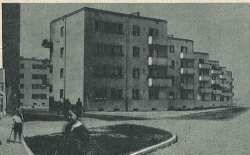
Ulica prowadząca do nowego miasta.

Na lewo: Dzieci mieszkające tam, czują się doskonale zdala od gwaru i kurzu Łodzi.