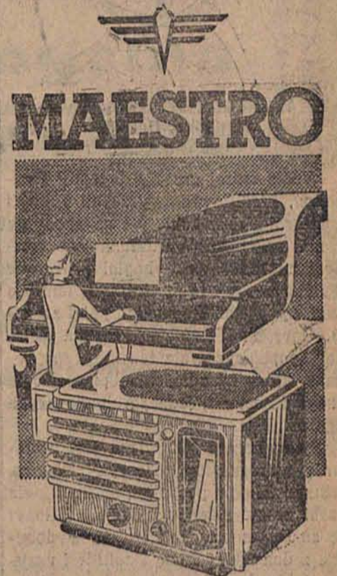
5 lampowa klasyczna superheterodyna. 7 obwodów. Zmienna selektywność. Telefoniczna tarcza strojenia. Kompensacja basów. Oko magiczne.