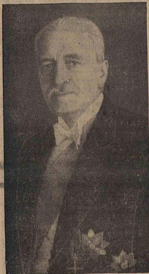
PREZYDENT IGNACY MOŚCICKI

Cały kraj obchodzi dziś uroczyste 19-letnie rocznicę odzyskania Niepodległości W Warszawie, Krakowie i Wilnie złożono hołd Wskreszycielowi Państwa — Marsz. Piłsudskiemu