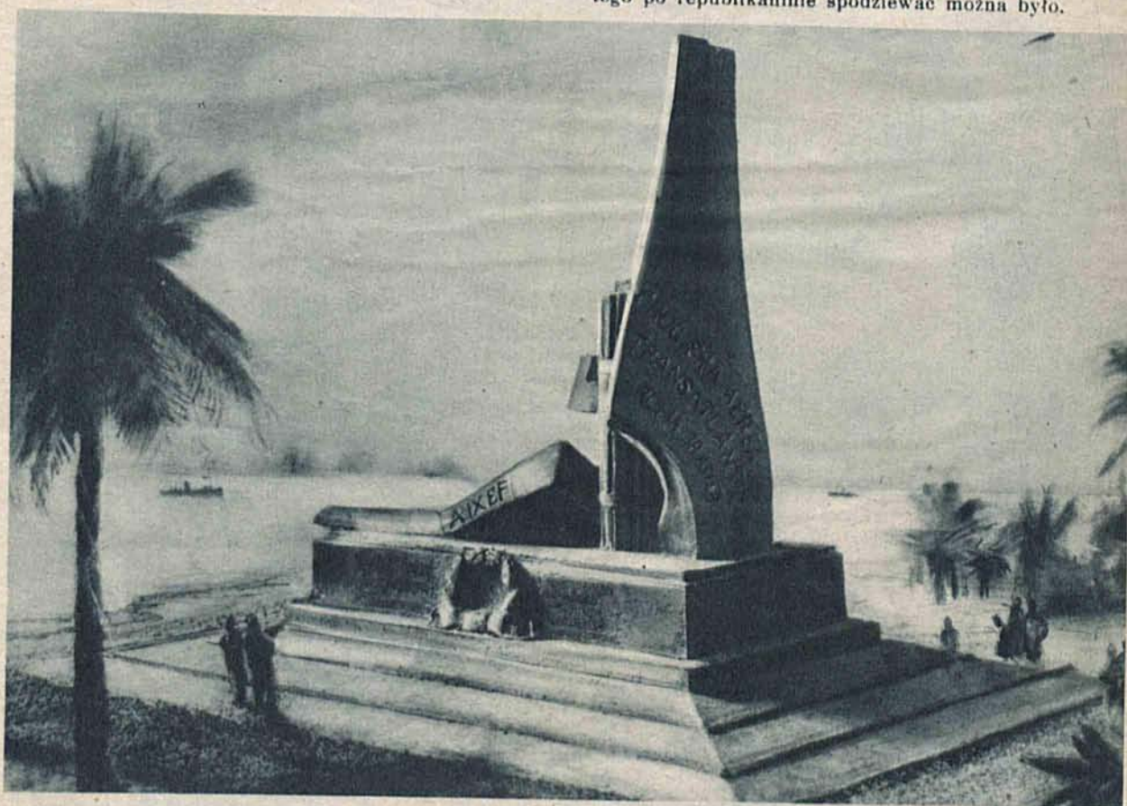
Model pomnika dla poległych bohaterów przestworzy zmarłych tragicznie w wyprawie włoskich hydroplanów do Brazylii, wystawiony będzie u wschodnich wybrzeży Afryki.