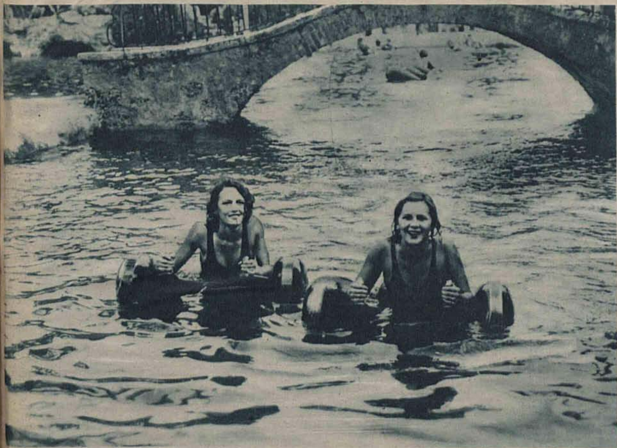
Nie wszędzie Boże Narodzenie po lodzie. Dwie syreny uprawiające sport na wodnych rowerach w Kalifornji.