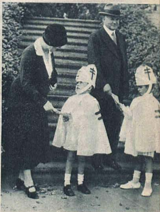
Na prawo: Dzieci jednego z towarzystw charytatywnych w Ameryce sprzedają marki prezydentowi Hooverowi na cele akcji przeciwgruźliczej.