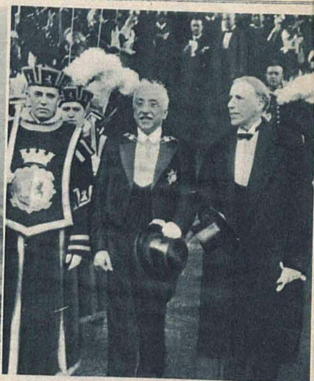
Pierwszy prezydent Republiki Hiszpańskiej Zamora wcale nie wyrzekł się pompy arystokratycznej jak się tego po republikaństwie spodziewać można było.