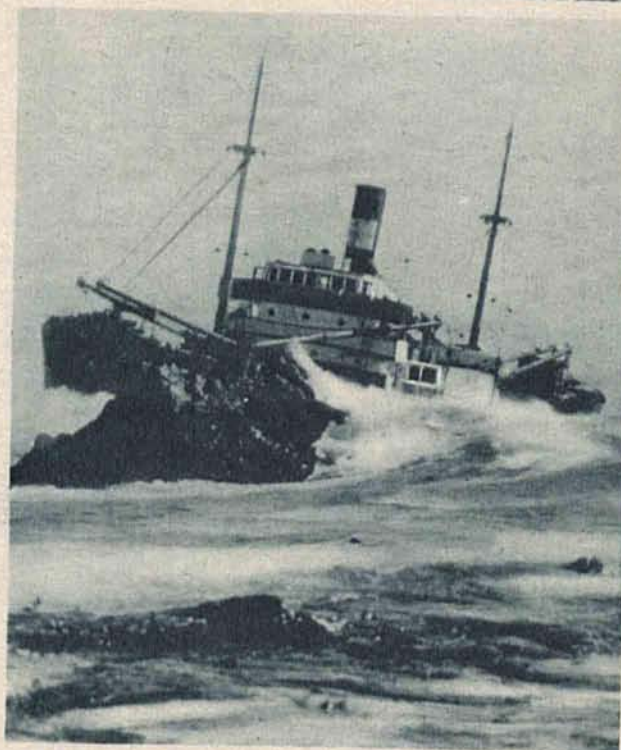
Angielski okręt Munleon najechał w gęstej mgle na skały koło wysp Kalifornijskich. Załogę uratowano.