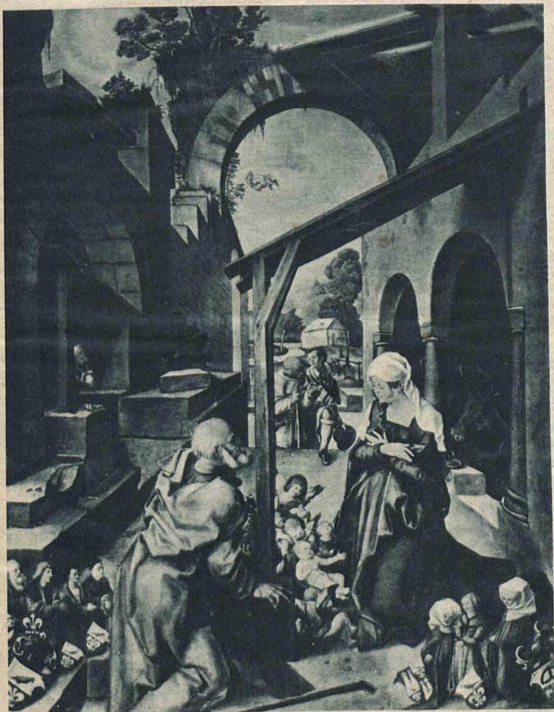
Narodzenie Chrystusa Pana według obrazu Albrechta Dürera.