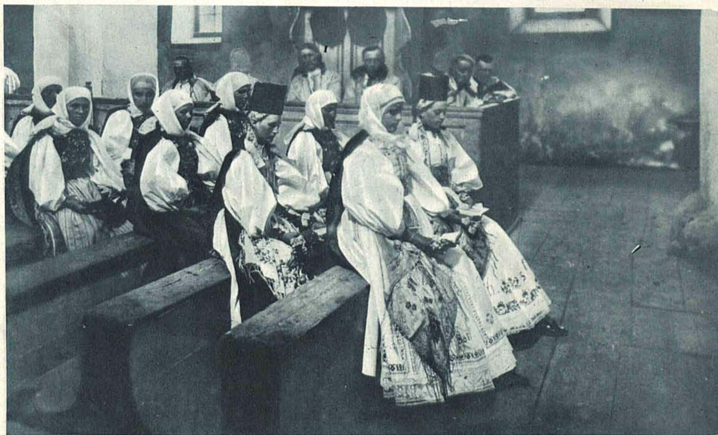
Malownicza grupa wieśniaczek siedmiogrodzkich w strojach narodowych.