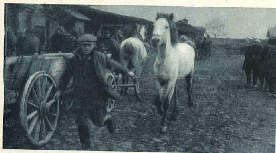
Na lewo: Targ „koński“ na ul. Wołowej.