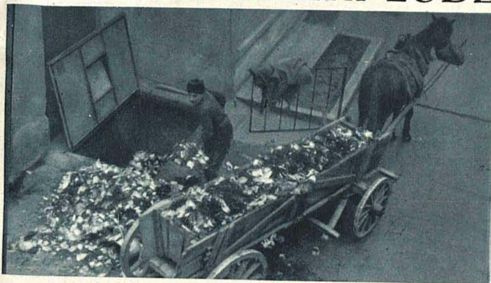
Obraz typowo łódzki: wywożenie śmieci z podwórka.