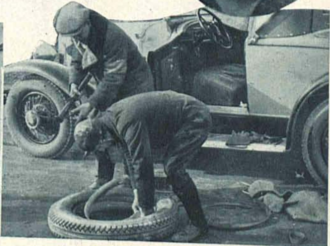
„Buick” z „nawaloną kichą”.