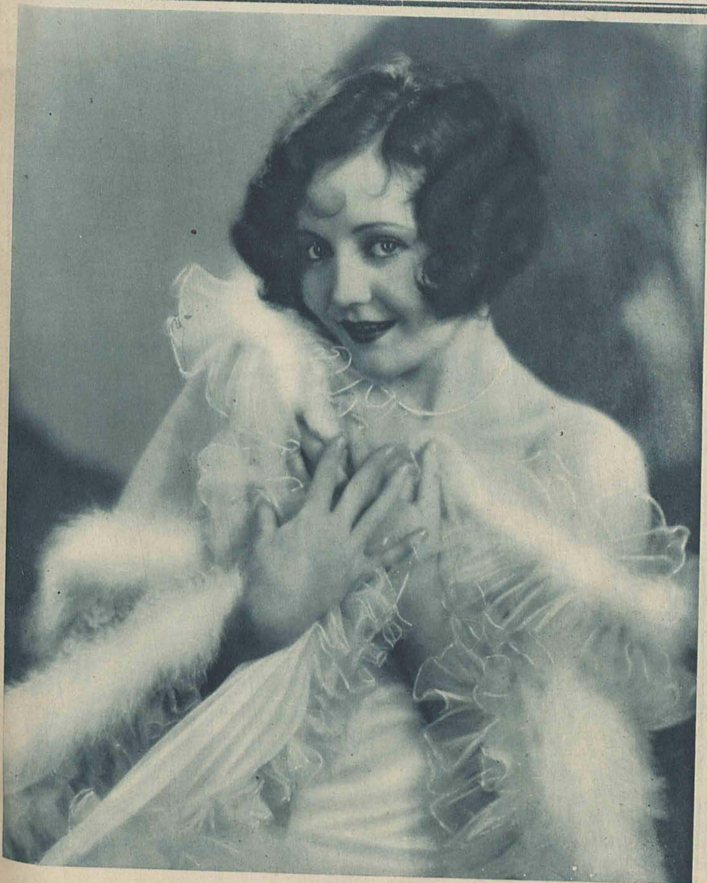
NANCY CARROL popularna gwiazda filmowa „Paramountu”.

Dodatek niedzielny „Republiki” z dnia 2 marca 1930 r.