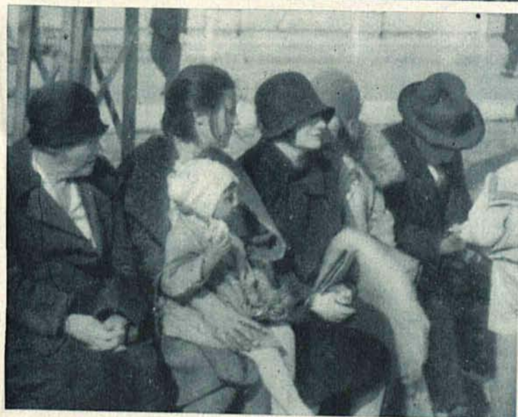
Wiosna w lutym... Na słońcu w Alejach Kościuszki.