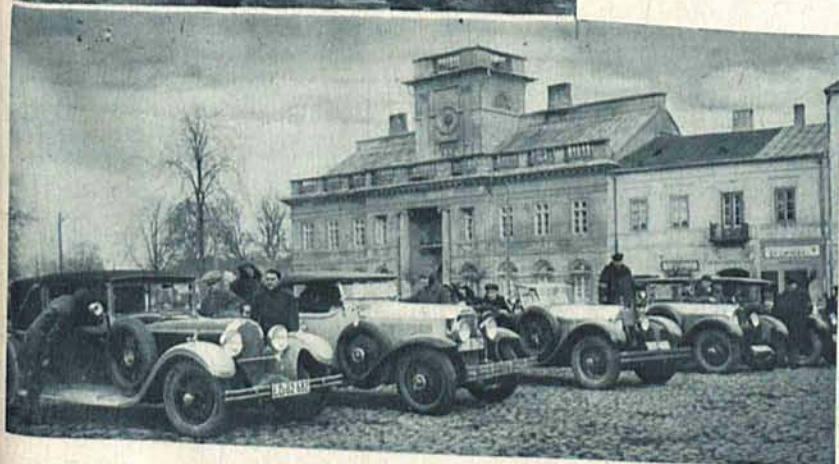
Zwycięskie wozy na śniadaniu w Łowiczu.