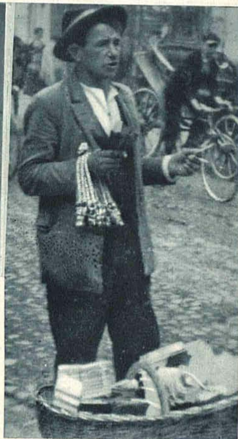
Handlarz uliczny. Zdjęcie dokonane na ul. Narutowicza.