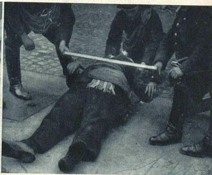
Straż ogniowa udziela pierwszej pomocy ratunkowej robotnikowi, który wpadł do studni.