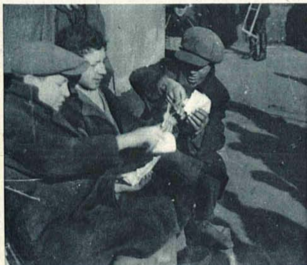
Gra w karty na Rynku Bałuckim.