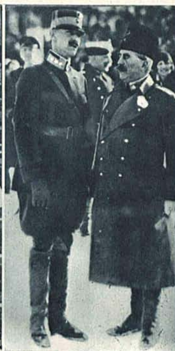
Król norweski Haakon przygląda się zawodom narciarskim w Oslo.

Na prawo: Scena z biegu na przelaj dla kobiet w okolicy Londynu.