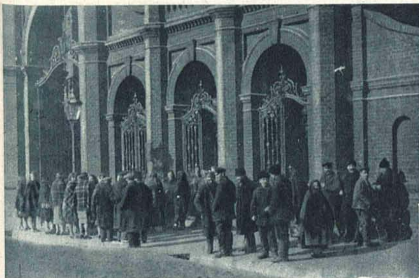
Robotnicy fabryki I. J. Poznański oczekują zmiany.