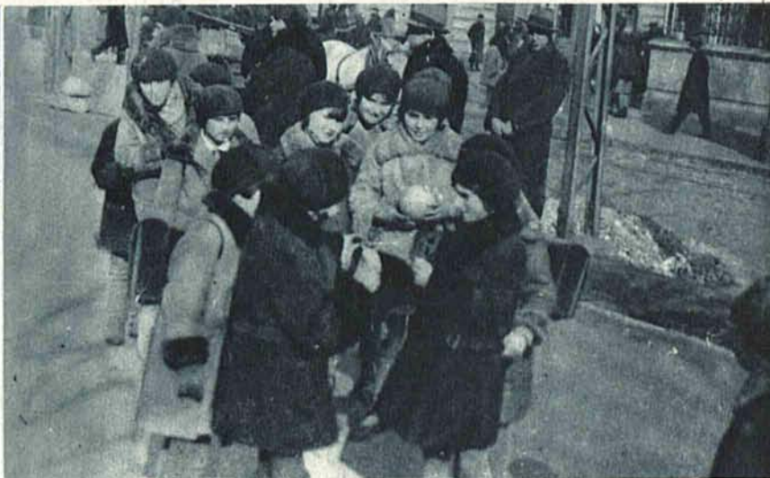
W słońcu na ul. Sienkiewicza przed parkiem.