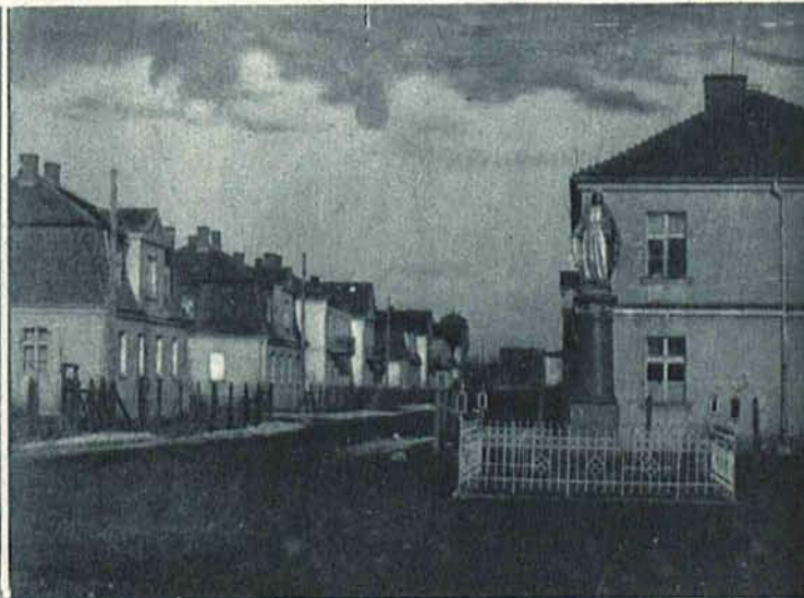
Kolonja urzędników skarbowych w Radogoszcu.