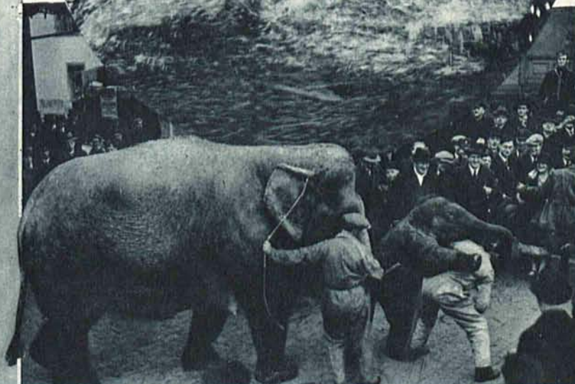
4 miesięczne słońtko cyrku Hagenbecka popisuje się przed publicznością jako zapaśnik.