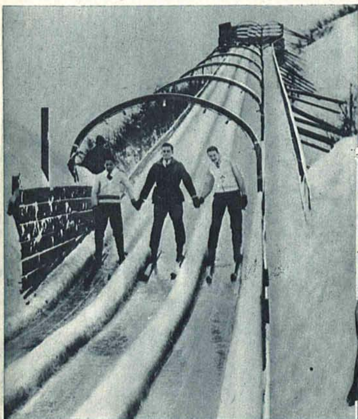
Jazda na nartach na lodowym torze toboganowym w Quebec (Kanada).