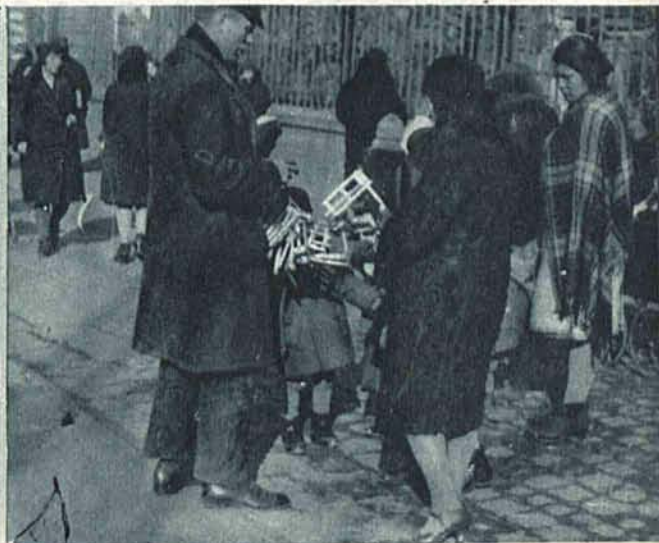
Uliczna sprzedaż zabawek.