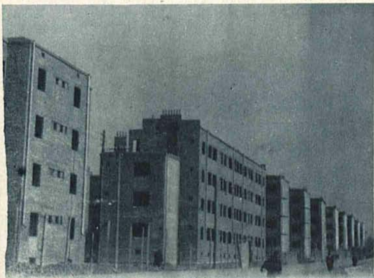
Nowowytbudowane domy na Polesiu Konstantynowskim.