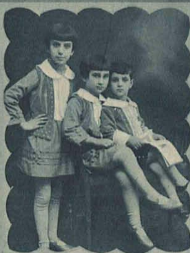
Anka, Lolka i Duduś Sochaczewscy