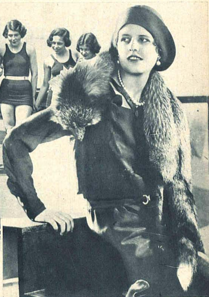
Na prawo: Elegancka suknia letnia z cieniutkiej wełny granatowej uzupełniona niebieskim lisem, jednak mniejszym niż w roku zeszłym i zgrabnym kapelusikiem filcowym.