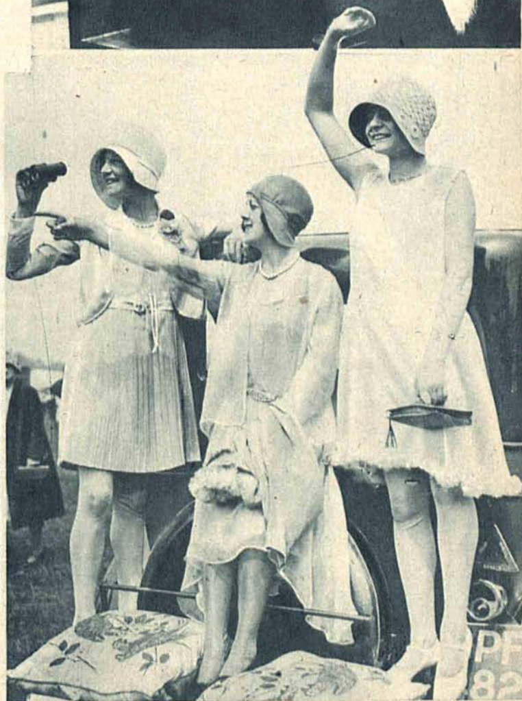
Na prawo: Trzy urocze „ladies“ przybyły na wyścigi w Ascot własnym autem i z zaimprowizowanej trybuny z zajęciem śledzą przebieg wyścigów.

n wręcza mana re- zwycię- y angiel- arnieju n.