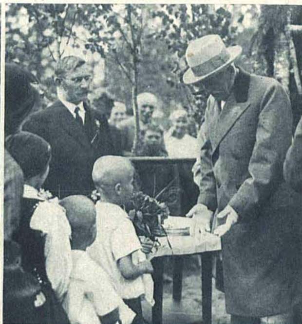
Z pobytu P. Prezydenta Rzplitej na Wileńszczyźnie. W dn. 18 czerwca Prezydent Rzplitej w przejeździe z Wilna do W. Solecznki zwizdził osadę „Las Rudnicki“. Powitanie dzieci osadników.