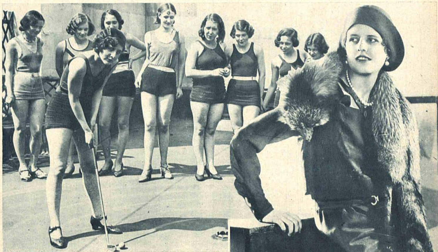
Podczas upalnych dni letnich, w gimnazjach i internatach żeńskich godziny sportu i gimnastyki odbywają się na wolnym powietrzu w kostjumach kąpielowych.