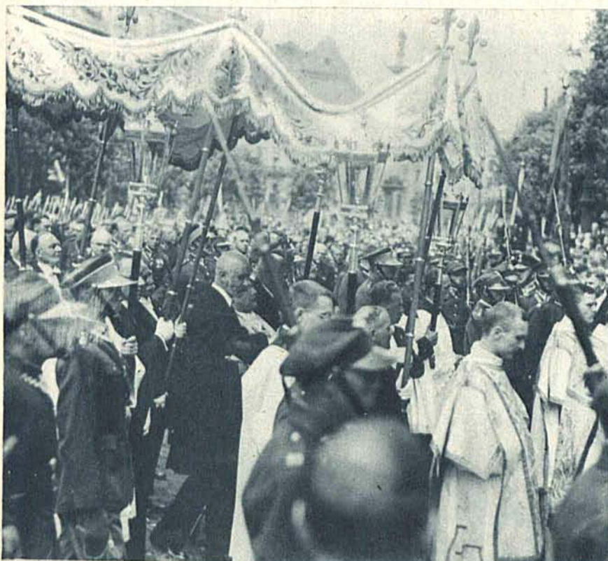
Fragment z procesji w dzień Bożego Ciała w Warszawie. Pod baldachimem kroczy nuncjusz apostolski ks. arcybiskup Marmaggi, prowadzony przez p. prezesa Rady ministrów płk. Sławka z jednej strony, oraz marszałka senatu prof. Szymańskiego — z drugiej.