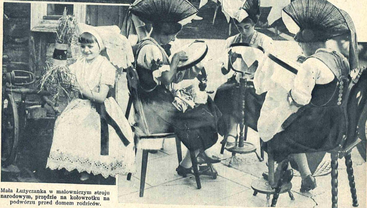
Mała Łużyczanka w malowniczym stroju narodowym, przędzie na kołowrotku na podwórzu przed domem rodziców.