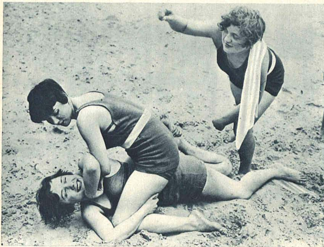
Improwizowany mecz atletyczny urządziły sobie te młode dziewczynki dla urozmaicenia przedpołudnia spędzonego na plaży.