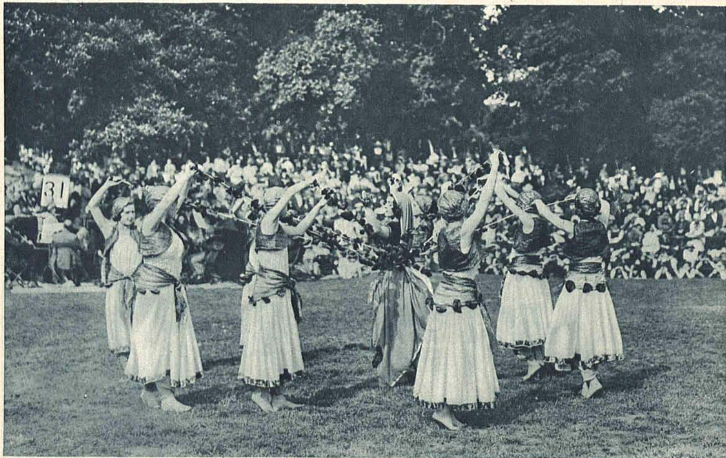
Popis londyńskiej szkoły rytmiki i tańca klasycznego, urządzony przed licznie zebraną publicznością w Hydeparku.

Najpiękniejsza kobieta Polski — używa stale do twarzy i rąk kremu „Neige de Fleurs” „Kwiat śnieżny” który działa cudownie na upiększenie cery.