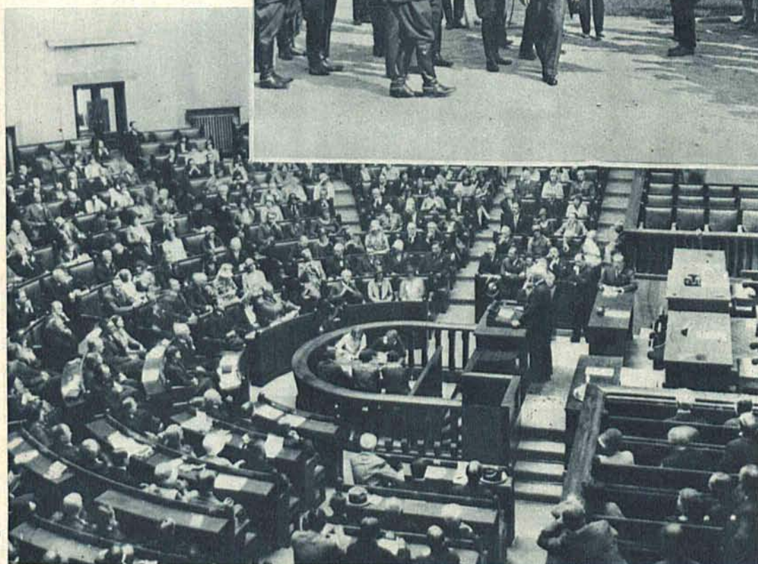
Dnia 20-go czerwca P. Prezydent Rzplitej na dziedzińcu pałacu reprezentacyjnego w Wilnie przyjął delegację młodzieży wiejskiej, która przybyła dla złożenia hołdu.