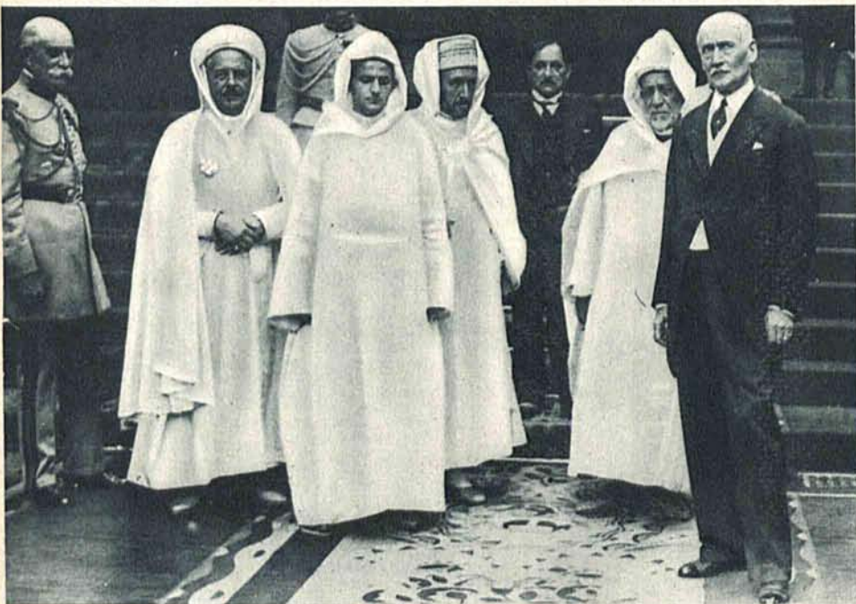
Sułtan Marokka Si Mohamed złożywszy wizytę prezydentowi Francji Doumergue, opuszcza ze swiżą pałac Elizejski.