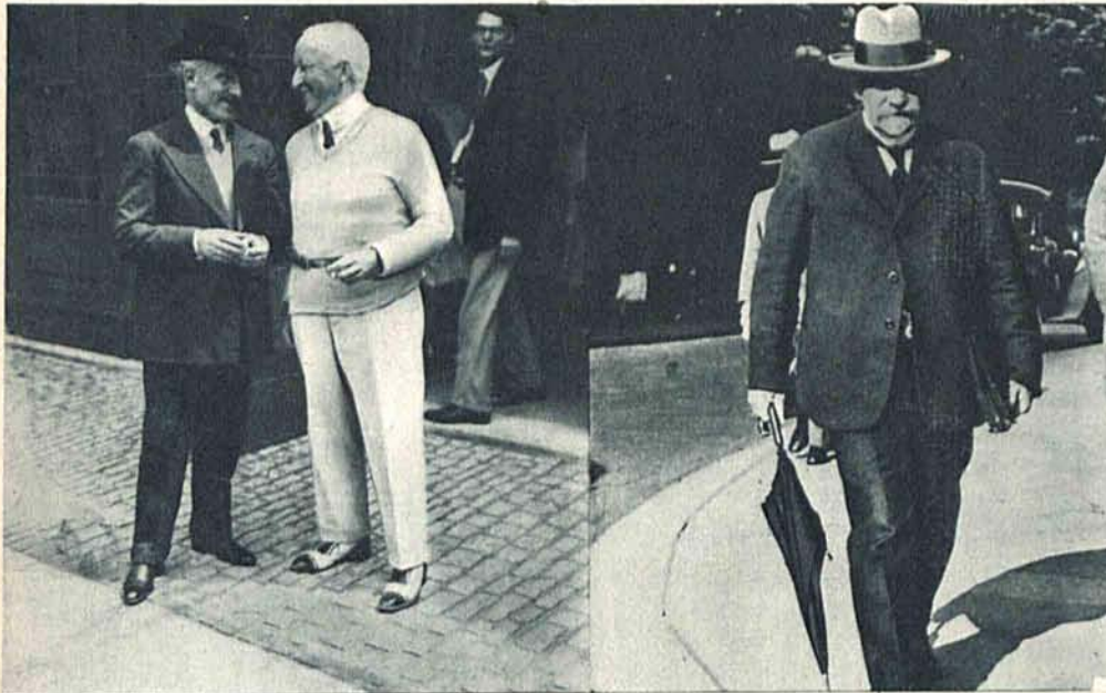
Na uroczystości wagnerowskie w Bayreuth przyjechał słynny dyrygent włoski Toscanini (na lewo) i syn Wagnera, Siegfried.