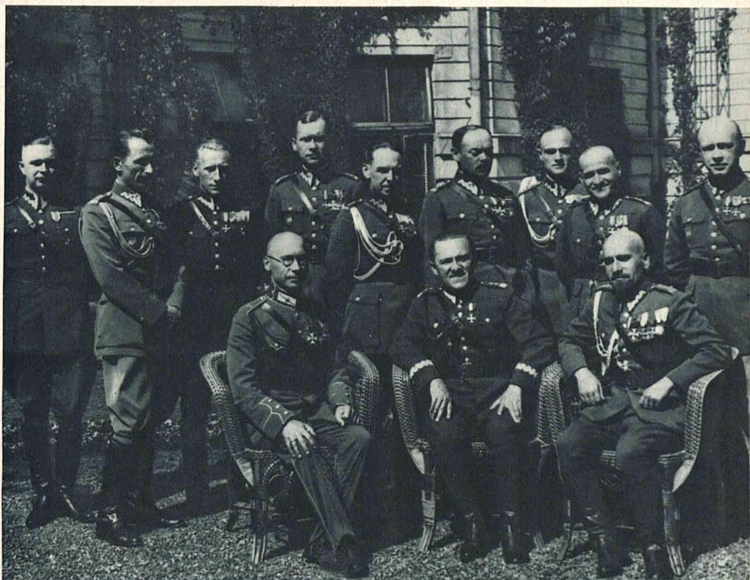
Dnia 11 lipca szef sztabu głównego gen. Piskor wydał śniadanie w hotelu Europejskim na cześć nowomianowanego attache wojskowego lotewskiego w Warszawie płk. Aleksandra Wintera. Na zdjęciu gen. Piskor oraz attache wojsk. Winter w otoczeniu oficerów ze sztabu głównego.