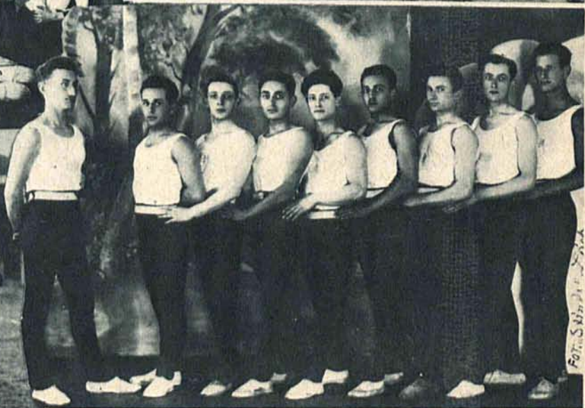
Wzorowa grupa gimnastyków „Bar Kochby“ wykazuje obecnie doskonałą formę.