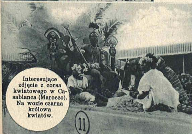
Interesujące zdjęcie z corsa kwiatowego w Casablance (Marocco). Na wozie czarna królowa kwiatów.