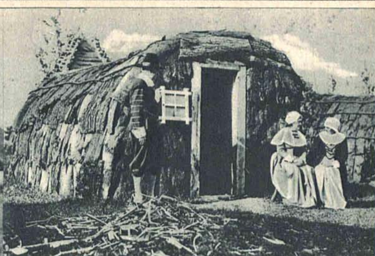
Z okazji 300-ej rocznicy istnienia miasta Salem w Stanach Zjedn. odtworzono chatkę zamieszkałą przez założycieli miasta.