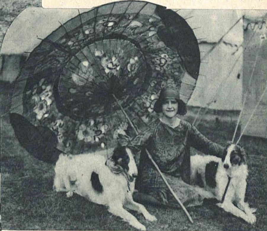
Wspaniałe okazy „Borzois“ nagrodzone na wystawie psów w Richmond. Na lewo: Z wyścigu kolarskiego „Tour de France“. Zasłużona nagroda dla zwycięzcy dystansu.