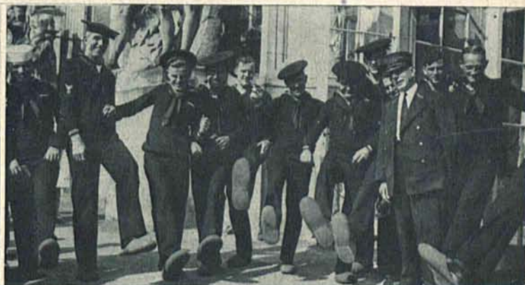
Amerykańscy marynarze zwiedzający zamek królewski w Poczdamie, pokazują ze śmiechem olbrzymie papucie, które im ubrano przed zwiedzaniem.