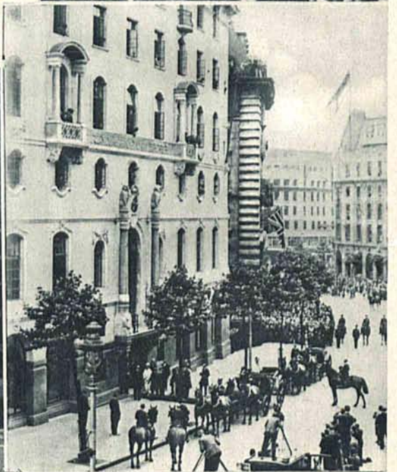
Król angielski Jerzy przyjeżdża na poświęcenie „Domu indyjskiego“ w Londynie.