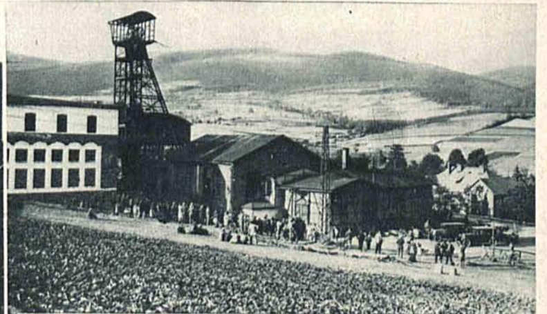
Wejście do kopalni „Kurt“ pod Wrocławiem, w której wydarzyła się straszna katastrofa. Na lewo: Jedna z grup ratunkowych przed zjazdem do kopalni.