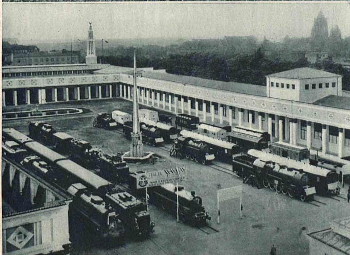
Na lewo: Międzynarodowa Wystawa Komunikacji i Turystyki w Poznaniu. Impo- nująco przedstawia się dział kolejnictwa na Wy- stawie. Na olbrzymim placu wystawowym wi- dzimy „ostatni krzyk“ w tej dziedzinie. Foto- grafia nasza przedstawia park lokomotyw i wa- gonów kolejowych produkcji: czeskiej, włoskiej rumuńskiej i polskiej.