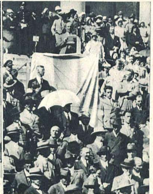
Przewrót w Finlandji. Nowy premier Svinhufwud. Na prawo scena z marszu lappowców na Helsingfors. Przemawia przywódca partji Kosola.