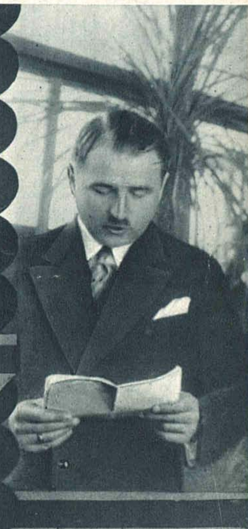
Wiceminister Starzyński na uroczystości niedzielnej przy poświęceniu nowego gmachu Izby Skarbowej w Łodzi.