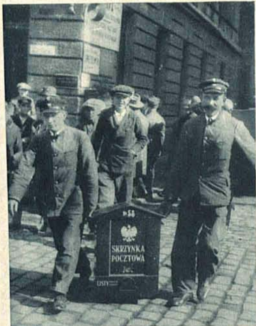
Łódź otrzymała nowe skrzynki pocztowe.

Na prawo: Nowy gmach Izby Skarbowej przy Aleji Kościuszki.