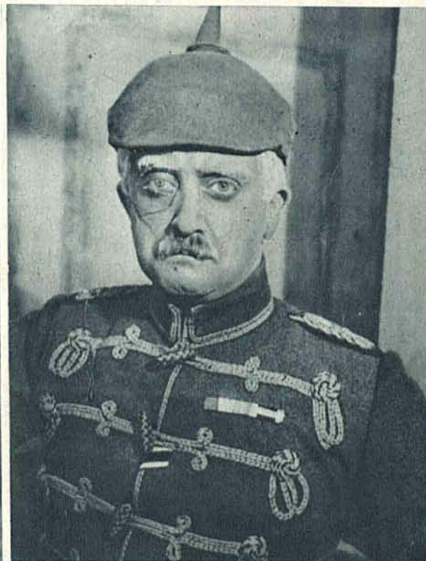
Józef Winawer (Ekscelencja von Lychow).