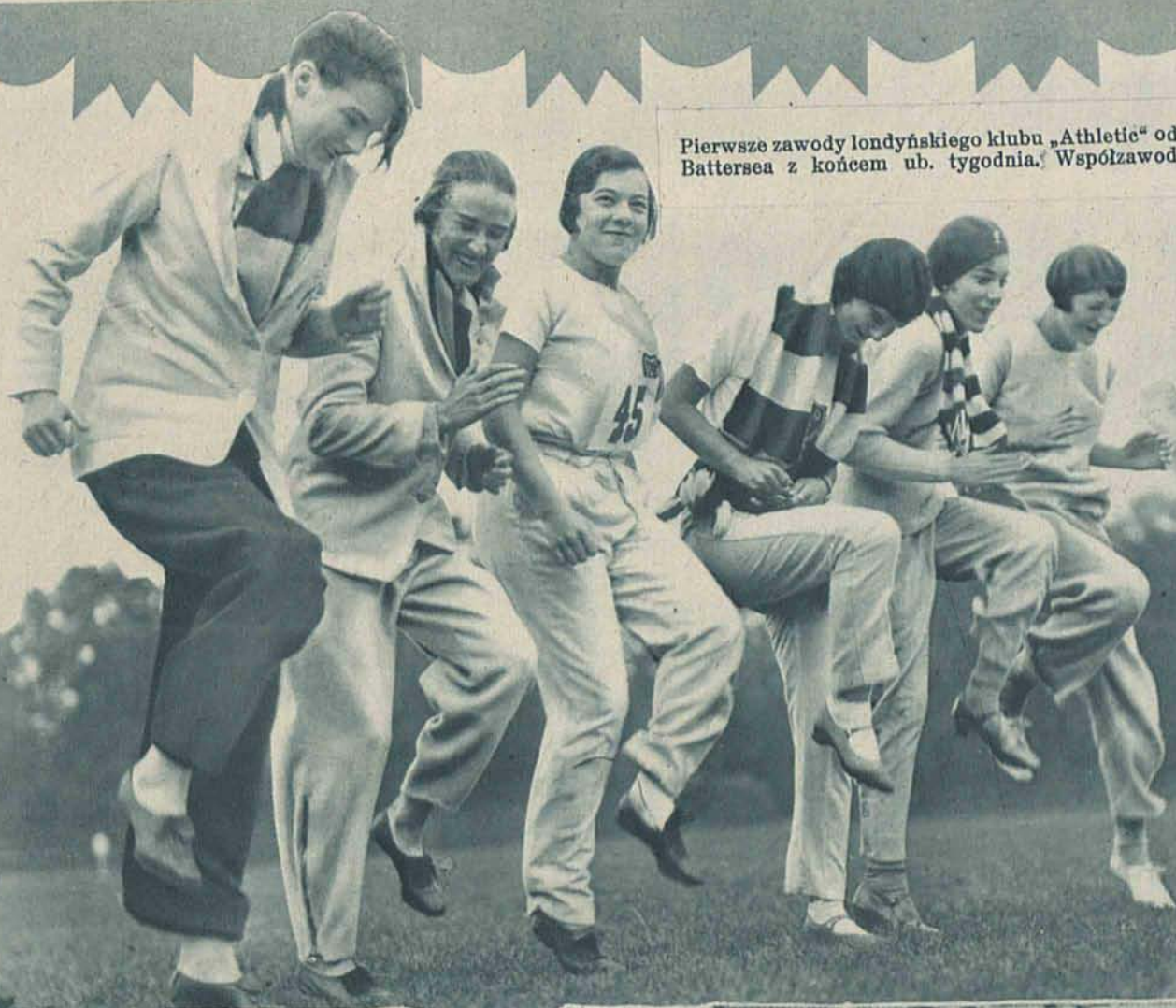
Pierwsze zawody londyńskiego klubu „Athletic” odbyły się w parku Battersea z końcem ub. tygodnia. Współzawodniczki w biegu.