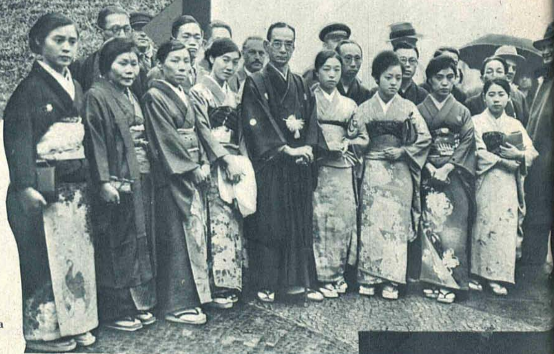
Japońska trupa teatralna zajęła na gościnne występy do Berlina.