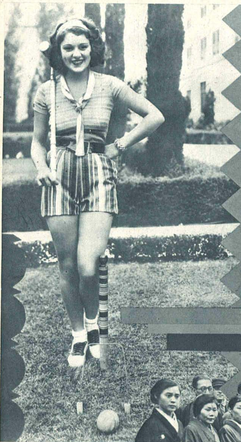
Miss Lillian Roth piękna gwiazda filmowa demonstruje najmodniejszy bogaty w barwy kostjum kąpielowy.