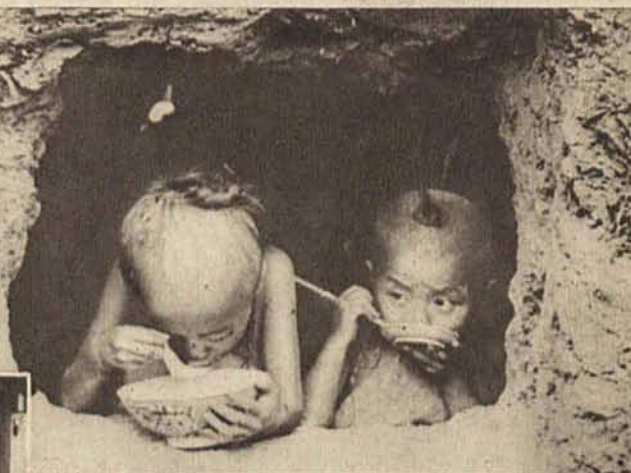
Mali mieszkańcy Mandżurji (Chiny) przy śniadaniu wyglądają przez „okno” prymitywnej chaty.