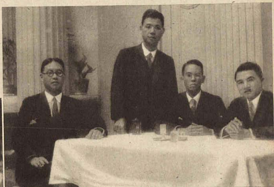
W ubiegłym tygodniu bawiła w Łodzi delegacja przemysłowców japońskich w celu nawiązania kontaktu z polskim przemysłem włókienniczym.

-Dziś ma cudowną cerę! -Tak, bo od urodzenia pielęgowano mnie HYDLEN BÉBÉ SZOFMANA!