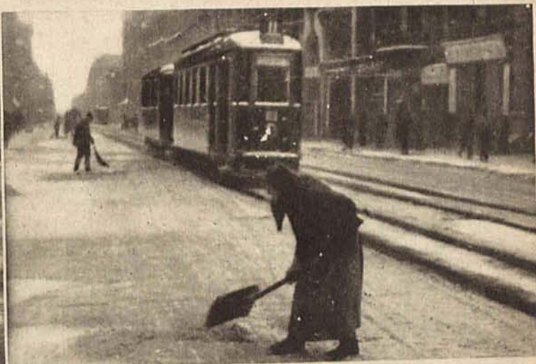
Widok ul. Piotrkowskiej.