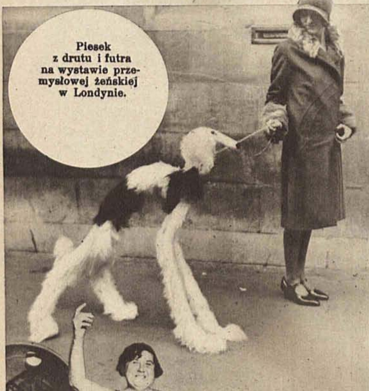
Piesek z drutu i futra na wystawie przemysłowej żeńskiej w Londynie.