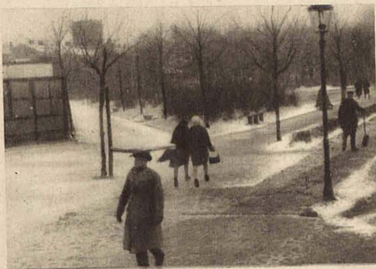
Park Poniatowskiego pokryty białym całunem.