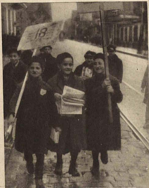
2 obrazki z wyborów w Łodzi.