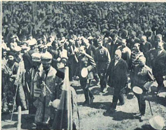
Uroczystość 1000-lecia istnienia Bułgarii w Presławie, dawnej stolicy państwa.