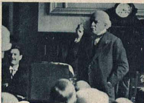
Lloyd George przemawia na pierwszym zgromadzeniu przedwyborczym partii liberalnej w Londynie.