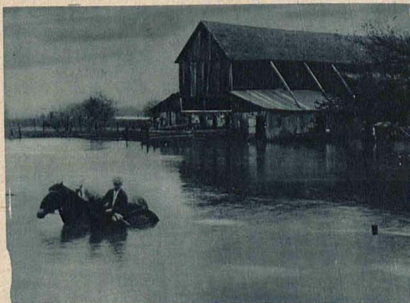
Zatopione olbrzymią powodzią obszary w Canzas (Ameryka półn.).