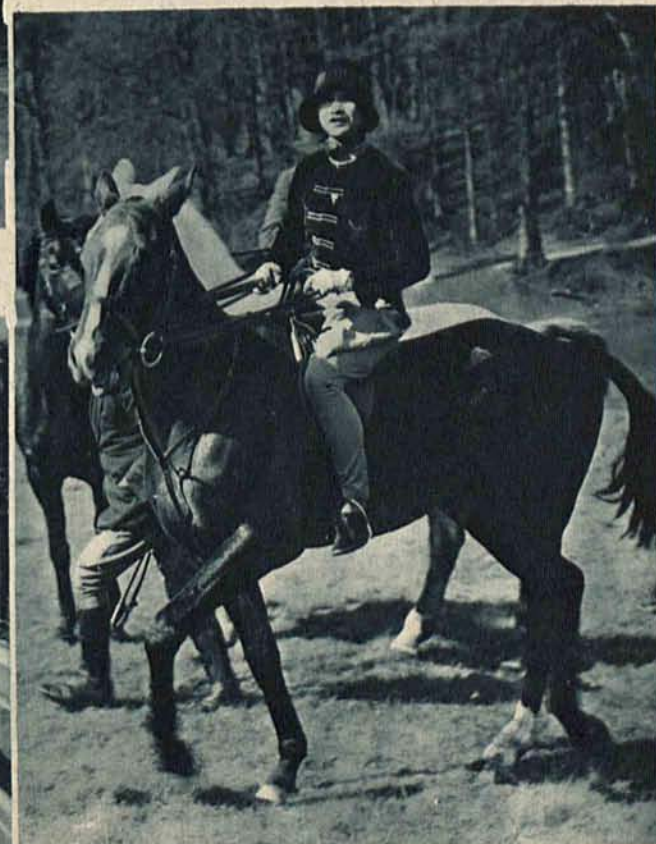
Artystka filmowa Anna May Wong na swej rannej przejażdżce.