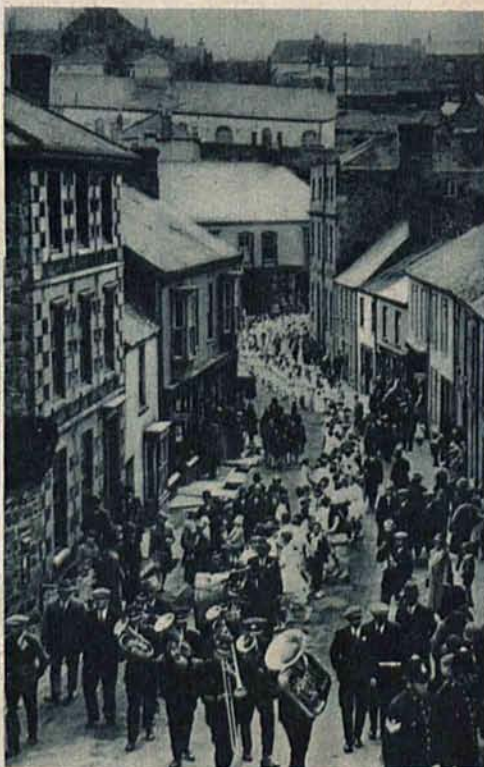
W miasteczku angielskiem Helston odbywa się co roku „tanečna” procesja przy dźwiękach muzyki.