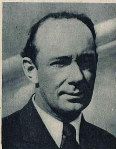
Hubert Wilkins, słynny lotnik, zdobywca bieguna północnego, zamierza w tym tygodniu przelecieć Atlantyk.