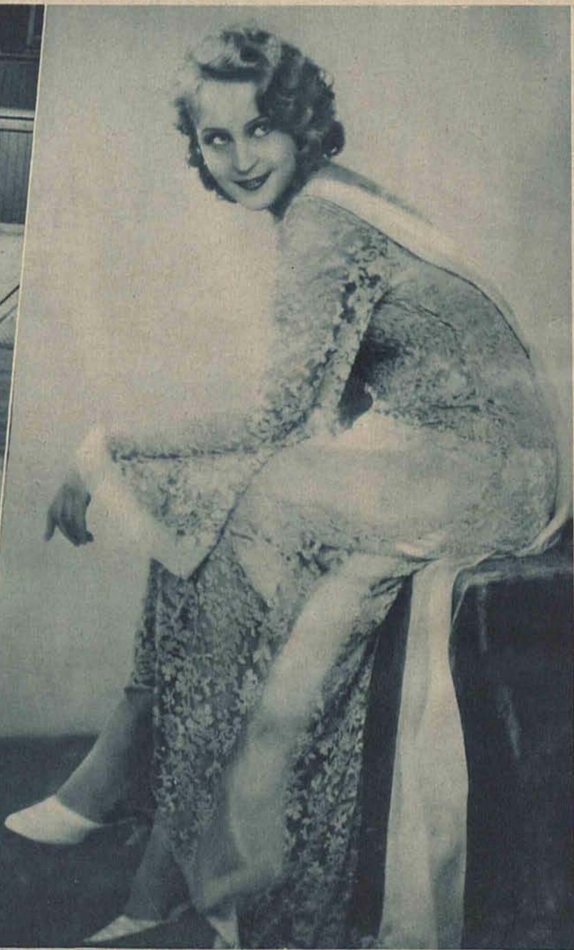
Brygita Helm znakomita niemiecka aktorka filmowa w rannym stroju.