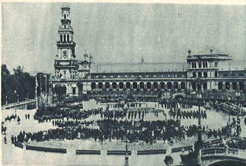
Otwarcie wystawy iberyjsko-amerykańskiej dn. 9 maja w Sewilli. Na prawo znajdują się na wystawie dokładny model okrętu Kolumba „Santa Maria“.