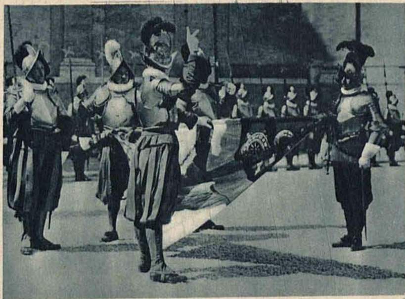
Zaprzysiężenie nowych rekrutów w gwardji papieskiej w Watykanie.