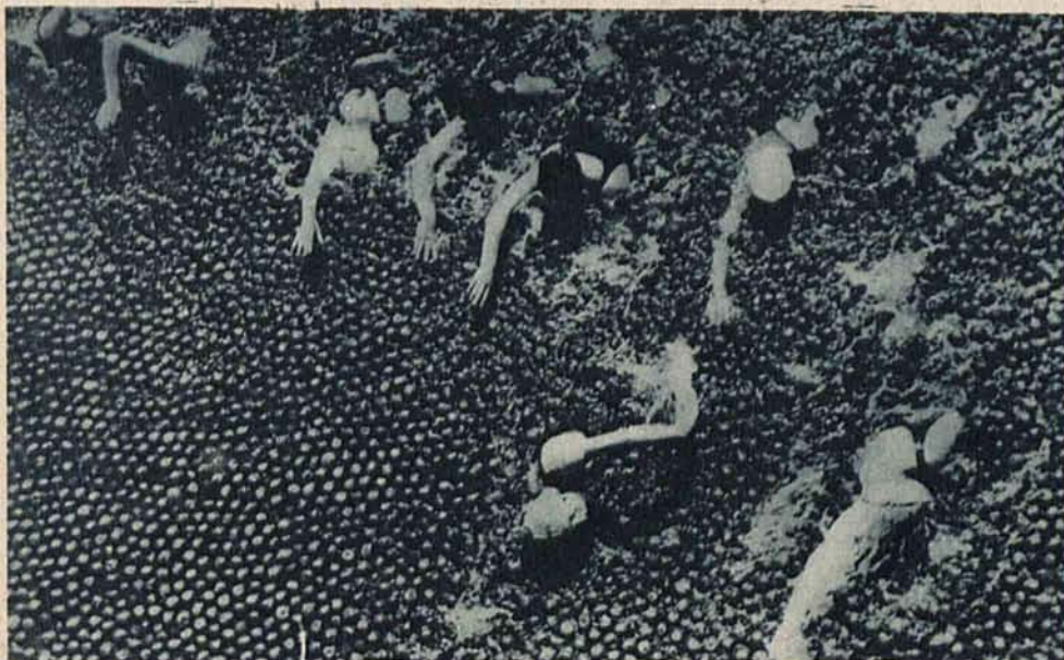
Iście amerykański pomysł: zawody pływackie w basenie, którego cała powierzchnia pokryta jest pomarańczami.