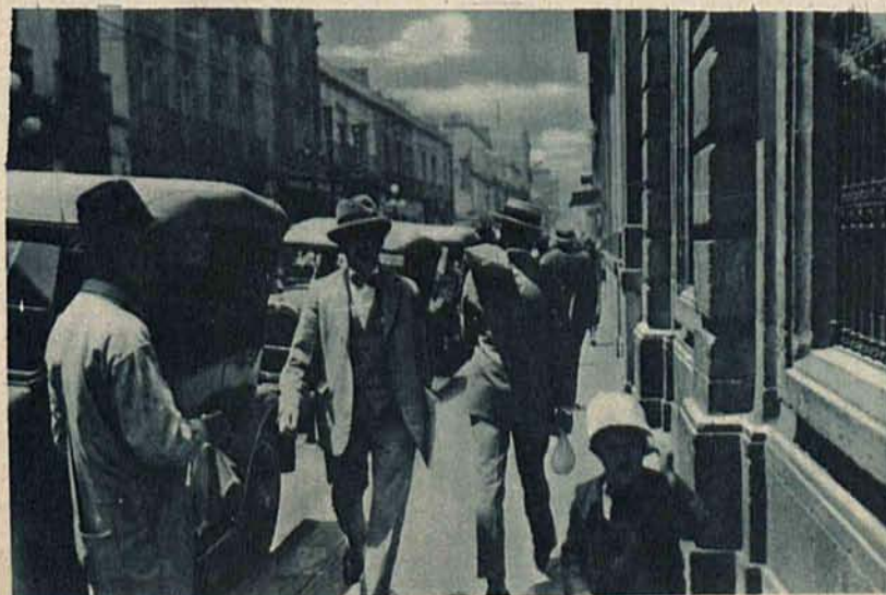
Dowód bezpiecznych stosunków w Meksyku. Transport pieniędzy przez ulice miasta bez żadnej eskorty.