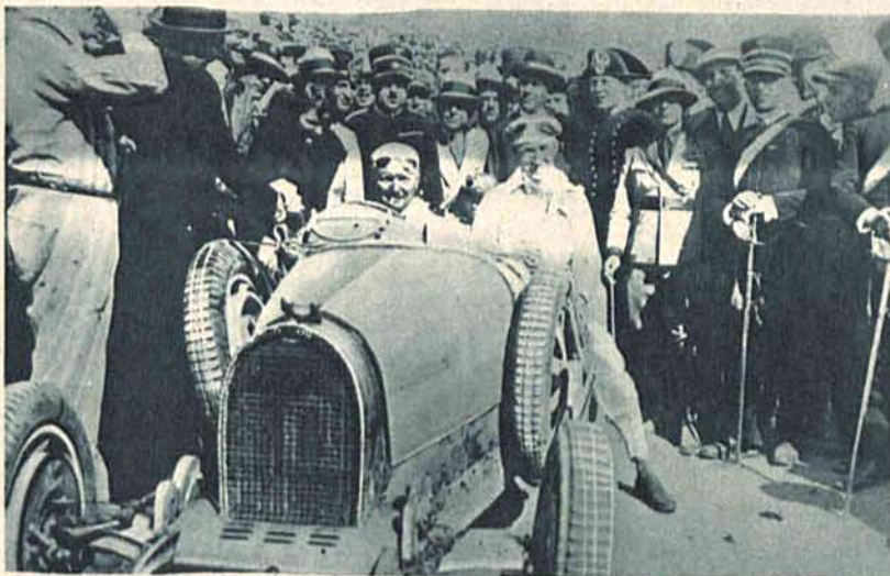
Najcięższy wyścig samochodowy świata „Targa Florio“ na Sycylii wygrał w tym roku Francuz Divo na Bugatti'm.