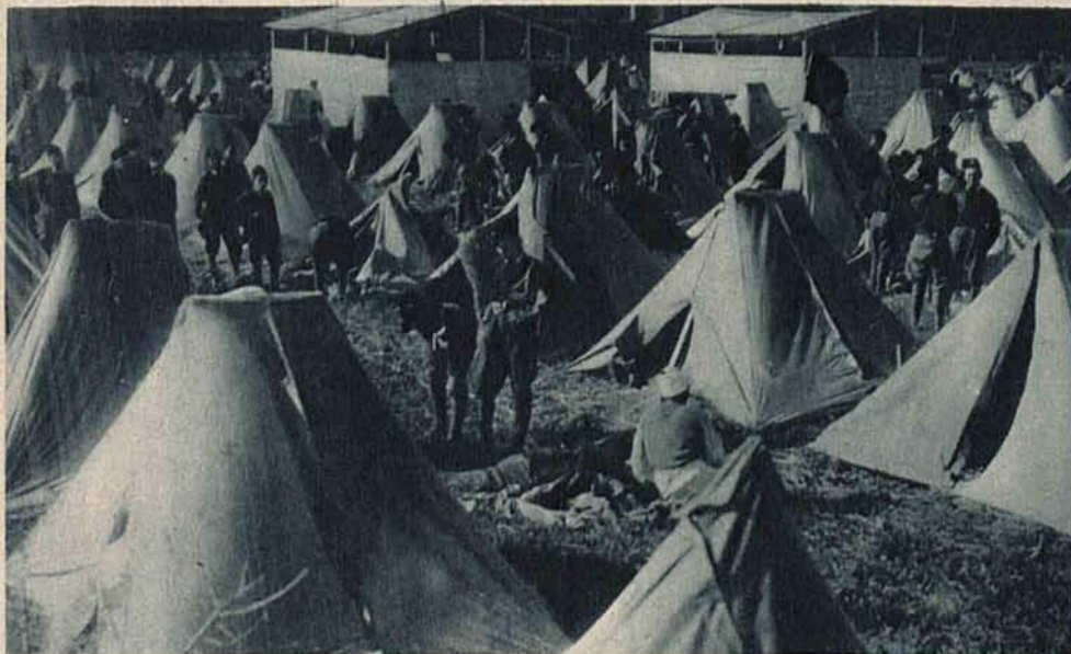
Obóz wakacyjny młodzieży faszystowskiej koło Parioli, w którym znajduje się 15,000 chłopców.