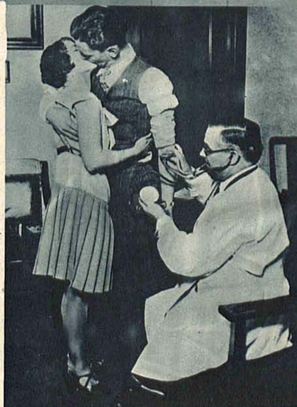
Na prawo: Mierzenie pulsu przy pocałunku. Badania wykazały, że skazany na śmierć ma 20 uderzeń ponad normę zaś całujący przeszło 30.