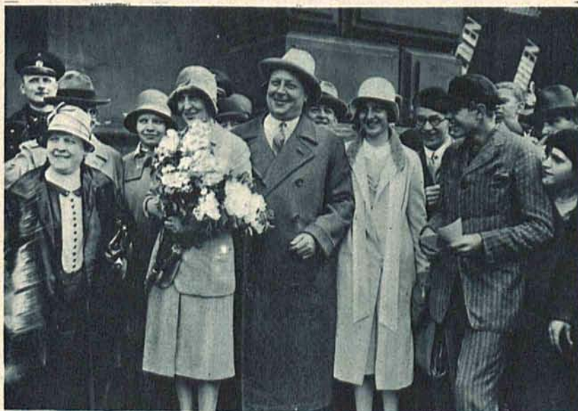
Emil Jannings z małżonką powrócił na dłuższy czas do Europy.