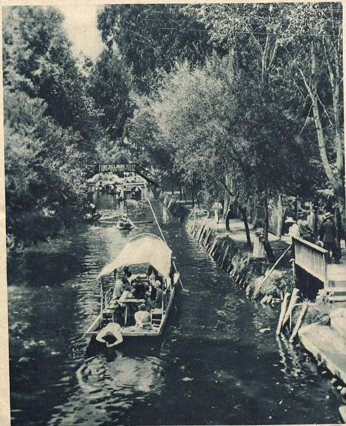
Idylliczny obrazek z wojowniczego Meksyku. „Week-end“ na wodzie przypominający Tamizę pod Londynem. Widać z tego obrazka, że nie cały Meksyk objęty jest rewolucją.

Dodatek niedzielny „Republiki“ z dnia 27 maja 1929 r.