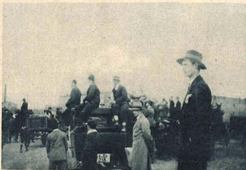
Pomysłowa „gapa” na meczach. Zapaleni amatorzy emocyj sportowych,

nie mający możności wykupienia biletu wstępu na mecz radzą sobie w ten sposób, że wynajmują kilka taksówek i dorożek i za minimalną opłatą patrzą z wysokości poprzez płot na rozgrywkę ligową. Zdjęcie powyższe zostało dokonane na boisku W. K. S. w czasie meczu Ł. K. S. — Garbarnia.