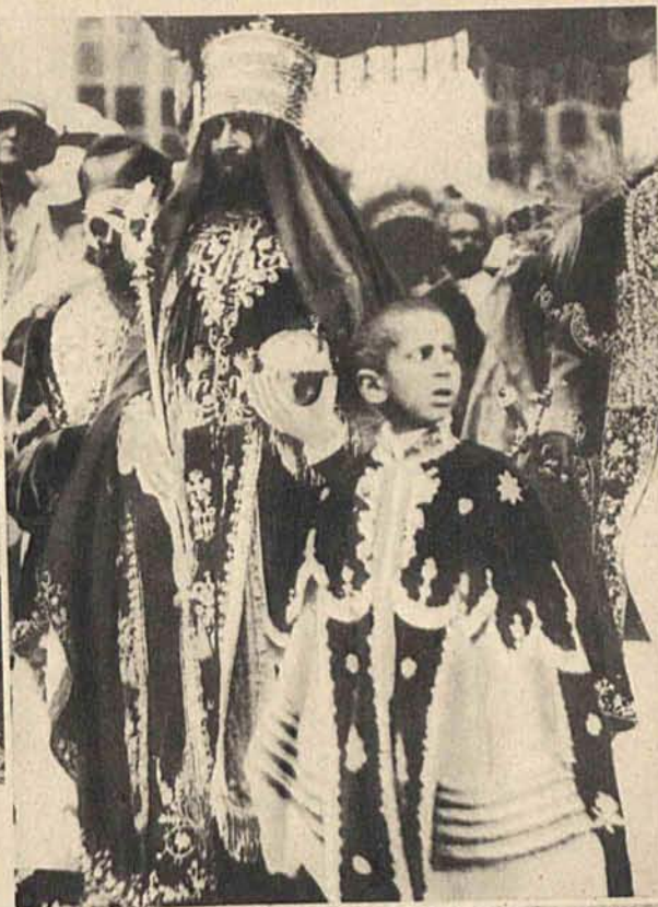
Katolicka szkoła na wolnym powietrzu w Szanghaju w Chinach. Na prawo: Ras Tafari cesarz Etyjopji w stroju koronacyjnym.