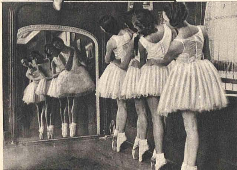
Piękny moment z ćwiczeń Szkoły Baletu Espinosa do pantominy wystawianej w całej Anglii przed Bożym Narodzeniem.