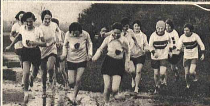
Bieg na przełaj przeszło 150 członkiń kobiecego Klubu Atletyki w czasie zawodów o szampionat w Wimbledon Common pod Londynem.