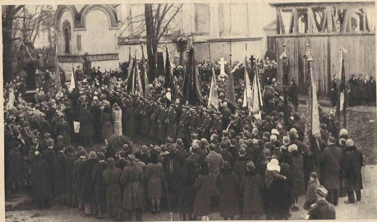
Dnia 30-go listopada odbyła się na Woli uroczystość założenia kamienia węgielnego pod pomnik gen. Sowińskiego, w której wzięły udział tłumy publiczności.