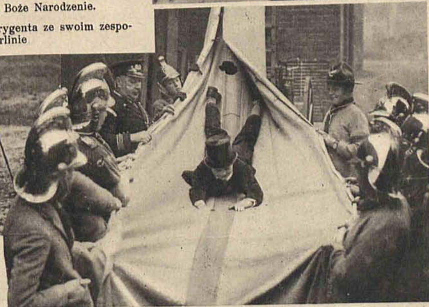
Suchy trening narciarski przed sezonem zimowym. Na prawo: Kolegium Eton w Londynie posiada swój oddział straży ogniowej. Ćwiczenie spuszczenia ofiar pożaru z wysokości 15 metrów w rurze płóciennej.