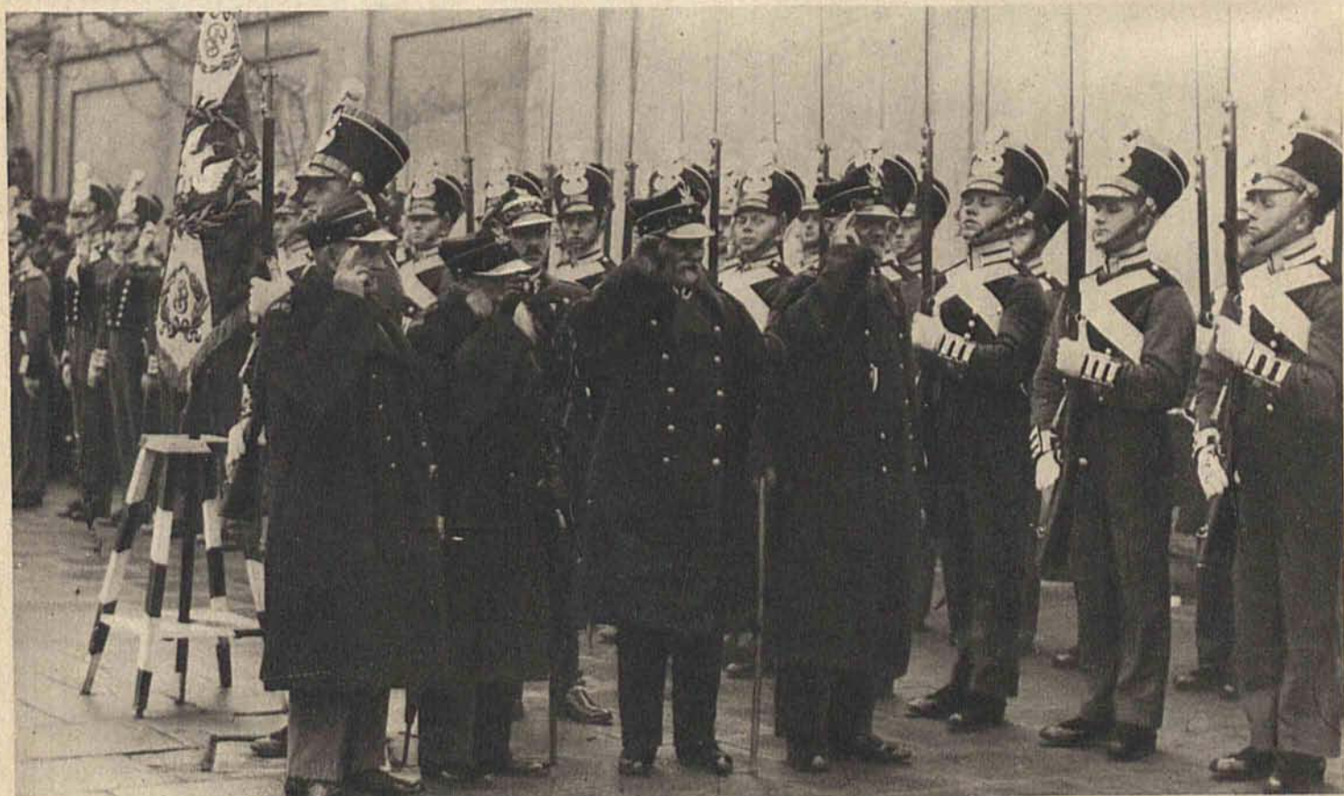
Warta przed Belwederem trzymana przez podchorążych w historycznych mundurach z 1830 roku. Weterani 1863 r. przechodzą przed frontem oddziału podchorążych.