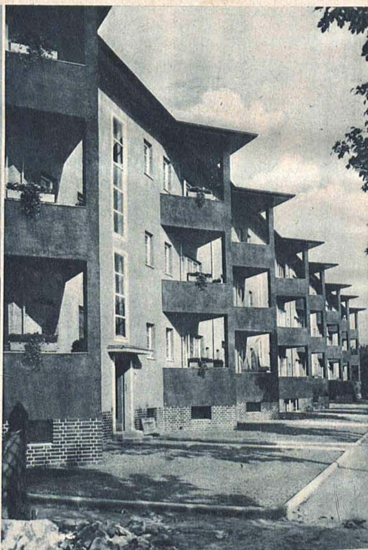
W Mariendorf pod Berlinem zbudowano osiedle przeznaczone wyłącznie dla kawalerów.