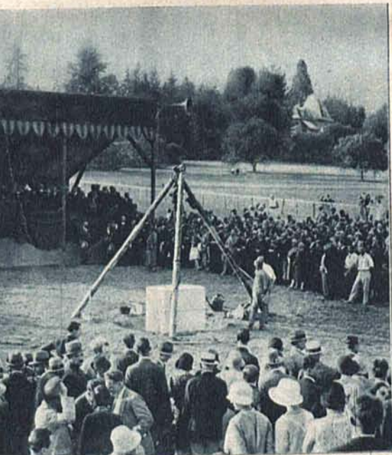
Poświęcenie kamienia węgielnego na budowę gmachu Ligi Narodów w Genewie. Poświęcenie odbyło się w obecności Brianda, Drumonda (sekretarza Ligi) i Haaba (prezydenta Szwajcarii).