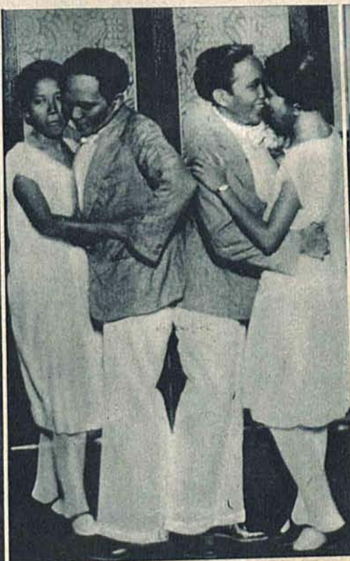
Wesele sławnych „sjamskich braci“ Lucia i Sunplicia Godino, odbyło się w Manilli (Filipiny). Na zdjęciu widzimy braci tańczących ze swymi małżonkami.