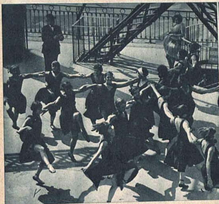
Podczas upałów jesiennych próby baletu paryskiej „revue“ Moulin Rouge odbywały się na szerokim tarasie wieży Eiffla, wysoko ponad miastem.