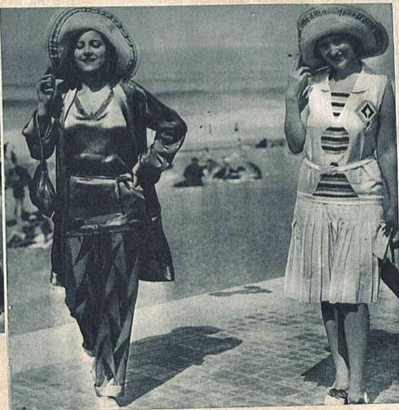
Podczas gdy u nas panują już przymrozki, na plaży w Biarritz lato w całej pełni. Oto dwa pomysłowe modele plażowych kostiumów.