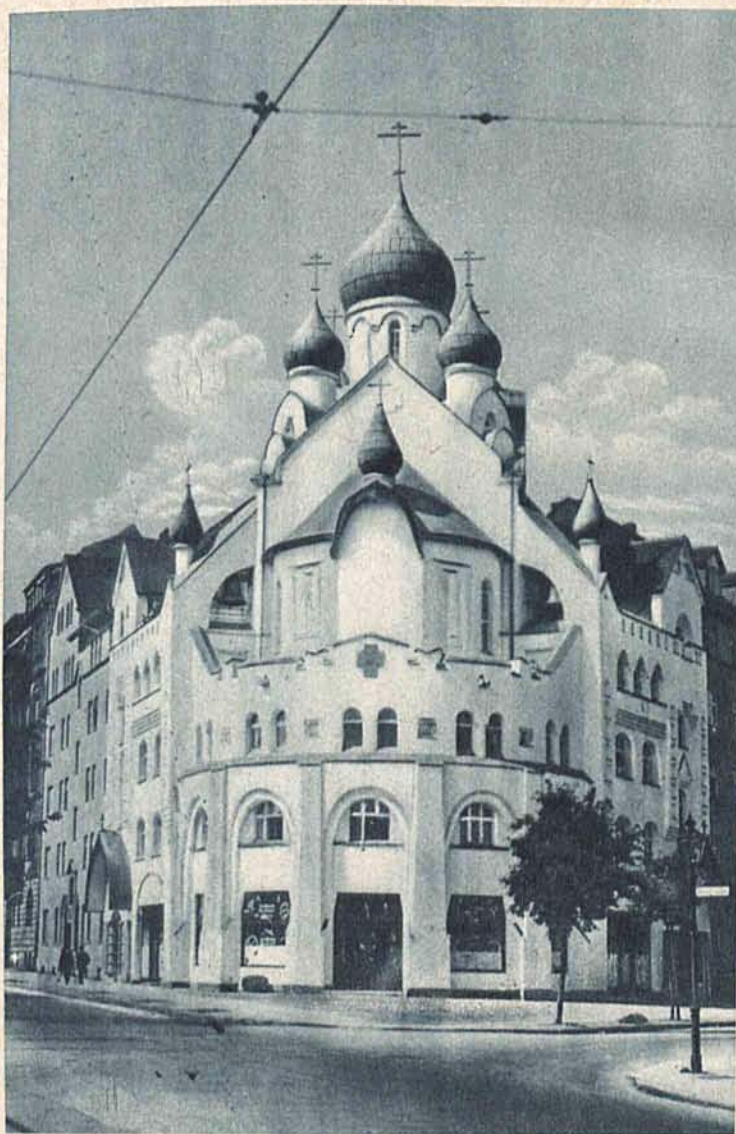
Cerkiew prawosławna w Berlinie wystawiona została na licytację.