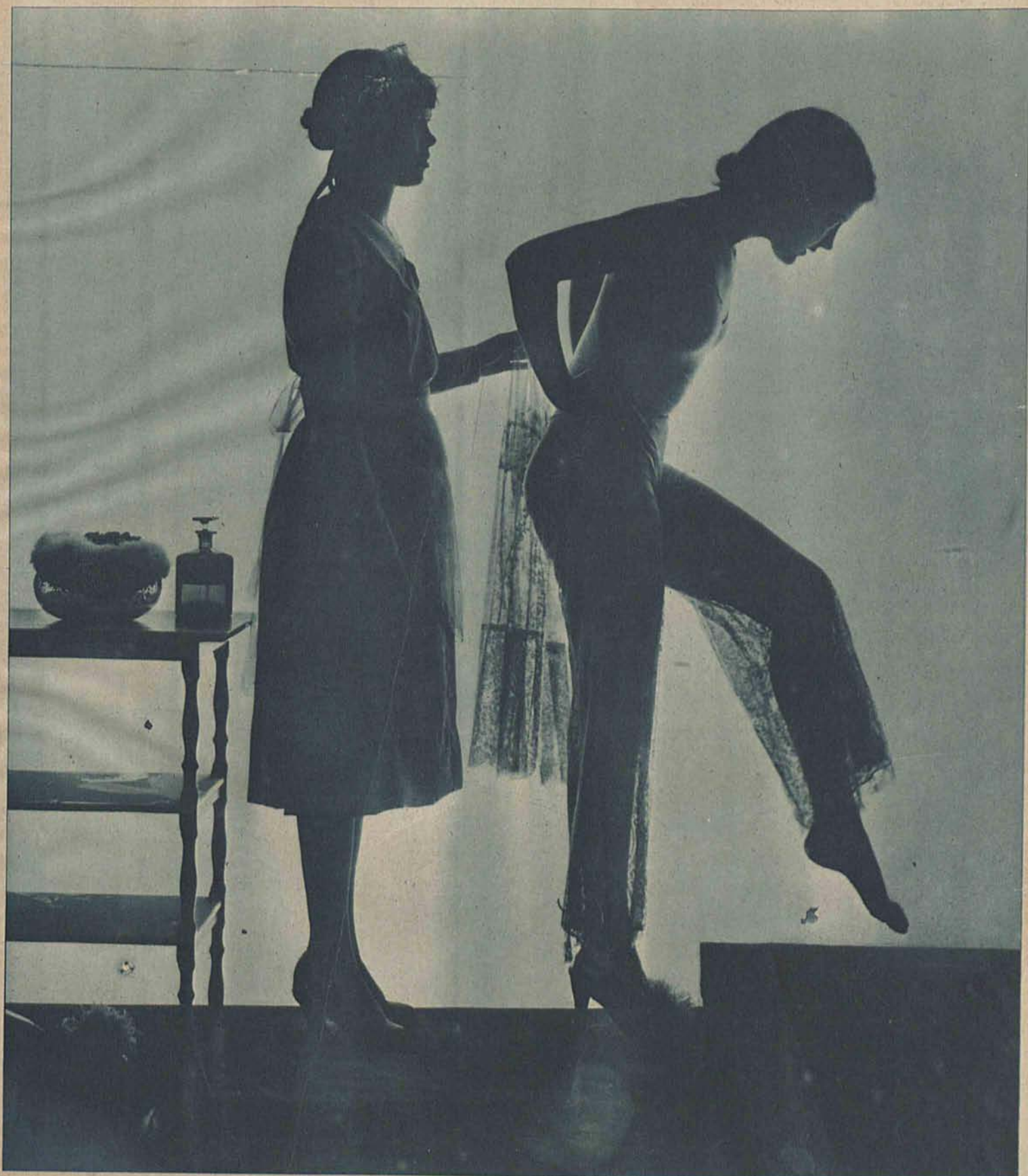
Uroczą gwiazdą „Paramountu“ Doris Hill po kąpieli.

Dodatek niedzielny „Republiki“ z dnia 29 września 1929 r.