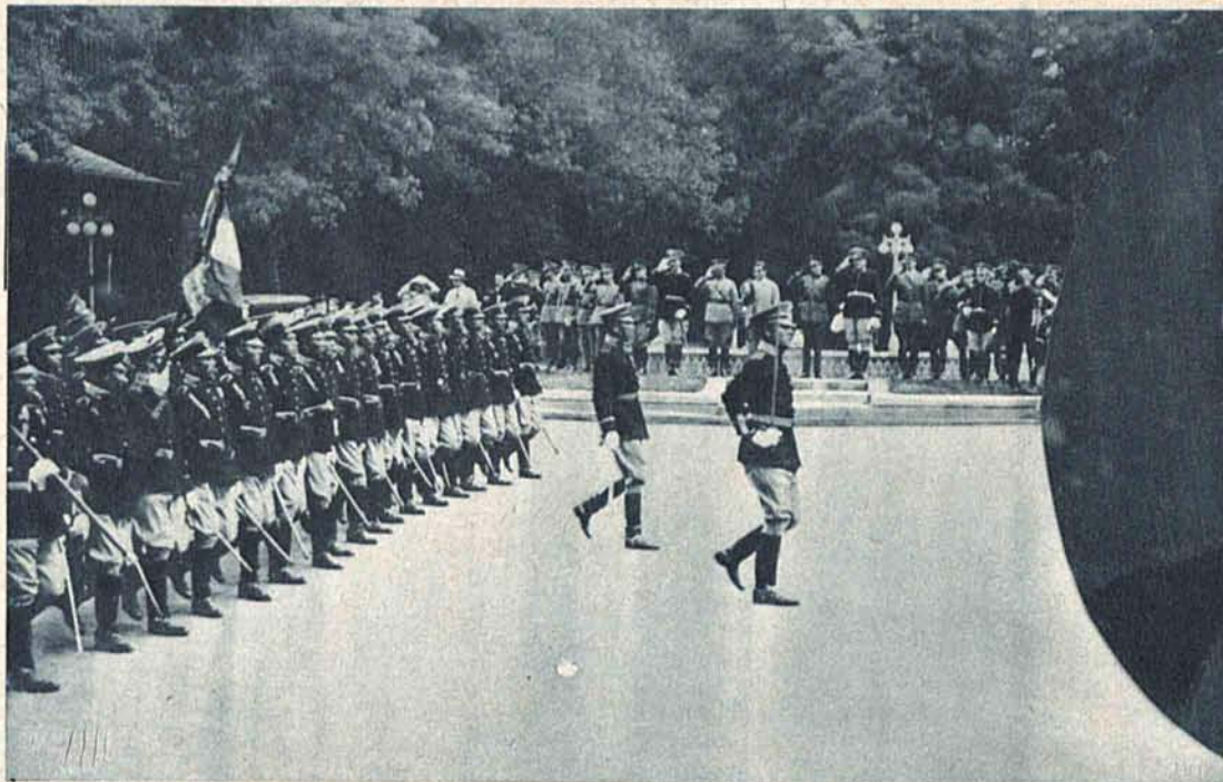
Gwardja meksykańska defiluje przed prezydentem Portesem Gil.