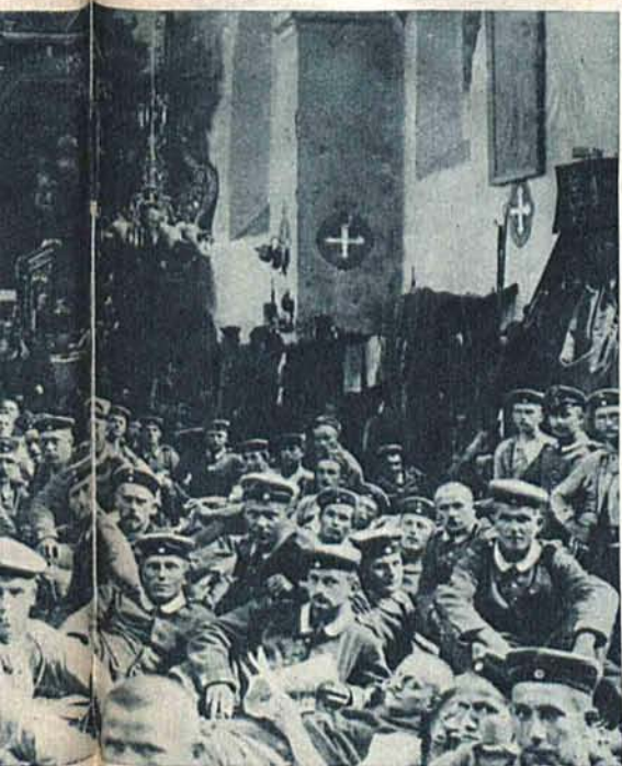
Na lewo: Żołnierze niemieccy w kościele w jednym z miasteczek pod Łodzią.