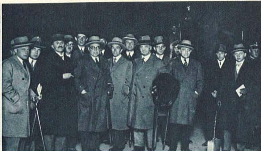
Do Warszawy przybyli dziennikarze niemieccy z Poznania, gdzie zwiedzali Powszechną Wystawę Krajową. Zdjęcie nasze przedstawia uczestników wycieczki na dworcu Warszawa Główna.