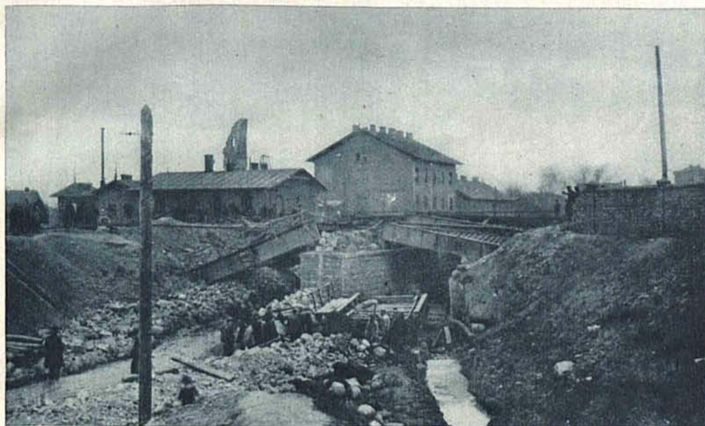
Most na ul. Konstantynowskiej.