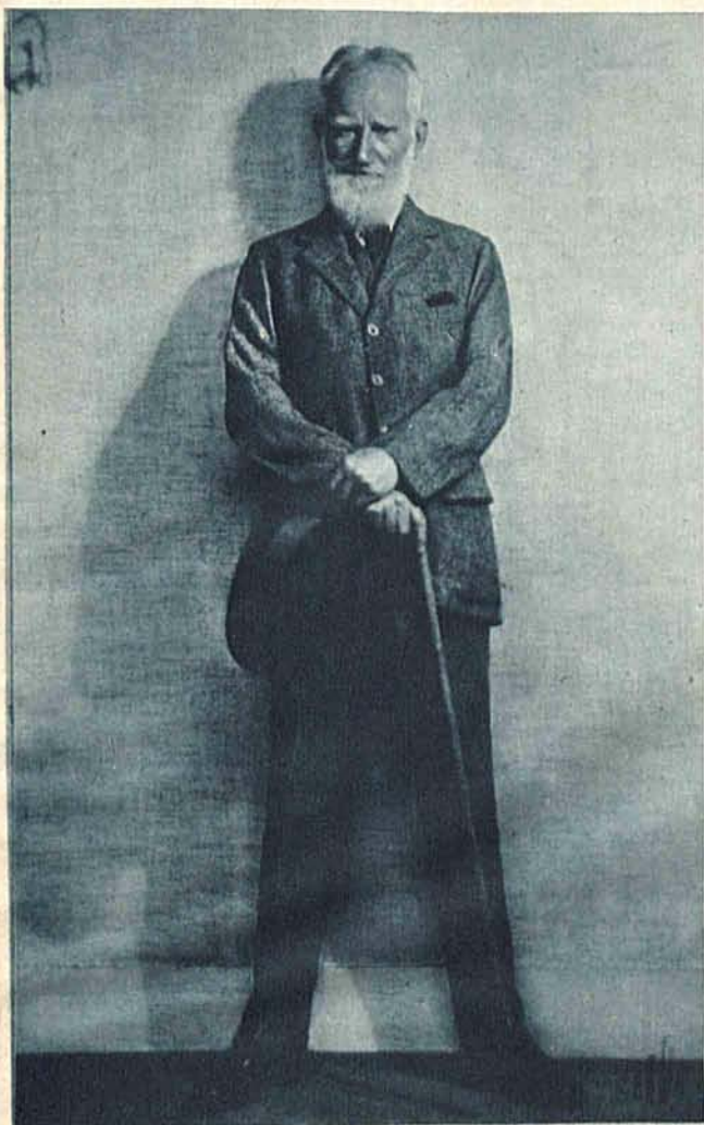
Ostatnie zdjęcie G. B. Shaw'a znakomitego autora rewelacyjnej komedji „Wielki Kram“.