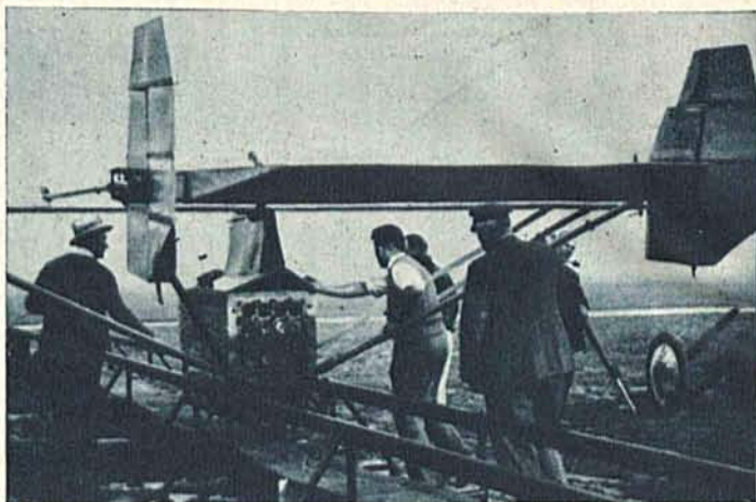
Przygotowania do próbnego lotu, samolotu raketowego inż. Fryderyka von Opela, który odbył się w Frankfurcie.