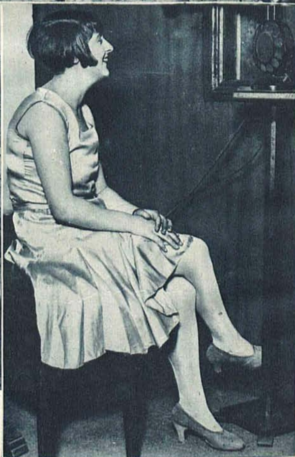
Na prawo: Próba audycji radio londyńskiego połączona z telewizją. Słuchacze mogli widzieć śpiewaczkę śpiewającą do mikrofonu.