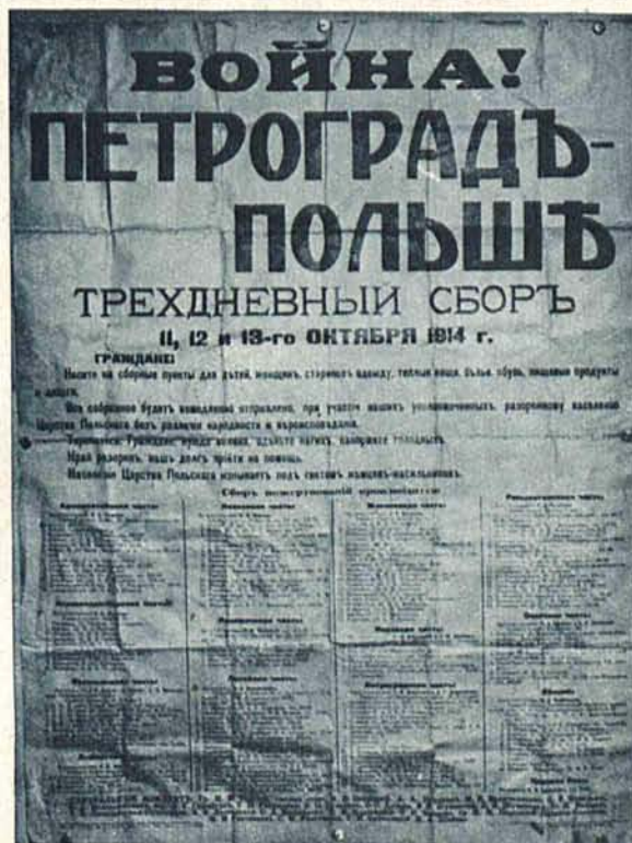
Na prawo: Odezwy rozlepione przez rosjan podczas oblężenia.