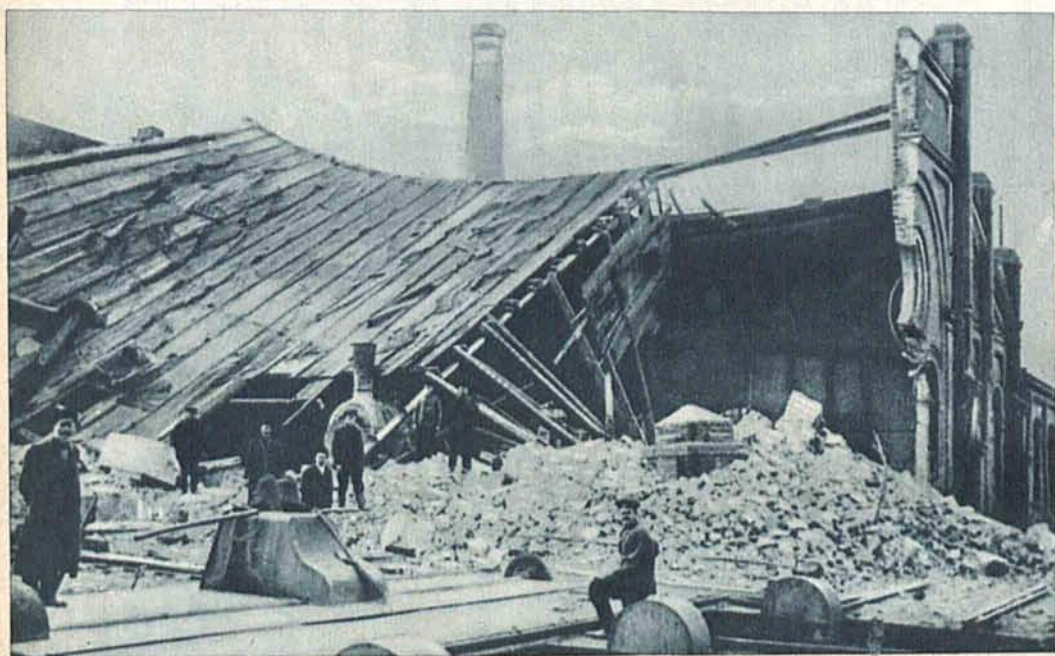
Zbombardowana remiza na stacji Łódź-Kaliska.