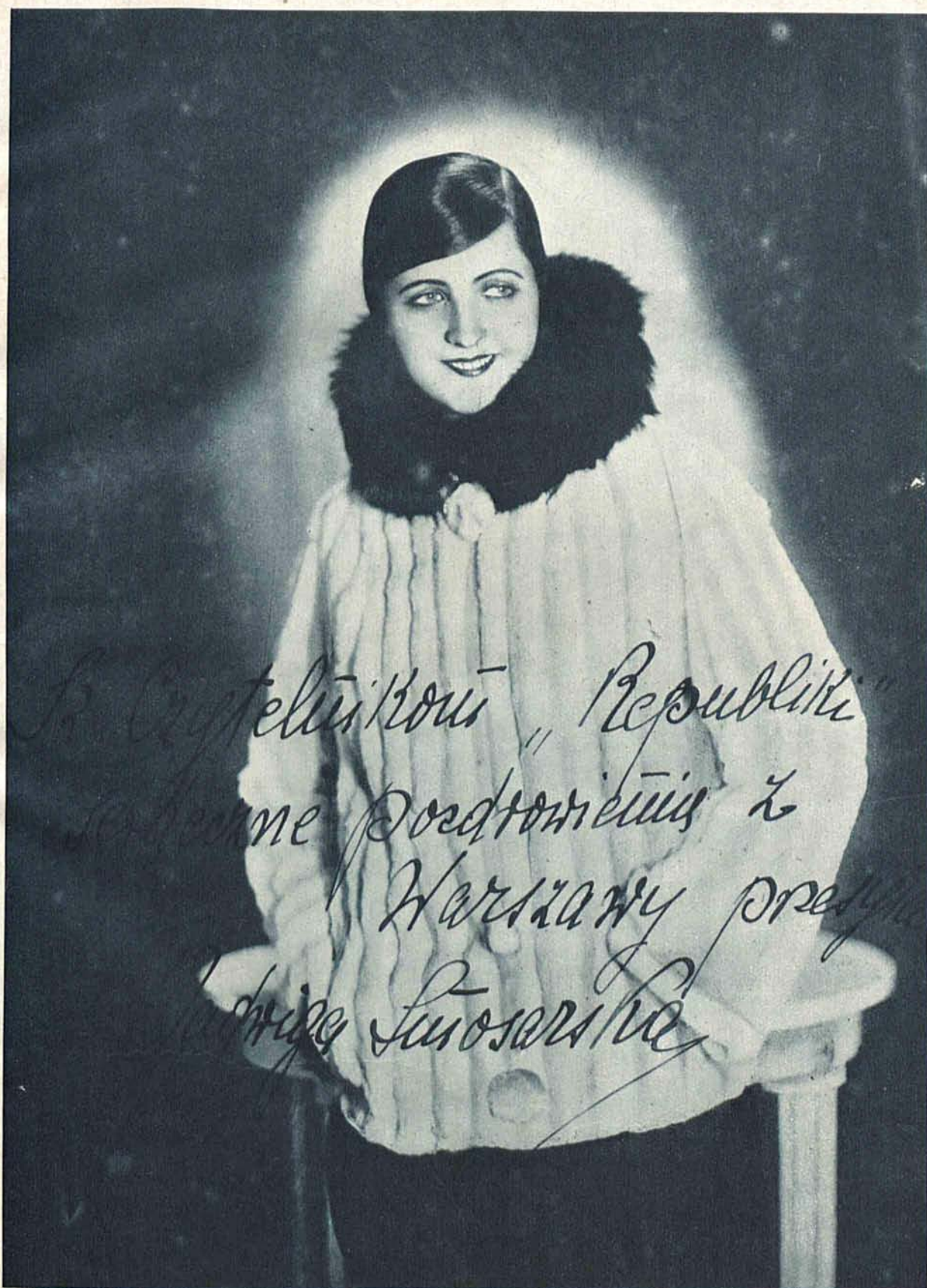
Ostatnie zdjęcie znanej gwiazdy filmowej i artystki dramatycznej J. Smosarskiej.

Dodatek niedzielny „Republiki“ z dnia 13 października 1929 r.