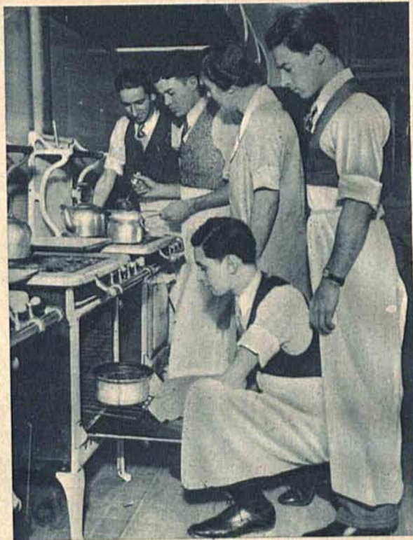
Szkolę gotowania dla kawalerów otworzono w Nowym Jorku.