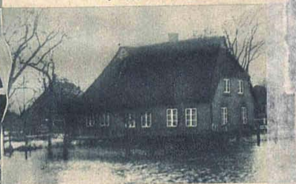
Tegoroczne święta Bożego Narodzenia odbędą się prawdopodobnie wbrew tradycji nie w śniegu lecz w deszczu.