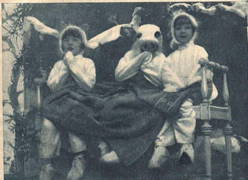
Na lewo: Z zabawy dziecięcej w „Ognisku Oficerskim” (Zielona 20).