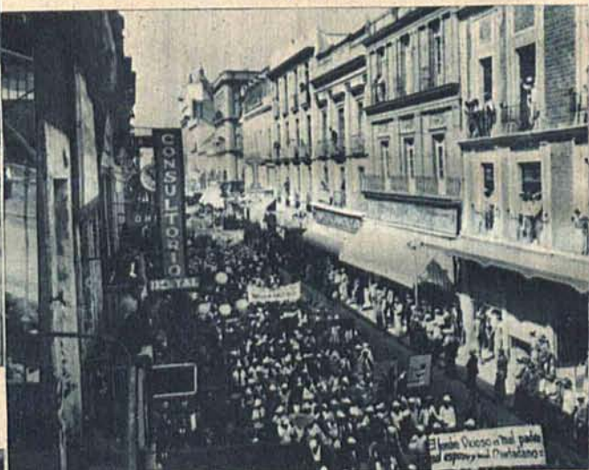
Olbrzymia demonstracja w Meksyku, zorganizowana przez rząd, mająca na celu wprowadzenie prohibicji alkoholowej.