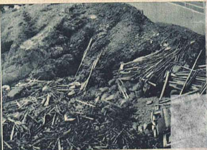
Obraz zniszczenia na wybrzeżu nowofundlandzkim po trzęsieniu ziemi.