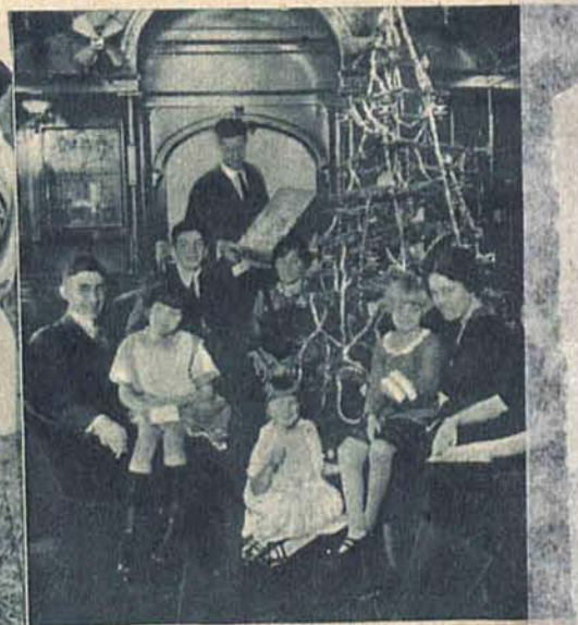
Amerykane przeznaczają dla podróżujących w czasie świąt wagon salonowy gdzie pod wieczorem pod wspaniałym drzewkiem i w świątecznym nastroju śpiewają kołęd.