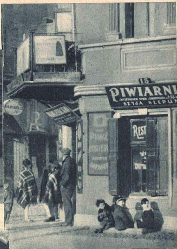
Typowy widok piwiarni na ul. Fajfra (Bałuty).