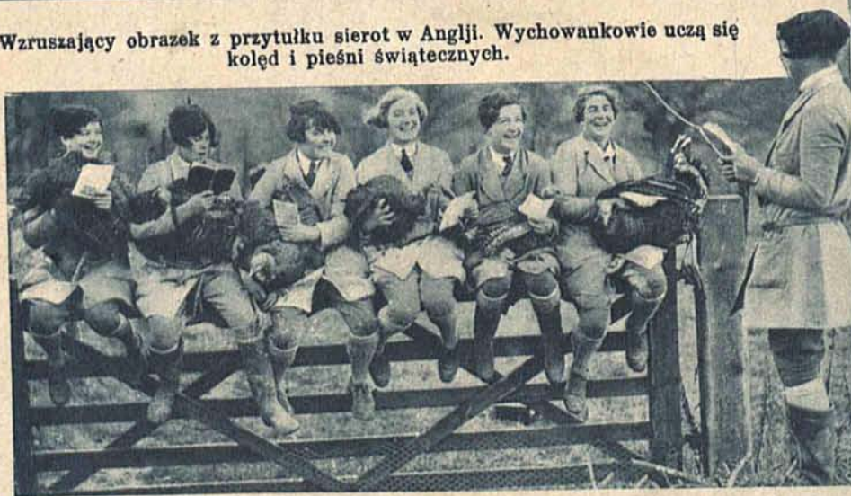
Wesołe hodowczynie drobiu prezentują swe okazowe sztuki przed wysłaniem ich do miasta na sprzedaż.