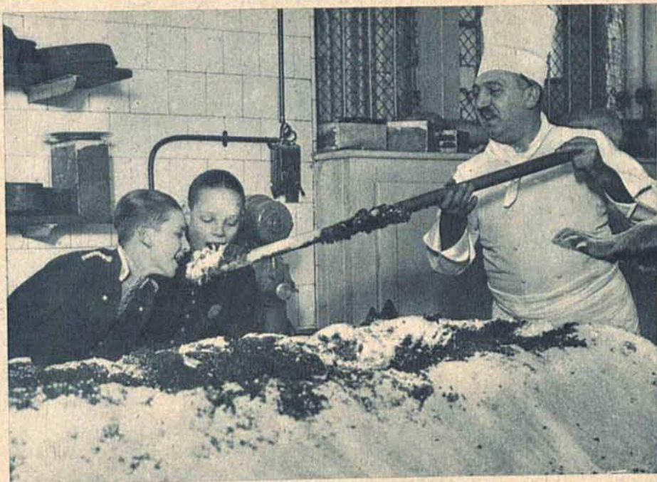
Przygotowywanie tradycyjnego puddingu w największym hotelu londyńskim „Savoy”. Kuchmistrz miészający olbrzymią ilość masy puddingowej daje pokosztować także boyom.