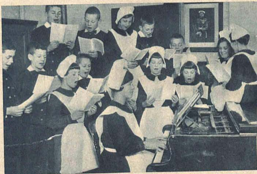
Wzruszający obrazek z przytułku sierot w Anglii. Wychowankowie uczą się kołęd i pieśni świątecznych.