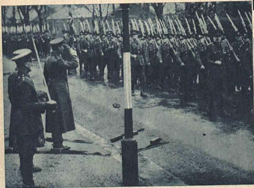
Król duński Chrystjan w czasie swego pobytu w Anglii przyjął parade pułku, którego jest honorowym komendantem.