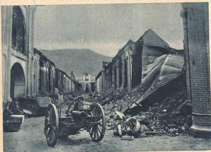
Wygląd głównej ulicy Kabulu, stolicy Afganistanu, po walkach między Bacza Szakao a obecnym królem Nadir Khan.