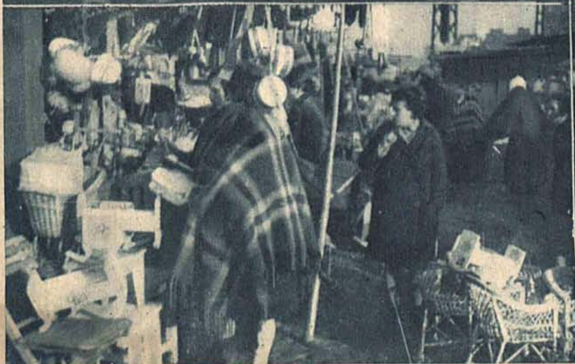
Na lewo: Handel przedświąteczny na Zielonym Rynku.