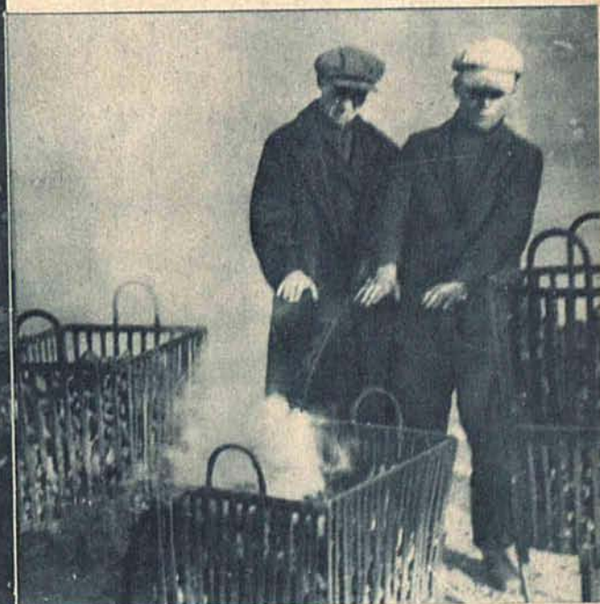
Zima w Łodzi. Na placu Wolności ustawiono piec z koksem.