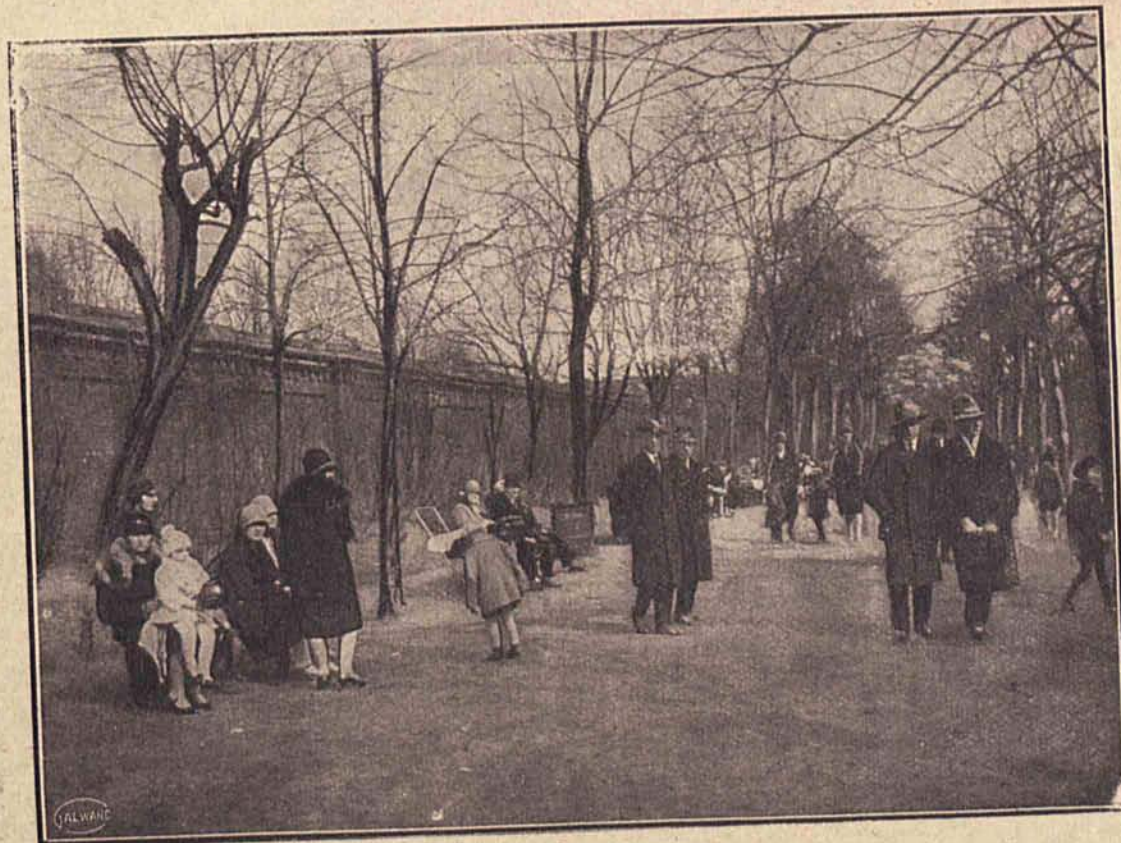
Mimo jesieni w parku im. Sienkiewicza ruch jest b. ożywiony...