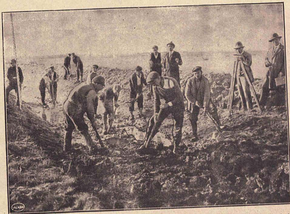
W Rokic'iu pod Łodzią prowadzone są na szeroką skalę roboty w celu zdrenowania tej okolicy