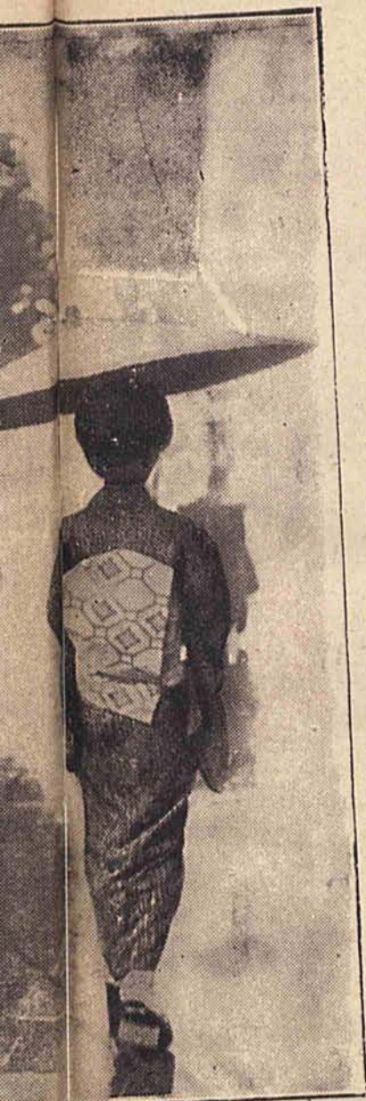
W dzień deszczowy w Osaka (Japonja).