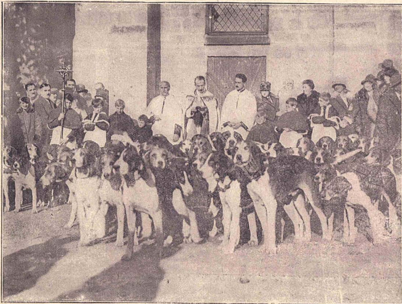
Tradycyjna uroczystość we Francji: w dzień św. Huberta w Fleurines (Seine et Oise) odbywa się błogosławienie zwierząt, aby dobrze spełniały przeznaczoną im przez naturę pracę