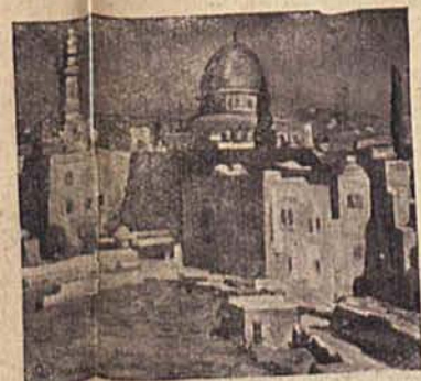
Meczet Omara w Jerozolimie.