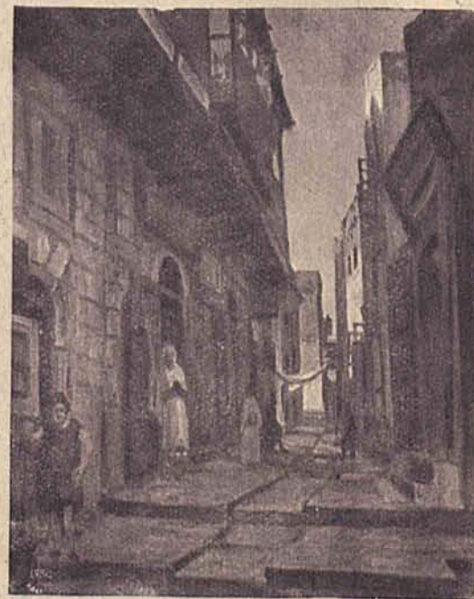
Zaulek w Safed (Palestyna).