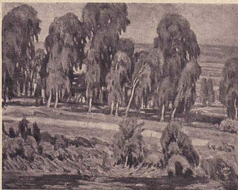
Eukaliptusy w Górnej Galilei (własność Muzeum Narodowego w Krakowie).