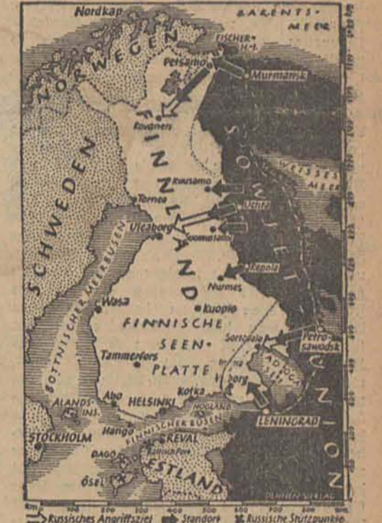
Die neuen Grenzen Finnlands