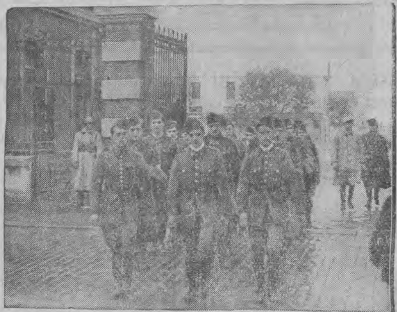
Przysposobienie wojskowe młodzieży we Francji czyni ostatnio wielkie postępy. Na zdjęciu widzimy maszerujący oddział uczniów szkół średnich w mundurach wojskowych