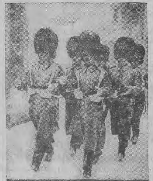
W ostatnich dniach Anglię nawiedziła burza śnieżna. Na zdjęciu widzimy słynnych gwiazdistów angielskich, obejmujących służbę w czasie burzy.