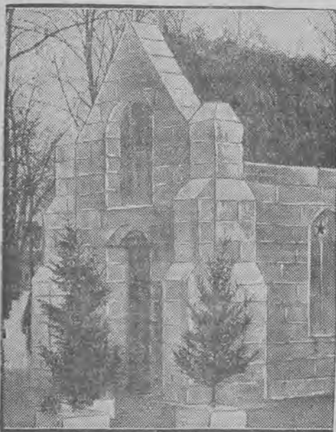
Na północy Stanów Zjednoczonych, wybudowano oryginalną kapliczkę. Jest ona cała zrobiona z oszlifowanych bloków lodu.