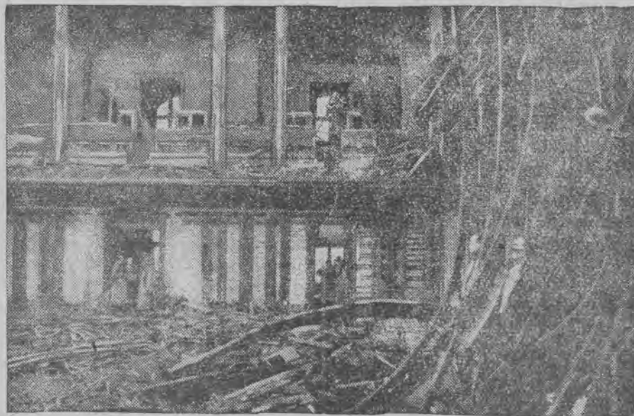
Na zdjęciu widzimy zgliszcza w sali obrad plenarnych parlamentu Rzeszy po likwidacji pożaru.