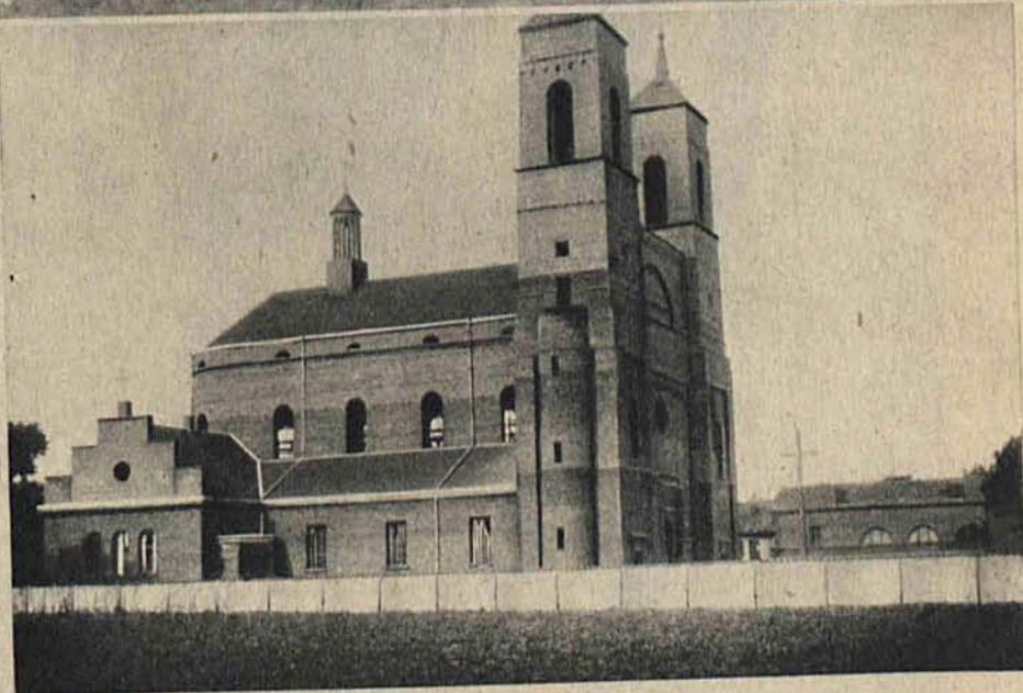
Na prawo: Nowy kościół św. Kazimierza na Widzewie będzie wkrótce oddany do użytku wiernych.