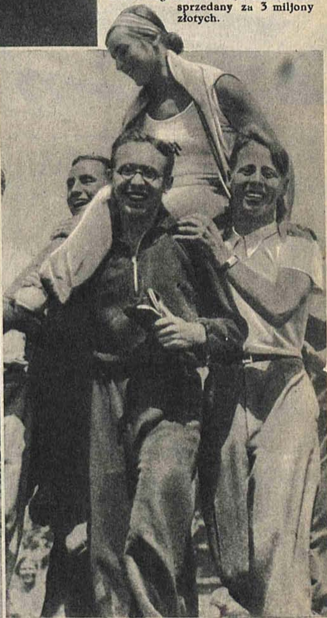
Lekkoatletka niemiecka Gizela Mauermayer ustanowiła wspaniały rekord światowy w rzucie dyskiem 46.97 m.