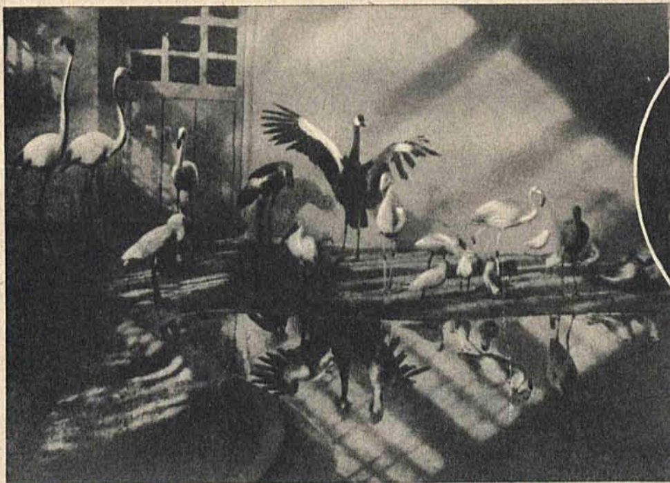
Sztuczna wylęgarnia, w której hoduje się łabędzie, flemingi, gęsi i inne ptaki.