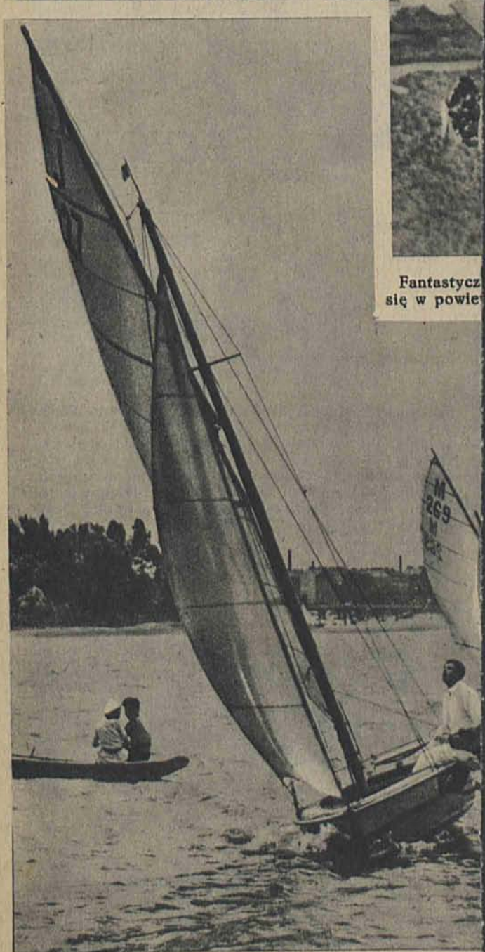
Fantastycz się w powie