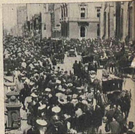
Słynna „5 Avenue” z r. 1905 (u góry) i to samo miejsce w r. 1935 (u dołu).