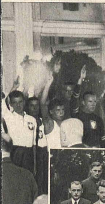
wyznaczonych do grup olimpijskich.