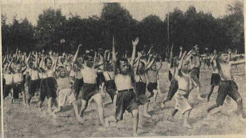
Zarząd obozów dba nie tylko o zaspokojenie głodu, lecz i o zdrowie.