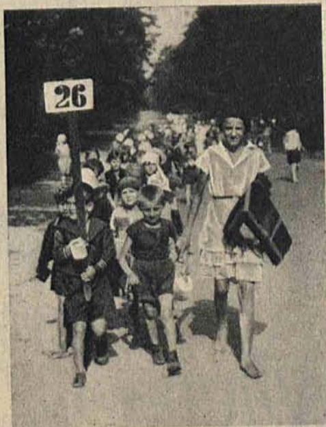
Nad ranem, wymarsz grupowy na śniadanie.

DZIECI ŁÓDZKICH SZKÓŁ POWSZECHNYCH W LETNICH OBOZACH WAKACYJNYCH