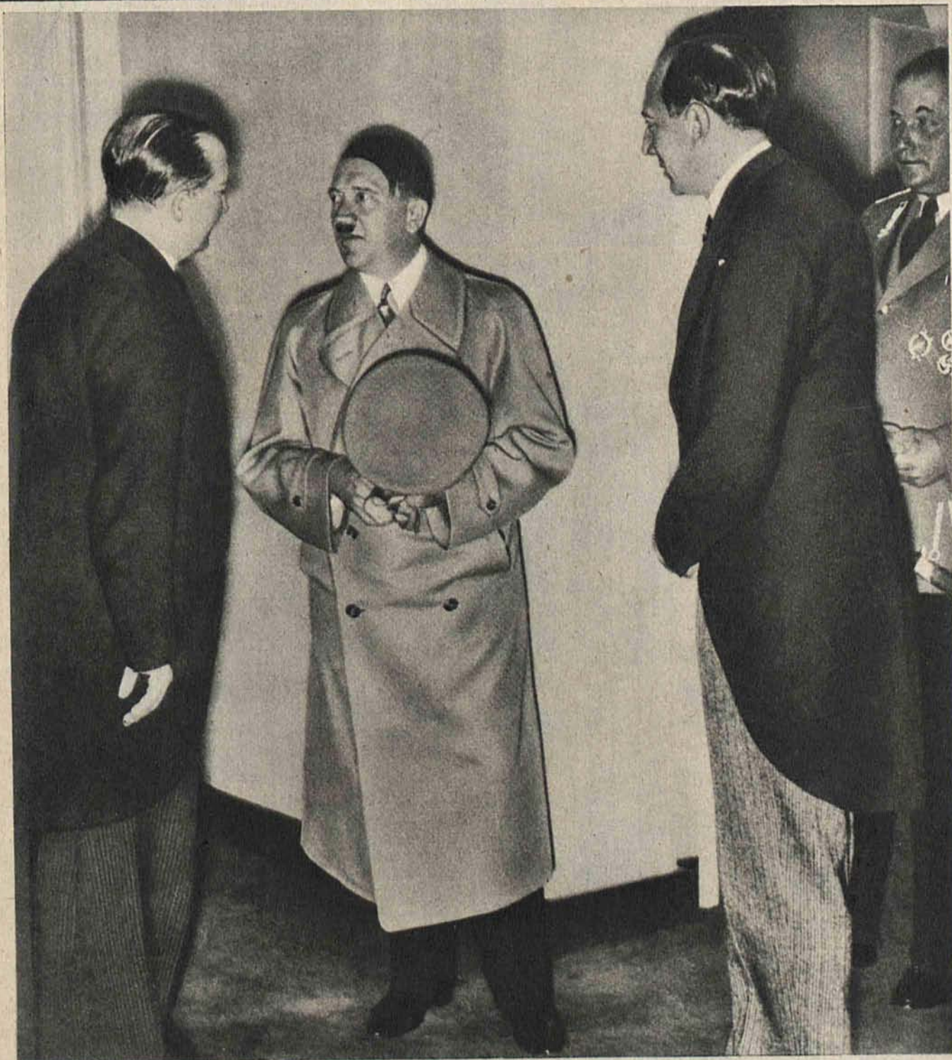
Z pobytu min. Becka w Berlinie. (Od lewej) Ambasador Lipski, kanclerz Hitler, min. Beck.

TYGODNIOWY BEZPŁATNY DODATEK „REPUBLIKI“