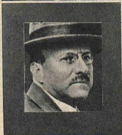
Na prawo: W Paryżu zmarł w 57 r. życia fabrykant samochodów Citroen, którego rodzina pochodziła z Polski.