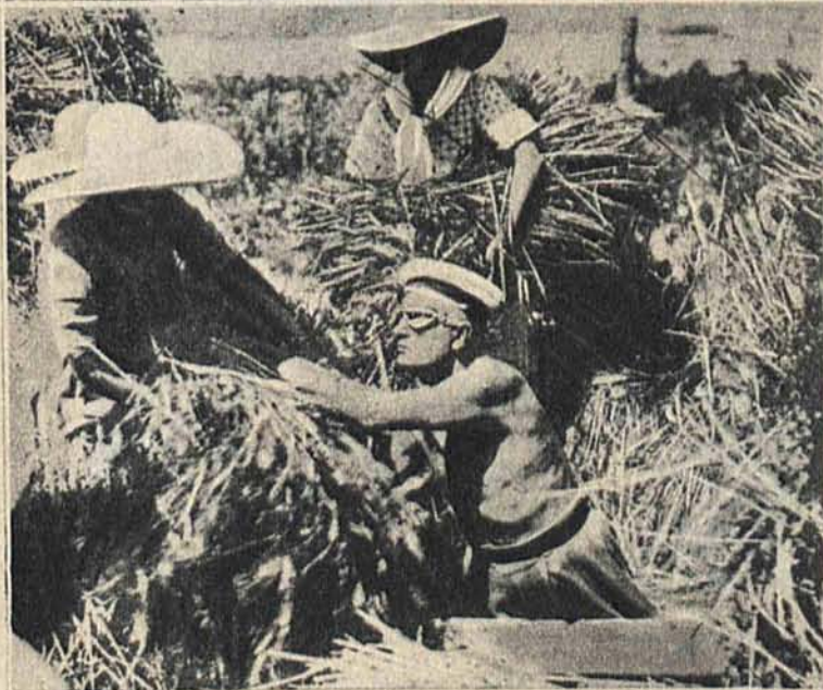
Nalewo: Mussolini pracuje przy żniwach w Littoria.