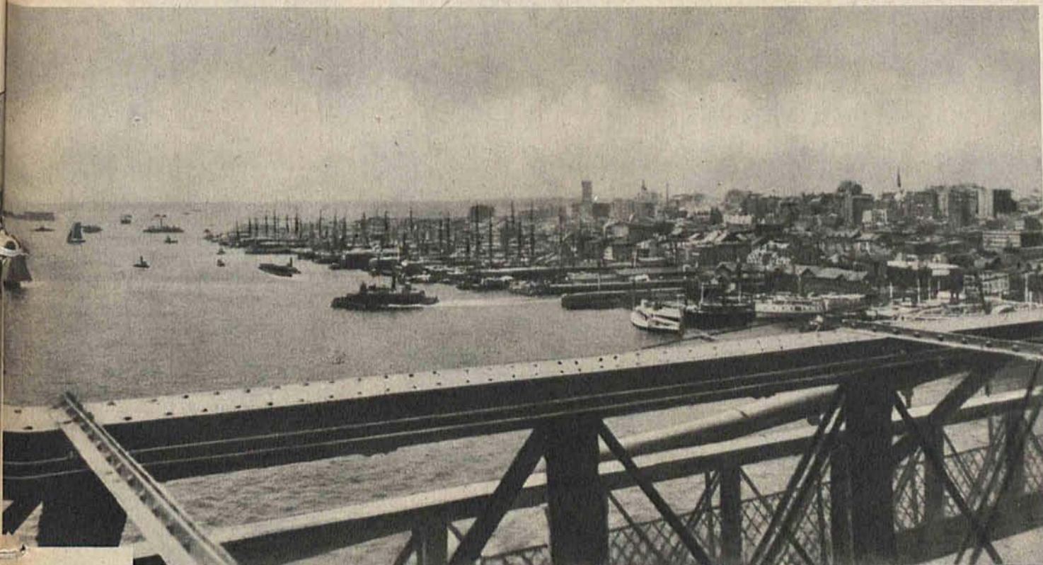
Widok z mostu brooklyńskiego w r. 1880 (u góry) i widok z tego samego miejsca w r. 1935 (u dołu).