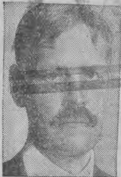
DR. BREITSCHIED, jeden z przywódców niemieckiej socjal-demokracji, uciekł do Anglii.