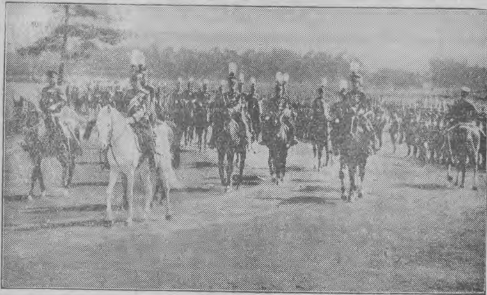
W Tokio odbyła się wielka rewja wojskowa. Paradę odbierał osobiście cesarz Hirohito (na białym koniu).