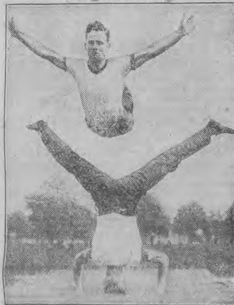
W armji angielskiej wielki nacisk kładzie się na wychowanie fizyczne. Na zdjęciu widzimy efektowne ćwiczenie angielskich żołnierzy.