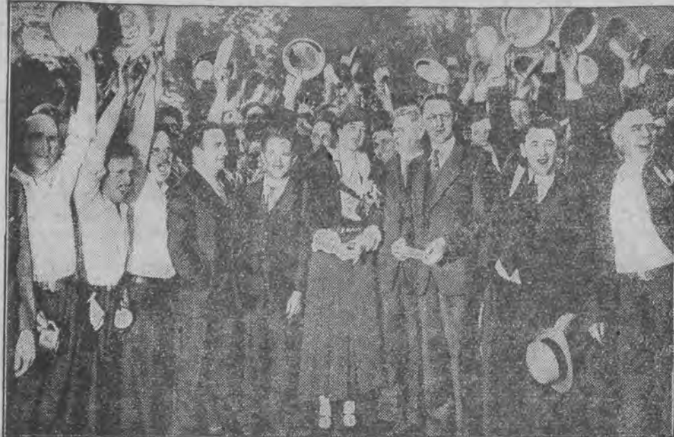
Żona prezydenta Roosevelta, która nosi tradycyjny tytuł „Pierwszej Damy“, zwiedziła obóz weteranów wielkiej wojny pod Waszyngtonem, gdzie została entuzjastycznie powitana. W przeciwieństwie do Hoovera — Roosevelt zamierza przyznać weteranom premie.