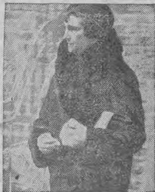
Ex-cesarzowa ZYTA, wdowa po ostatnim cesarzu austriackim, rozpoczęła energiczną propagandę za restauracją monarchii austro-węgierskiej.