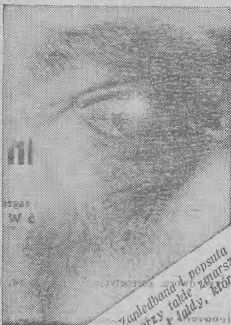
Zamiedbania i popsuta cera tworzy także zmarszczki i łaldy, które

Substancja ta zatyka pory, które są dla skóry żywotnymi organami oddechowymi i doprowadza wskutek tego do osłabienia ścianek naczyń skórnych. Zle funkcjonująca skóra jest zawsze szaro-żółta i staje się szybko fałdzista i pomarszczona — w następstwie czego ma się nie tylko wygląd, ale i poczucie starcze. „Hortiflor-Creme” posiada składniki, które nie tylko że oczyszczają pory, ale doprowadzają do skóry to białko, które, po naukowym stwierdzeniu, czyni ścianki naczyń elastycznymi. Przez to wstrzymuje się fizjologicznie nie tylko starzenie się, lecz odzyskuje młodociany wygląd. Promieniejąco piękna skóra, którą osiąga się przez zastosowanie „Hortiflor-Creme”, jest również wyrazem ogólnie dobrego samopoczucia. Chcąc dać WP. możność przekonania się naocznie o skutkach „Hortiflor-Creme”, prosimy odciać umieszczony tu bon gratisowy i przesłać go nam frankowany, poczem wyślemy odwrotnie bezpłatną próbkę „Hortiflor-Creme”, jak również broszurkę, oraz uznania lekarskie z kół używających kosmetyków Hortiflor.