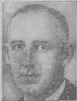
PROF. MOLEY, specjalny delegat prezyden- ta Roosevelta, ma uratować konferencję gospodarczą w Londynie.