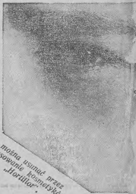
można usunąć przez stosowanie kosmetyków „Hortiflor”