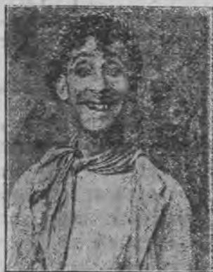
ארטיסט זישע קאץ.

יידיש-טעאטער. נאכט-אארשטע פונקט פון ארטיסט ו. האץ אין פילדארמאניע.