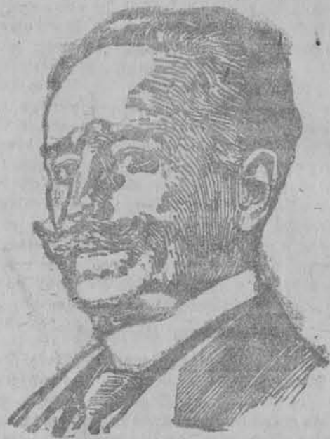
Podjęcie prezydenta Polnarego.