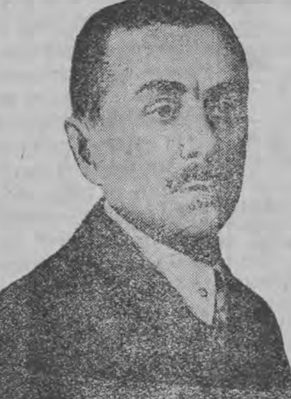
דער פארטיידיגער פון וועלשטישקין, א.ד.ו. מאנאטע.