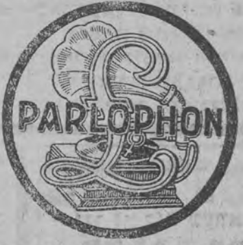
אריינצאל פארלאפאן נור מיט דער שוץ-פארקע

פראמישער האפער-פארלאפאן בעסטע אויסארפייטונג. יאס איז שייך דער פיינקייט פון דער שטומע שטייט עס גוט ערגער פון די מייסטע פארשטען. גרויסער אויסוואהל פון פרייטען פון קאנטאר יאסעלע ראזענבלאט, ניו-יארק. 577