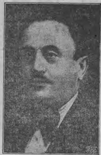
דער נייער מאַגיסטראַט האָט שוין אָנגעהויבען זיין אייגענטיכע אַרבייט.

ציוויל-שטאַנדס-אַמט, וועלכע בעשעפ טיגט זיך מיט די דאָקומענטען פון דער נישט-קריסטליכער בעפעלקערונג. וואָס שייך דער נייער מאַגיסטראַט-מעהרהייט אַריבערנעמען זיך זיינע מיט-גלידער זעהר נוט און שנעל אין אַלע קאַמונאַלע פּראָגען. ס'פיהלט זיך אַ גע-זעלשאַפטליכע רוטין און אַ ווילען צו דער אַרבייט. די אַרבייט פון מאַגיסטראַט וועט איצט זיין לייכטער דערפאַר, ווייל ס'איז פּערהאַן אַנ'אויסגעשפּראַכענע מערהייט און ס'וועלען אויפהערען די אַמפּערייען און די קליינליכע חלוקי דעות, וואָס האָבען געהערשט צווישען דער ביז-איצטיגער געשטיקעוועטער מערהייט. איך גלויב דעריבער, אז די גרויסע פּלענער, וואָס דער איצטיגער מאַגיסטראַט האָט זיך געשטעלט, קעגען אַדוירכגעפיהרט ווערען.