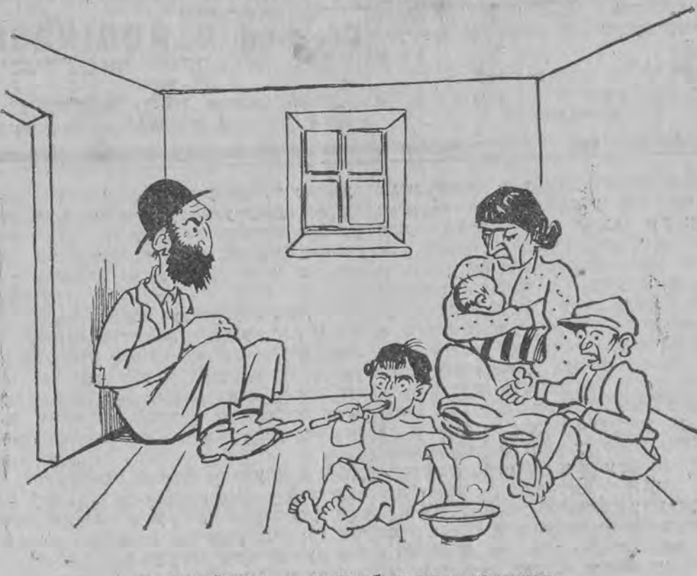
אַפּגעשטרייקט און געבליבען ביי אַ "ריינער" דירה.