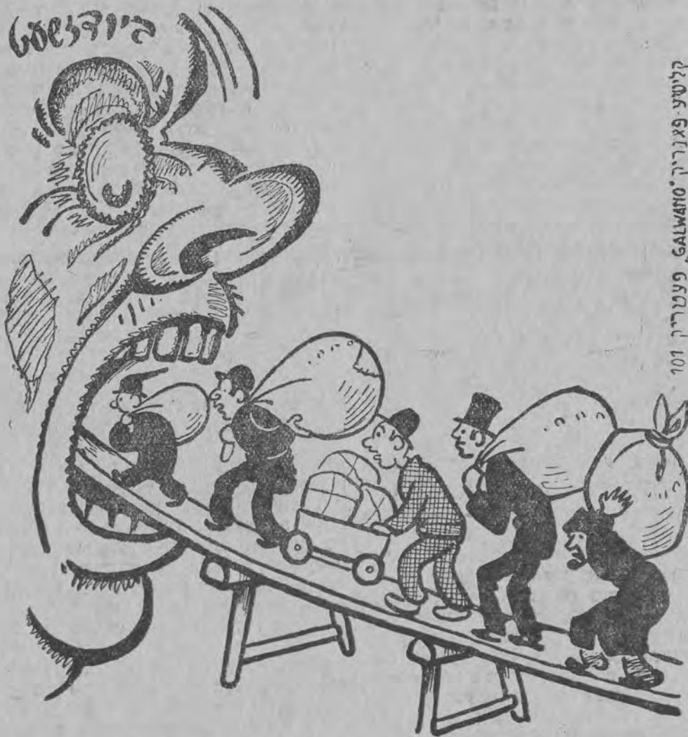
קליטשע פארניך, Galvano, פעטריך 101

ס'האט'ט מיר זיך ברויט געקעפט פונקט א ווערט וואס זיך געקעט ס'וויפען מענשען טראגען פעקלעך, דער ביהושעט מוז זיך געדעקט.