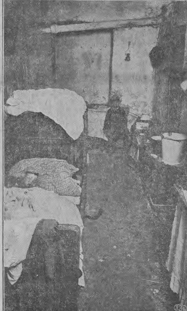
קעלער-שטוב אויף פעפער נאָס 19. פּאַס. ה. סראַקא.

און, אַז ס'רעגענט ווערט טאַקע די דירה פול מיט וואַסער און שכנים שטעהען מיט די עטערס און קוואַרטען און שעפען אים דאָס וואַסער פון ס'קומט נישט אַ נייער רענען, פאַר דער דאָזיגער