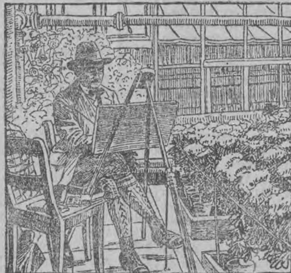
Książę pruski August Wilhelm zajmuje się malarstwem w oranżerii Sanssoniej.