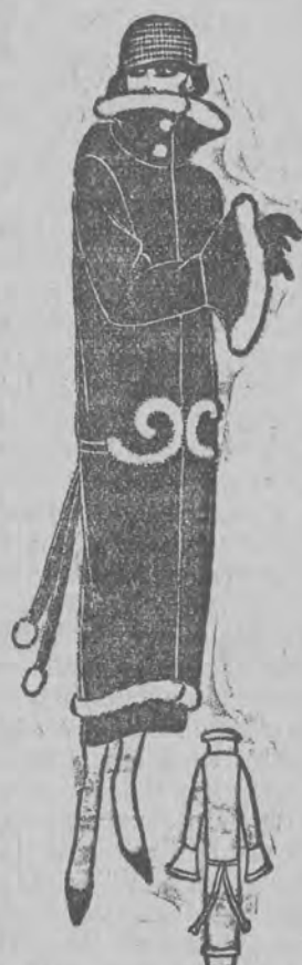
PŁASZCZ Z VELOURS.

Płaszcz odpowiedni do lekkich sukien teatralnych i wieczorowych, koloru cerise. Podszewka przybrana galonem. Obszycie z białego lisa.