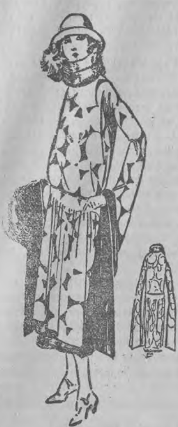
SUKNIA Z AZURKAMI.

Oryginalny model. Spód sukni zrobiony z satyn koloru czarnego u dołu oszty. Futrem. Wierzch kolorowy, ozdobiony wzorem z tiulu i azurków, z poza którego prześwieca czarne tło satyn. Rękaw rozszerzony są adający, aż ku dołu sukni.