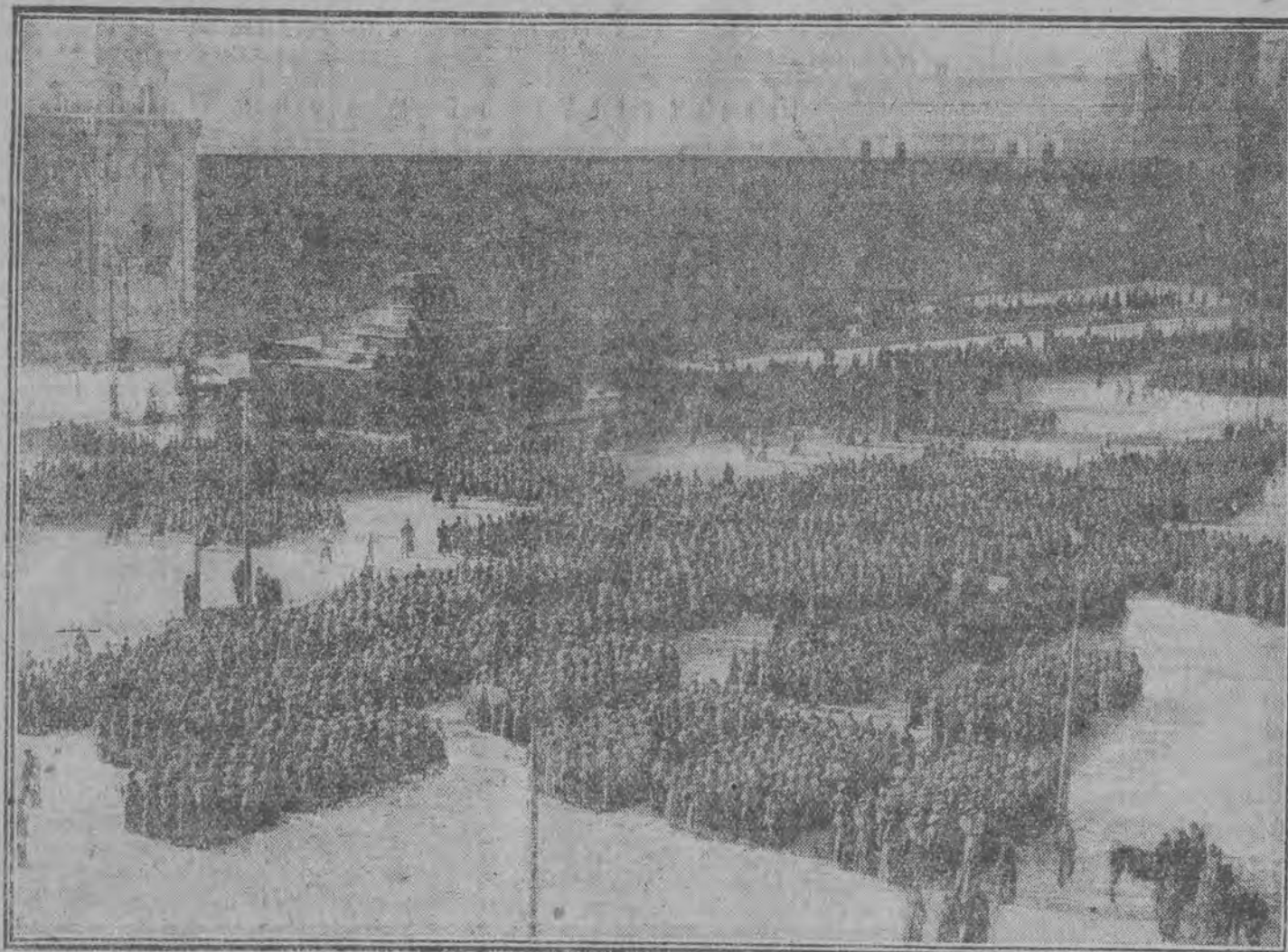
Obchód 1-go maja w Moskwie