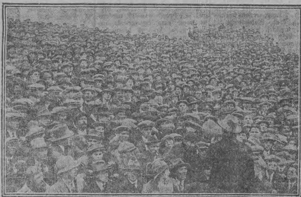
o mistrzostwo I ligi zawodowej w Anglii. Przeszło 100.000 widzów zgromadziło się na boisku

Pomijając jednak niektóre złośliwości, wypowiedziane pod adresem sędziów, stwierdzić wypada, że tworzą oni także element dla sportu dodatni. Nie tylko w kierowaniu zawodów, lecz w poważnym wpływie na jakość i charakter ruchu sportowego, doszukiwać się trzeba znaczenia tego elementu. Im to właśnie zawdzięcza sport utrzymanie poziomu rywalizacji, oni stoją na straży jego idei a że w tym celu posługiwali się muszą całym kodeksem praw i reguł, to jest to objaw nieodłączny od każdego życia normowanego.