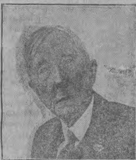
Amerykański król naftowy ukończył 85 lat życia