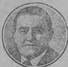
Słynny rzeźbiarz czeski, zmarł w Pradze przed paru dniami i tam został pochowany.