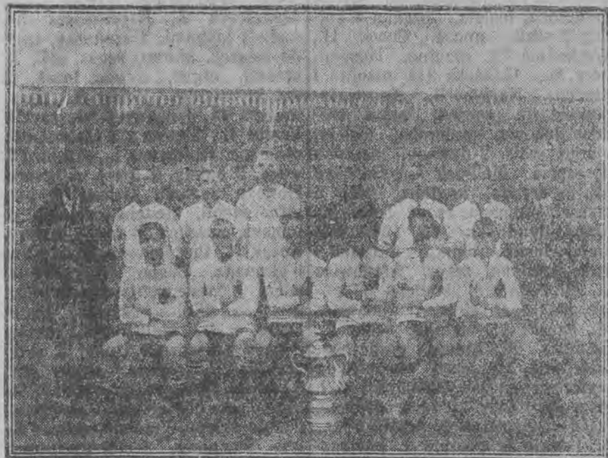
Jedna z najlepszych drużyn angielskich rozegrała mecz z Hakoahem wiedeńskim z rezultatem 1:0.