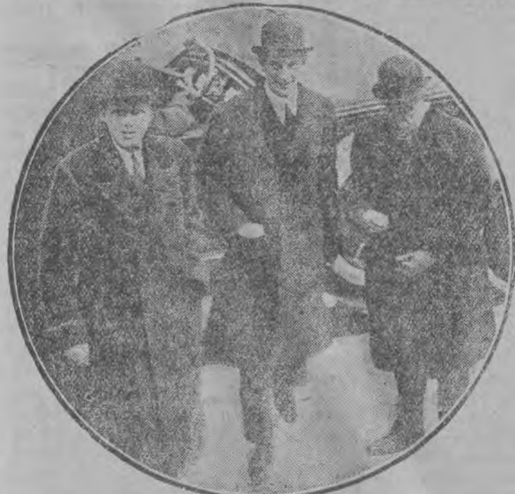
Wnuk Wilhelma odwiedził w czasie swej podróży po Europie królewską rodzinę w Madrycie. Na ilustracji naszej widzimy go (na lewo) w towarzystwie hiszpańskiego następcy tronu (po środku).