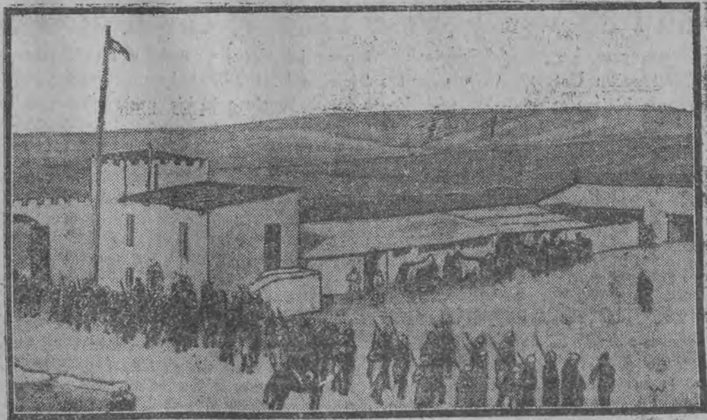
Francuskie oddziały bojowe w Soueida, które wielokrotnie atakowały oddziały powstańcze druzów

Nie wolno podwyższać cen! Przed sądem staną nieuczciwi kupcy