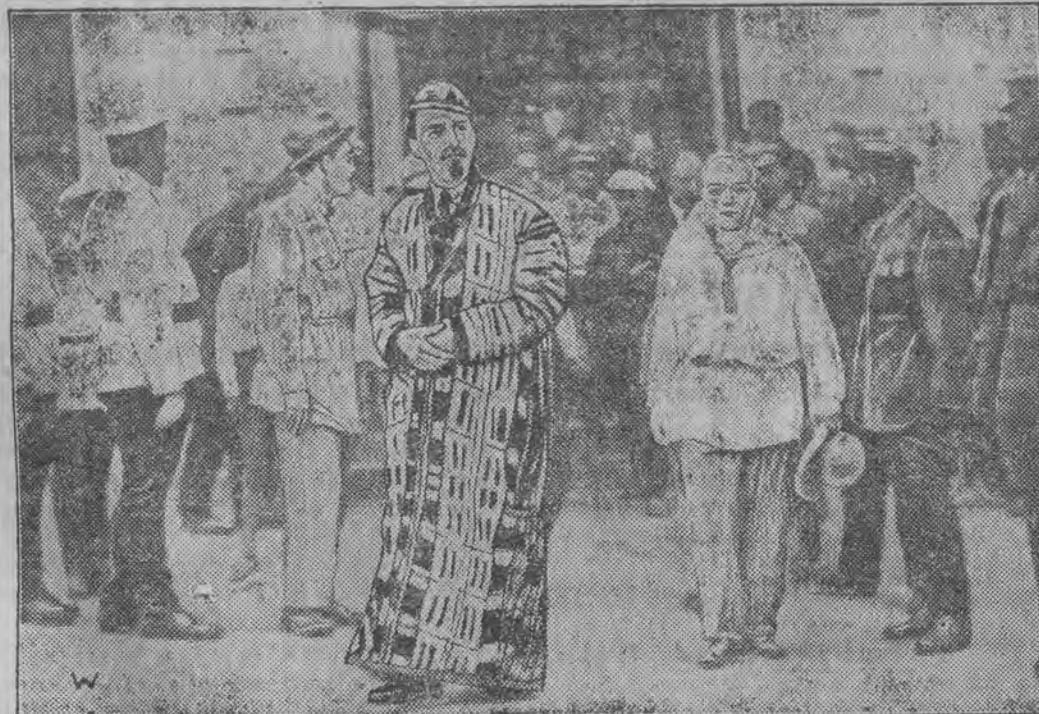
Przedstawiciel kupiectwa turkiestańskiego w stroju narodowym na jarmarku w Niżnim

Członkowie rady gospodarczej nie będą mianowani, a tylko delegowani przez różne instytucje społeczne, izby handlowe i t. p.