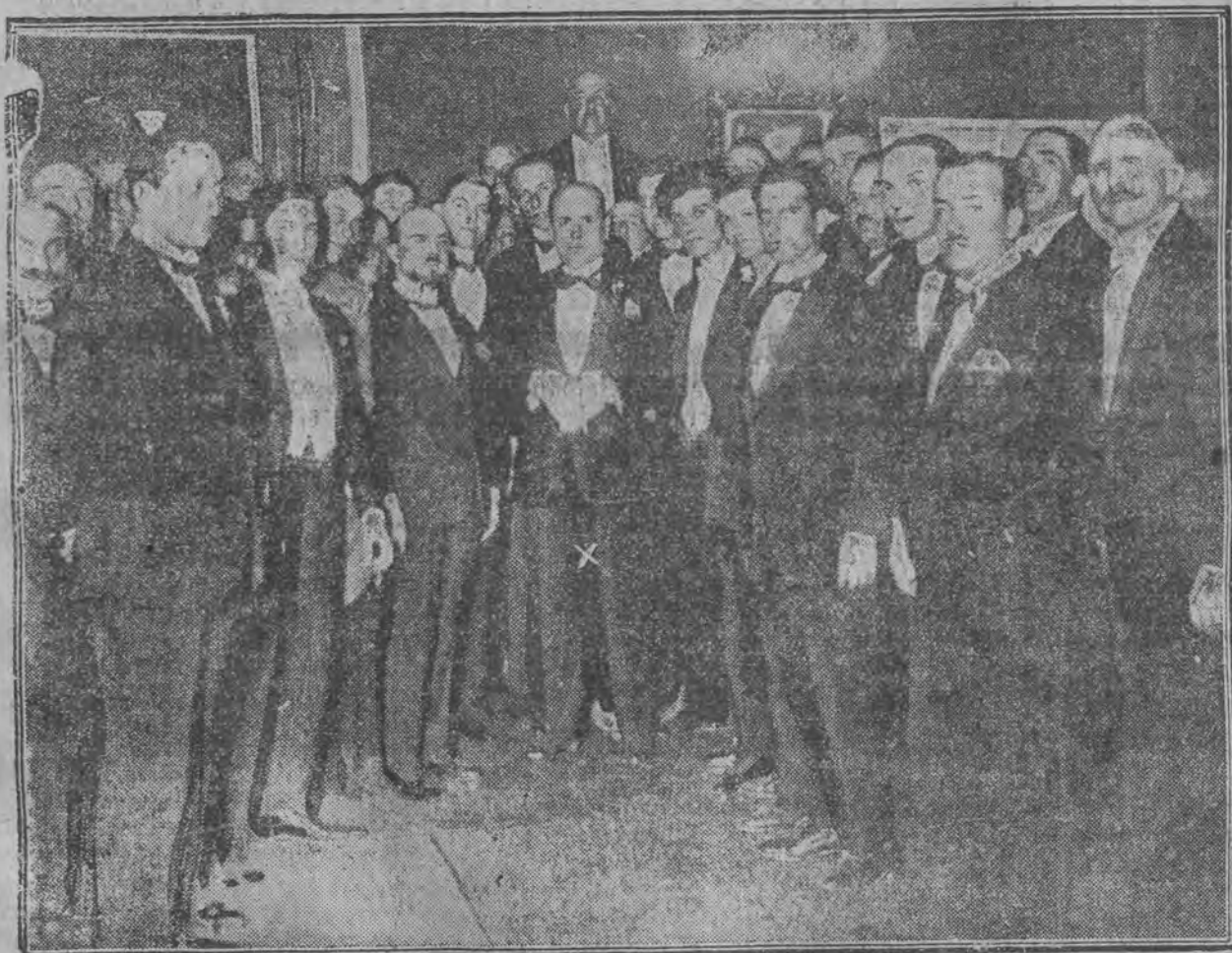
Wielkie przyjęcie dyplomatyczne u Mussoliniego (x)