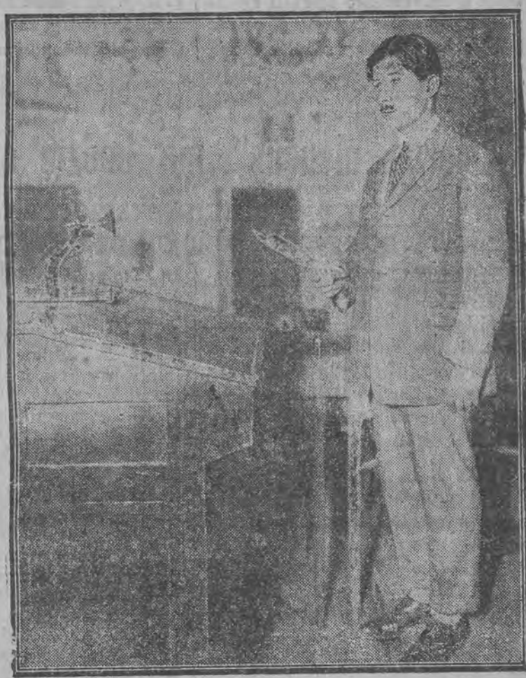
Nowoczesny trybun przemawia do tłumów przez radio